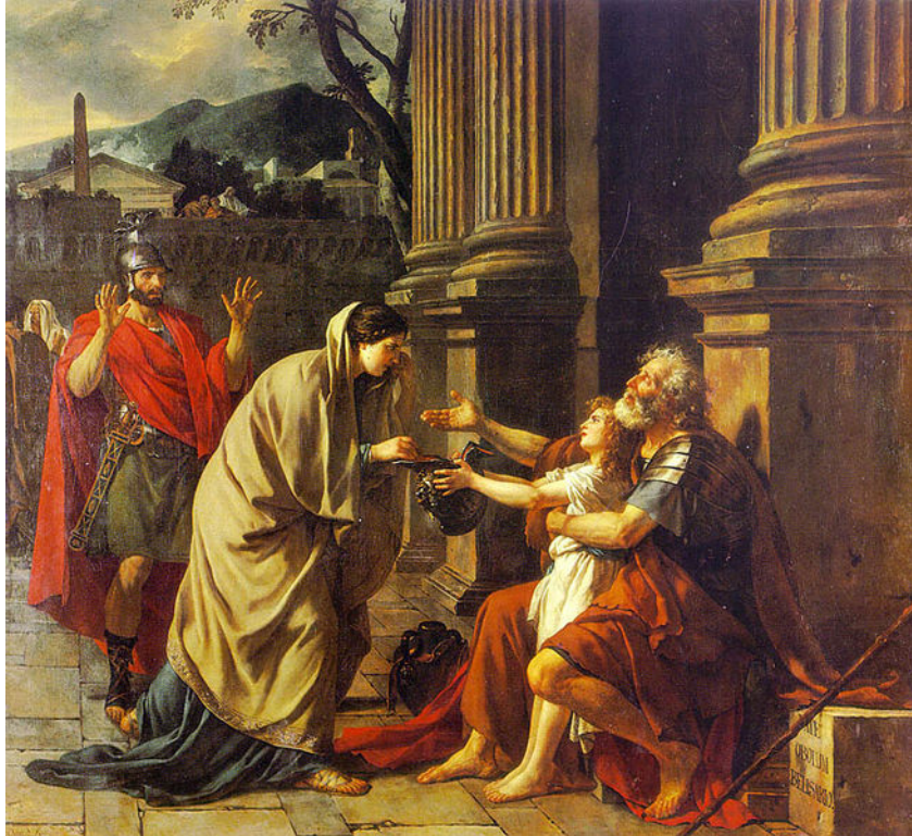
Jacques-Louis David, Bélisaire recevant l'aumône , 1781