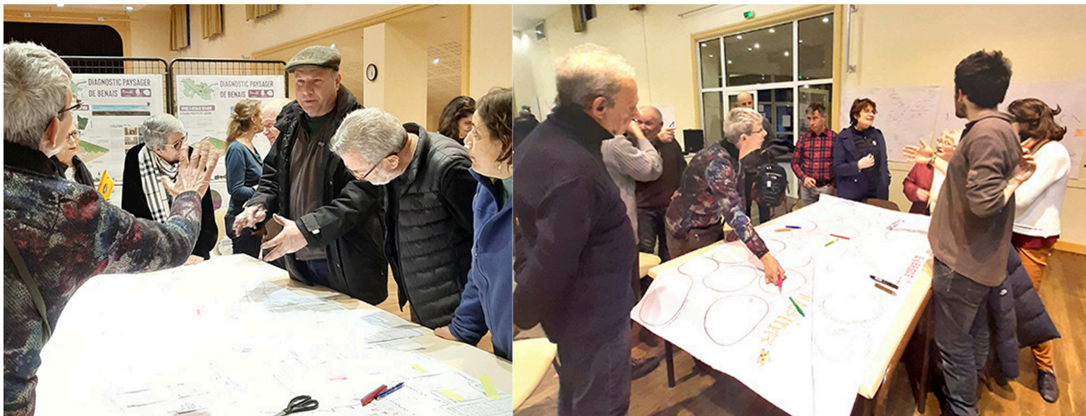
Figure 1 : Atelier étudiants-habitants dans la salle communale, Benais, Indre-et-Loire, 2020