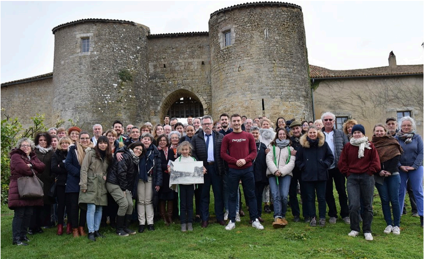
Figure 3 : Photo de groupe à la fin de la résidence à Château-Larcher, Vienne, 2019