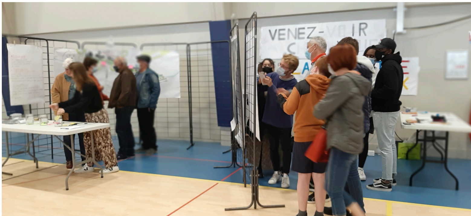
Figure 2 : Discussion autour de dessins représentant le début du diagnostic des étudiants, La Mothe-Saint-Heray, Deux-Sèvres, 2021