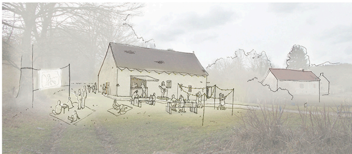
Figure 4 : Exemples de travaux d'étudiants, Auzances, Creuse, 2017