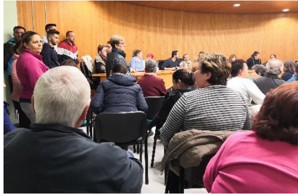
Fig.10. Illustration de terrain d'assemblée plénière. Ces dernières commencèrent à faire écho aux rapports de force présent au village de par la conflictualité régnante.

ou non cristallise une conscience historico-sociale chez un groupe et c'est cela qui les formes en tant que génération. Pour Marinaleda, les anciens et une partie de leurs enfants se sont composés comme génération au travers d'événements marquants que sont les luttes ou la fin du régime de Franco. Ils ont donc eu une socialisation par traumatisme qui détermine aujourd'hui la façon dont ils perçoivent leurs stratégies et ce qu'ils ont mis en place. Mais pour les plus jeunes, qui n'ont pas vécu d'événements importants ou marquants, nous allons parler de socialisation « d'ayants droit », c'est-à-dire par laquelle ils ont été protégés et n'ont jamais connu de grandes difficultés. Ils ont pu jouir de ce qu'ont obtenu les anciens comme une normalité.