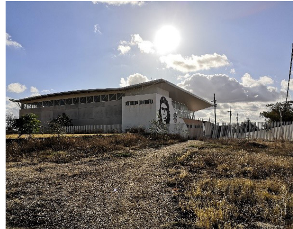
Fig.5 et 6. À gauche, un tag se trouvant sur la rue principale du village indiquant « contre le capital, la guerre sociale ». À droite, le gymnase du village orné par Che Guevara.

De fait, on distingue que toute cette alternative politique va se bâtir en réponse au latifundium, mais plus largement au capitalisme qui s'y lie : en effet, le latifundisme est un modèle qui implante très tôt le capitalisme en milieu agricole andalou au travers de la salarisation des travailleurs et de l'orientation marchande de la production. Dans ce contexte, les travailleurs vont être violemment expulsés de leurs terres qui sont octroyées à la grande bourgeoisie, ils vont être transformés en journaliers agricoles et par conséquent en force de travail dépossédés de leurs moyens de production. Alors, le latifundisme s'identifie sociologiquement comme « une structure sociale génératrice d'inégalité » (Sevilla Guzman 1981). C'est un système politique qui organise la vie des paysans andalous et qui les maintient dans une situation d'extrême précarité.