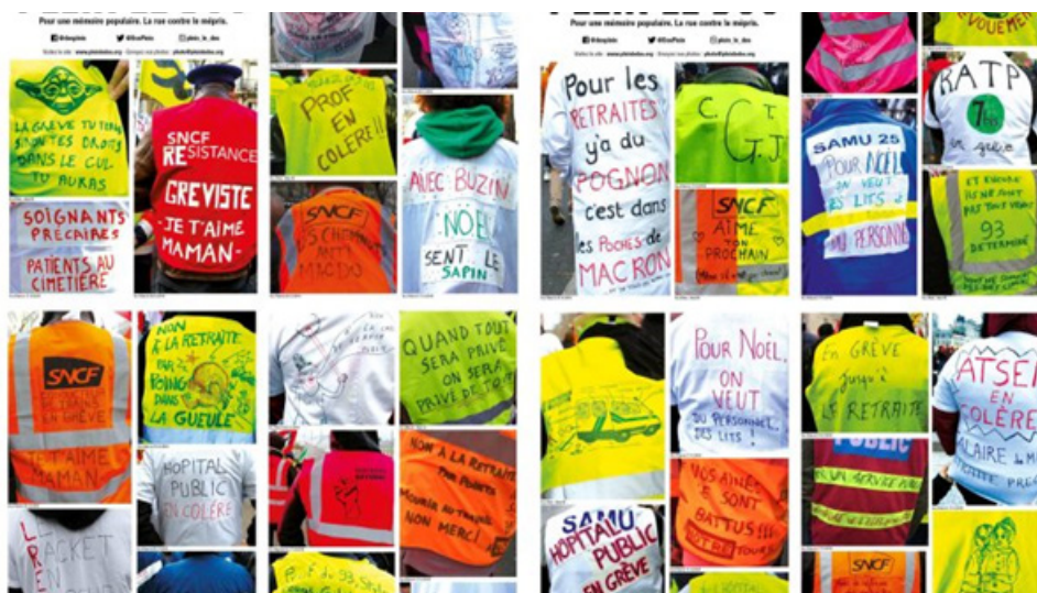
Fig.1. Numéro spécial Soutien aux caisses de grève, janvier 2020 – 2000 exemplaires

En premier lieu, les auteurs du récit mélancolique font un usage des voix narratives qui diffère de celui des récits jupitériens. Dans leurs narrations, un « nous » collectif s'affirme sur les ruines d'un « je » décomposé. Prenons l'exemple suivant, tiré de l'archive « plein le dos », géré par un collectif de Gilets Jaunes :