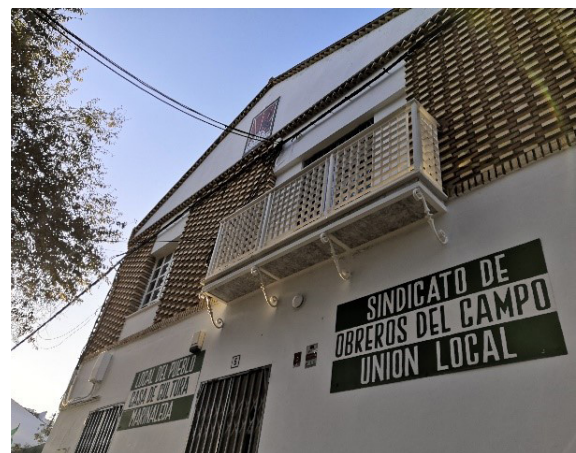
Fig.7 et 8. À gauche, le café du syndicat contenant l'inscription « un autre monde est possible ». À droite, l'entrée du syndicat des travailleurs agricoles.

Aussi, comme nous l'avons évoqué, le fait que les infrastructures soient décorées de tags spécifiques ancre visuellement l'opposition dans l'espace public. Plus encore, les noms des rues sont rebaptisés 6 par les habitants afin de s'approprier dans les moindres détails cet espace alternatif. De fait, nous pouvons dire que la création et l'incarnation