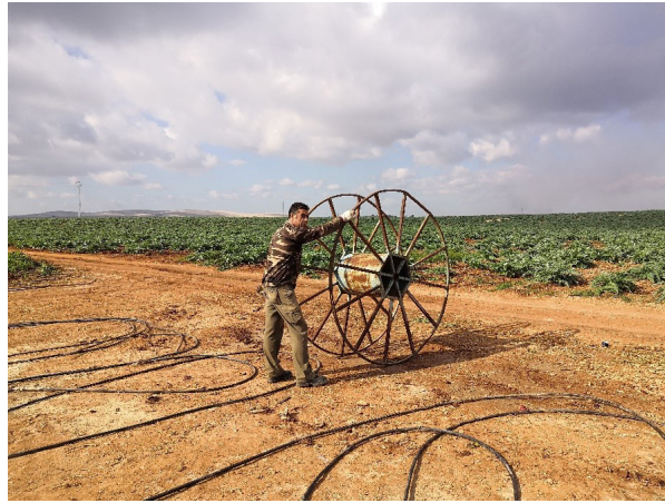
Fig.1. Illustration de terrain du travail au champ, sur le domaine El Humoso, terre conquise lors des luttes.

pacifique pour acquérir des terres. Elle durera une quinzaine d'années et face à leur détermination, 1200 hectares leur sont cédés en 1991 et sont rendus collectifs.