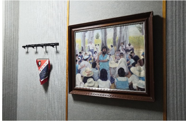
Fig.9. Tableau figurant dans l'ancienne maison de la culture, montrant le maire du village entouré des habitants.

plénières plus régulières. Il y a donc une dichotomie des représentations du village et des rapports de force dans lesquels il est pris. Pour les plus jeunes, le besoin d'un leader voulu par les plus anciens n'est pas légitime, car ils sont habitués à ce système et ne placent pas le village dans une situation de lutte permanente. De plus, si pour les plus âgés il n'est pas possible de « faire lutte » sans leader, les plus jeunes posent la question et mettent en branle l'autonomie politique qui se doit alors de reconsidérer cet état de fait sur lequel ils se sont bâtis.