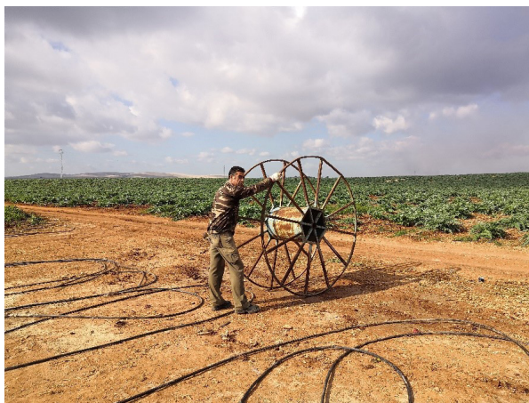
Fig.1. Illustration de terrain du travail au champ, sur le domaine El Humoso, terre conquise lors des luttes.

pacifique pour acquérir des terres. Elle durera une quinzaine d'années et face à leur détermination, 1200 hectares leur sont cédés en 1991 et sont rendus collectifs.