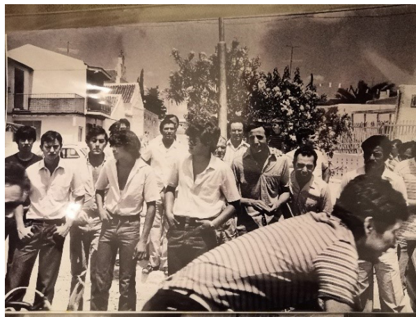
Fig.2. Image d'archive d'un groupe d'habitant se répartissant le travail bénévole à la construction du village.

ou encore une « violence douce, invisible, méconnue comme telle, choisie autant que subie, celle de l'obligation, de l'hospitalité, du don, de la dette, de la reconnaissance, etc. » (Bourdieu 1979). C'est une violence qui a toujours pour conséquence de blesser l'estime de soi des individus à travers leurs identifications privilégiées à un groupe ou un territoire, etc. (Braud 2003). La violence est alors ressentie au travers d'un mal-être d'ordre psychologique : humiliation, insécurité, rancœur, dégoût, etc. Il apparaît alors le caractère particulièrement douloureux des atteintes portées à l'individu. Et c'est contre cette forme de violence symbolique que ce village apparaît comme un bouclier. L'exemple d'un habitant vient illustrer cette idée. Ce dernier m'explique rapidement qu'avant de vivre à Marinaleda, il « se sentait inutile, il n'était rien et n'avait rien ». Son impossibilité à trouver du travail le pesait « terriblement ». La violence symbolique est alors bien identifiable au travers des propos comme « se sentir inutile ». Ce sont toutes des idées, des façons de penser qui se répandent dans la société actuelle et qui dominent. La violence symbolique est un rapport de force implantée par le capitalisme qui norme la société actuelle. De fait, elle influe sur l'identité de soi et sur la place accordée à notre existence sociale.