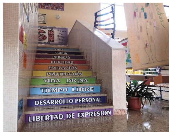
Fig.3 et 4. À gauche, fresque dessinée par les enfants du collège contre les violences faites aux femmes. À droite, l'escalier des valeurs menant aux salles de cours. Chaque marche évoque une valeur spécifique.