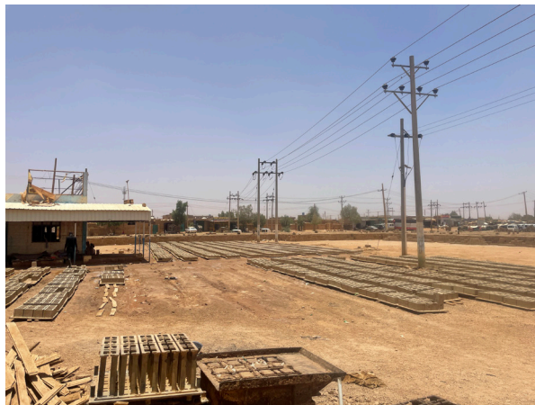
Fig.6. Usine de parpaings de ciment à Salha, au sud ouest de Khartoum. © Auteur, 30 avril 2022.

Face à ce matériau artisanal, deux concurrents aux fonctions équivalentes se sont développés dans un contexte d'explosion du secteur de la construction. Le parpaing de ciment est un matériau ancien à Khartoum, mais sa production s'y est intensifiée depuis le début des années 2000. Cela est dû à l'importation de chaînes de montage depuis la Turquie, ce qui a permis à de nombreux petits producteurs de s'installer, notamment dans les périphéries de la capitale (Fig.6). Les parpaings ne sont pas toujours contrôlés et testés, mais leur méthode de fabrication, par compression et sans cuisson, impose un moule unique et standardisé (Fig.7).