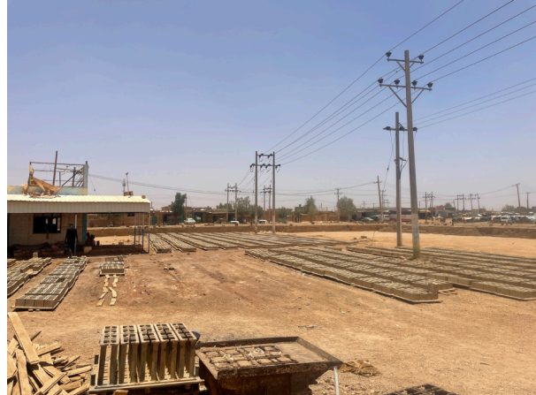
Fig.6. Usine de parpaings de ciment à Salha, au sud ouest de Khartoum. © Auteur, 30 avril 2022.

Face à ce matériau artisanal, deux concurrents aux fonctions équivalentes se sont développés dans un contexte d'explosion du secteur de la construction. Le parpaing de ciment est un matériau ancien à Khartoum, mais sa production s'y est intensifiée depuis le début des années 2000. Cela est dû à l'importation de chaînes de montage depuis la Turquie, ce qui a permis à de nombreux petits producteurs de s'installer, notamment dans les périphéries de la capitale (Fig.6). Les parpaings ne sont pas toujours contrôlés et testés, mais leur méthode de fabrication, par compression et sans cuisson, impose un moule unique et standardisé (Fig.7).