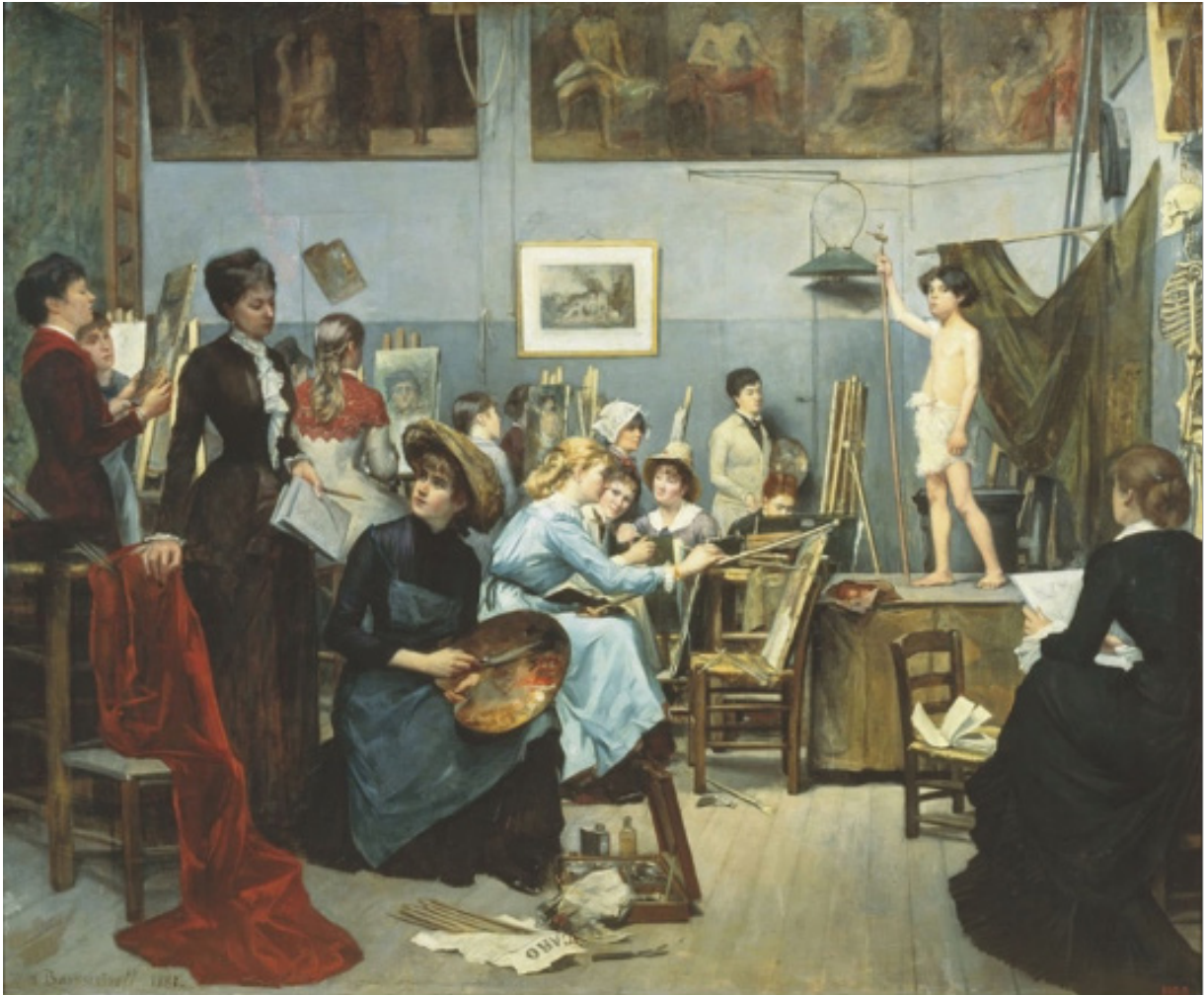
IMG_2 Marie Bashkirtseff (1858-1884), L'atelier des femmes chez Julian, 1881, huile sur toile, 188 x 154 cm, Musée de Beaux-Arts, Dniepropetrovsk, Ukraine.

Les artistes femmes qui en sont privées sont par conséquent fortement discriminées pour accéder au statut d'artiste professionnelle. Comme le dénoncent les historiennes de l'art Griselda Pollock et Rozsicka Parker, au-delà de l'obstacle économique pouvant constituer un frein aux ambitions artistiques des femmes, elles sont d'emblée exclues