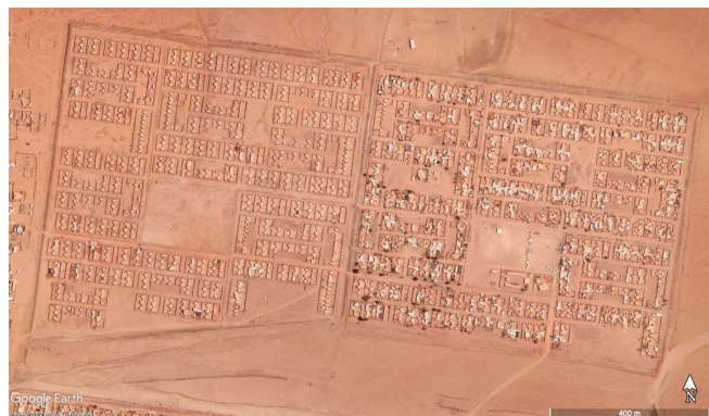
Fig.13. L'aménagement standardisé du logement social à Wadi Al Akhdar.