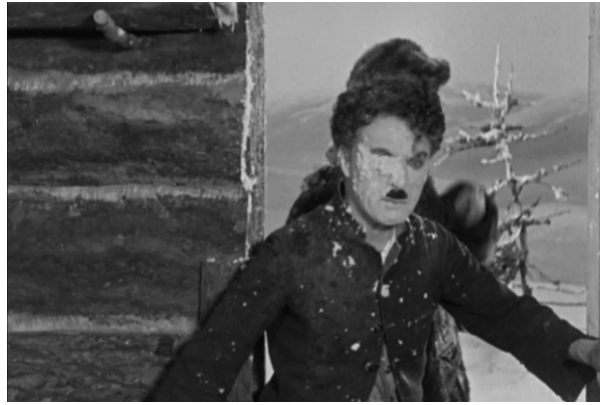
La Ruée vers l'or , Charles Chaplin, 1925

collisions (il est facile de les associer à la surprise, à la peine, au désarroi ou à la solitude des personnages), le corps burlesque apparaît comme le plus lourd de tous et de très loin : à la manière d'une planète qui exerce sur les éléments environnants une intense force d'attraction, il conduit jusqu'à lui tout ce qui passe suffisamment près pour entrer dans son champ – champ gravitationnel, qui recouvre aussi le champ de l'image dont il occupe le centre. Puisque les images sont faites de matières, elles le sont aussi de masses distinctes qui agissent les unes sur les autres et auxquelles le burlesque initie notre regard. Il ne s'agit donc pas seulement ici d'accoler les corps et de les maculer de différentes matières : chaque élément est doté, en plus d'une texture, d'une densité propre et d'un poids qui le met naturellement en relation avec les autres. Avant que ne s'en mêlent les sentiments, les corps s'attirent et se repoussent : d'autres drames se composent en marge des inadaptations sociales, et replacent le corps humain dans un réseau élargi de présences concrètes.