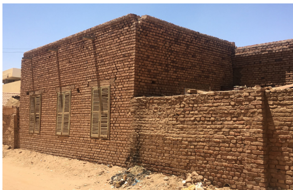
Fig.3. Une maison traditionnelle à Burri. © Auteur, 18 avril 2021.

Malgré l'augmentation du nombre de ces ateliers, divers acteurs, locaux et internationaux (Pantuliano et al., 2011), privés et publics, se retrouvent désormais sur une remise en cause de cette activité. Parmi les arguments mobilisés, les différentes formes de pollution causées par les briqueteries reviennent régulièrement (Abdalla,