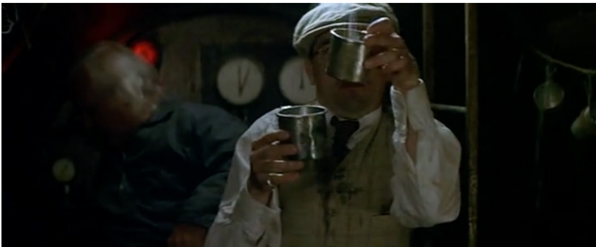
Le Parfum de la dame en noir , Bruno Podalydès, 2005

Ce que l'on pourrait appeler une aura magnétique du personnage, ou plus prudemment un mystérieux pouvoir d'attraction, va jusqu'à diviser l'image en zones clairement distinctes. Dans Le Parfum de la dame en noir (Bruno Podalydès, 2005),