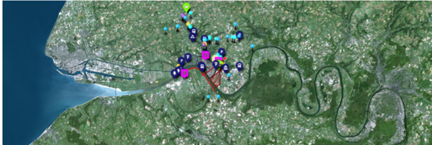
Cartographeur Port-Jérôme-sur-Seine, Misia Forlen, Extrait du journal de bord en ligne réalisé avec Umap.

travailleurs-habitants mobiles sur le territoire : vulnérabilité, adaptabilité, sens du commun, type de ressources, agencement, renoncement, limite, temporalité. Entre le carnet de repérage et le journal de recherche, cette carte augmentée permet de spatialiser les observations, réflexions, hypothèses, tout comme les images et les sons, issus du travail hybride de recherche et de création en cours, propre au doctorat RADIAN. La puissance visuelle de la carte permet de mettre en relation de manière immédiate le territoire avec le travail de recherche théorique et de création filmique.