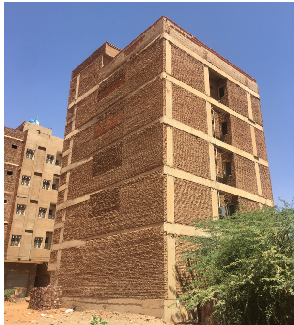
Fig.4. Une tour résidentielle à Kafouri. © Auteur, 17 avril 2021.