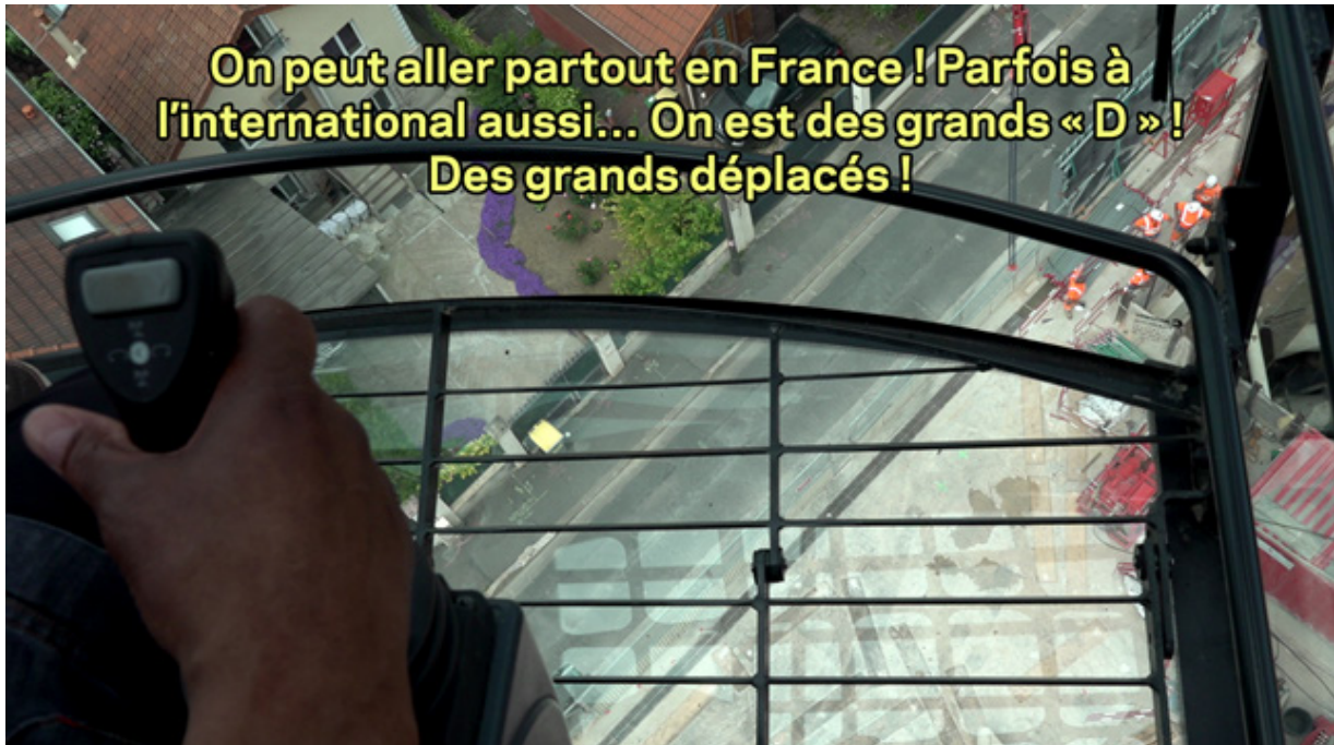
Grand chantier, Misia Forlen, Image extraite du film documentaire « Grand chantier », réalisation : Misia Forlen, montage : Jérôme Buu-Sao, production : ateliers varan, 2021.

ajoutée à la stricte valeur travail ? En quoi cela venait-il brouiller et complexifier les frontières entre ce qui relève de l'habitat d'une part, et du travail d'autre part ? De plus, des recours abusifs à ses indemnités de déplacement comme pratique d'embauche avaient également été rapportés par des cadres d'entreprises du bâtiment : « Il y a une quinzaine d'années, on embauchait carrément les gens en leur disant : Mettez-vous une adresse ailleurs et on vous donne les grands déplacements ! Comme ça, on vous embauche pour pas trop cher, et par contre, vous, vous avez un très bon salaire ! »