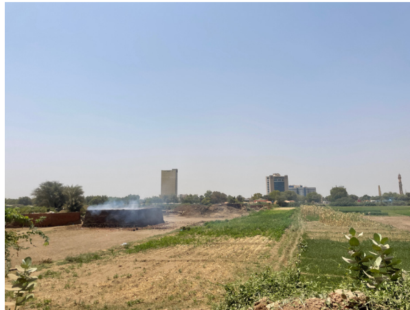
Fig.10. Une briqueterie émettant de la fumée sur l’île de Tuti, au centre de Khartoum. © Auteur, 9 avril 2022.

La brique rouge est perçue par ces acteurs comme archaïque, traditionnelle et non adaptée à la construction contemporaine à Khartoum. Le moule standardisé de ses deux concurrents est en revanche associé à l’imaginaire de l’industrialisation, de la modernisation et du progrès. Les considérations techniques et économiques sur les dimensions des matériaux correspondent à des représentations en termes de degré de modernité et de qualité. Elles se construisent par opposition à l’informalité de la production des briques rouges, également associée à des dommages environnementaux et sanitaires importants (émission de fumées nocives, consommation abusive de terres fertiles sur les berges du Nil...) (Fig.10).