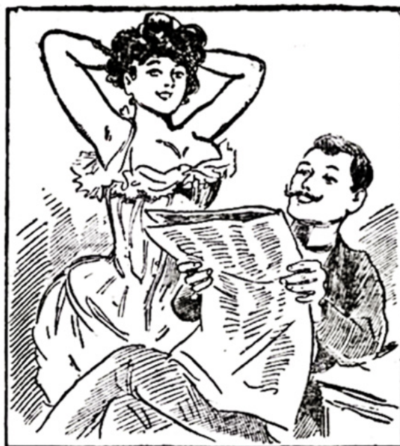
— L'union des femmes peintres et sculpteurs, qu'est-ce que c'est que ça ? Ce sont des femmes artistes qui se réunissent pour en faire voir de toutes les couleurs aux hommes.