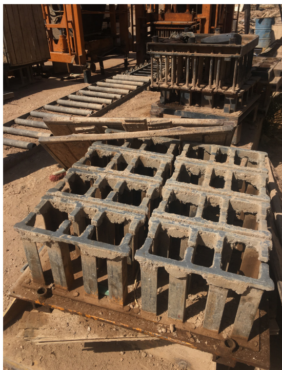
Fig.7. La production semi-industrialisée du parpaing de ciment. © Auteur, 5 avril 2021, Soba Sharg.

Face à ce matériau artisanal, deux concurrents aux fonctions équivalentes se sont développés dans un contexte d'explosion du secteur de la construction. Le parpaing de ciment est un matériau ancien à Khartoum, mais sa production s'y est intensifiée depuis le début des années 2000. Cela est dû à l'importation de chaînes de montage depuis la Turquie, ce qui a permis à de nombreux petits producteurs de s'installer, notamment dans les périphéries de la capitale (Fig.6). Les parpaings ne sont pas toujours contrôlés et testés, mais leur méthode de fabrication, par compression et sans cuisson, impose un moule unique et standardisé (Fig.7).