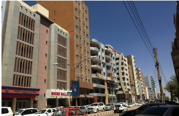
Fig.1. La rue 15, un héritage du boom de la construction dans les années 2000. © Auteur, 23 février 2020.

Dans un contexte de développement de la rente pétrolière à partir des années 2000 et de forte croissance démographique (Denis, 2006), Khartoum a connu un essor important dans le secteur de la construction jusque dans les années 2010. Cela s'est traduit à la fois par des politiques de modernisation menées par le gouvernement d'Omar el-Béchir, dont les traces sont encore visibles dans le centre de la capitale (Fig.1), mais aussi par une multiplication des briqueteries artisanales, ou kamā'in 1 , sur les berges du Nil (Fig.2). Celles-ci seraient en effet passées de 1700 unités en 1994 à 3450 en 2005, dont 2000 dans la seule agglomération de Khartoum (Alam, 2006). Ces ateliers produisent un des matériaux de construction les plus utilisés dans la capitale soudanaise, la brique rouge, que l'on retrouve aussi bien dans des maisons individuelles (Fig.3) que dans les nouvelles tours résidentielles (Fig.4).