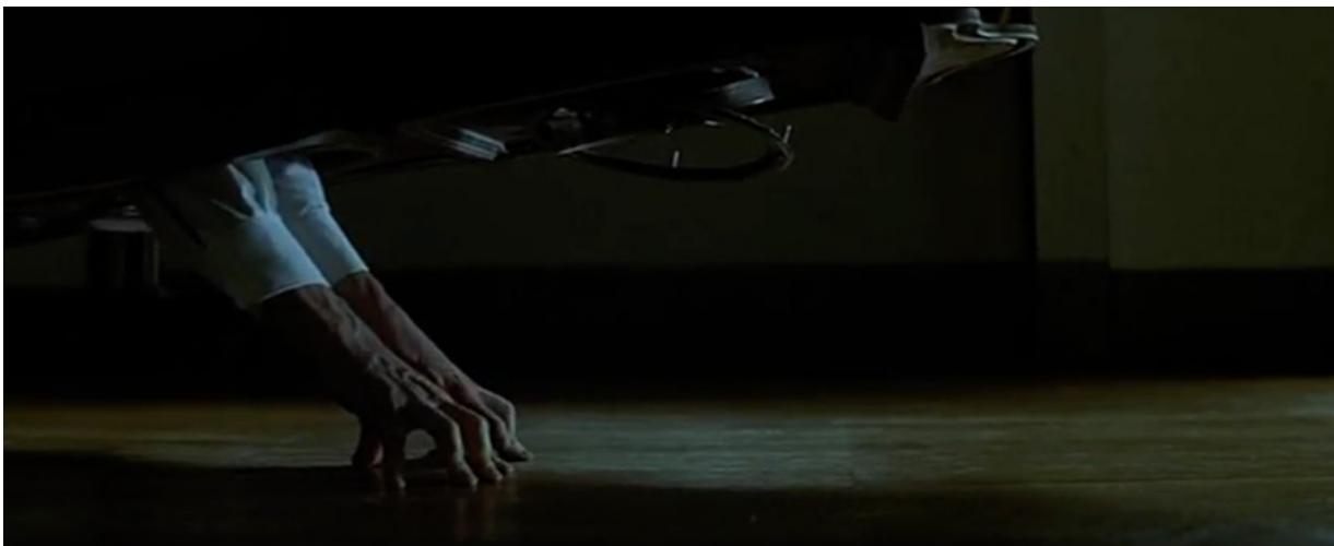
Le Mystère de la chambre jaune , Bruno Podalydès, 2003