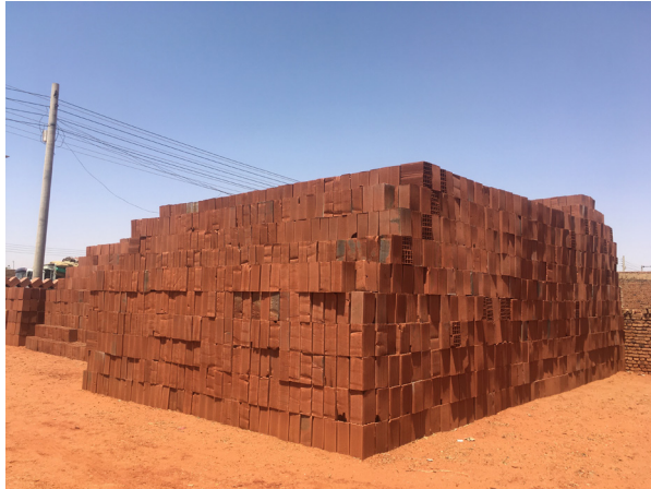
Fig.8. La brique harari, un matériau industriel et standardisé. © Auteur, 5 avril 2021, Soba Sharg.

La brique industrielle, aussi appelée « brique thermique » (طوب حراري), est, elle, issue de la même matière première que la brique rouge traditionnelle, le limon du Nil, mais sa production est industrialisée (Fig.8) et contrôlée par une petite dizaine d'entreprises, dont les usines se situent aux marges de Khartoum. On trouve différentes tailles de briques, mais leurs dimensions sont fixes (Fig.9). Ces matériaux répondent aux standards de l'Organisation des standards soudanais et de la métrologie 2 et font l'objets de tests réalisés par des instituts techniques, comme le Building and Road Research Institute (BRRI), qui dépend de l'Université de Khartoum.