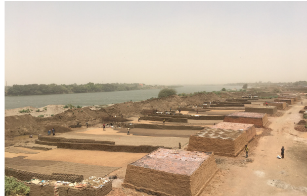
Fig.2. Des briqueteries sur les berges du Nil Bleu à Soba Sharg. © Auteur, 10 avril 2021.

Malgré l'augmentation du nombre de ces ateliers, divers acteurs, locaux et internationaux (Pantuliano et al., 2011), privés et publics, se retrouvent désormais sur une remise en cause de cette activité. Parmi les arguments mobilisés, les différentes formes de pollution causées par les briqueteries reviennent régulièrement (Abdalla,