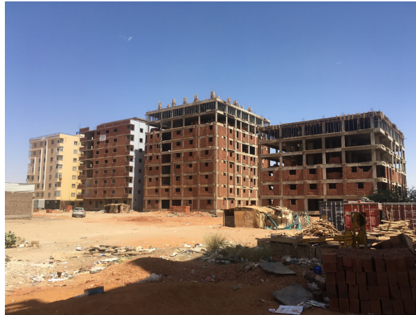
Fig.11. Les nouvelles constructions dans le quartier de Kafouri : structure en béton et remplissage en brique industrielle.

Cette verticalisation du bâti, par le développement des structures en béton armé, est surtout visible dans certains quartiers aisés de Khartoum (Kafouri, Riyadh...). La brique industrielle, promue pour sa légèreté et ses grandes dimensions, semble ainsi privilégiée par les architectes. Elle permet de réduire le poids porté par la structure et ainsi faire des économies de ciment et de fer à béton, deux matériaux très coûteux au Soudan. D'un point de vue très matériel et technique donc, la brique rouge est considérée comme inadaptée aux évolutions contemporaines de la construction à Khartoum.