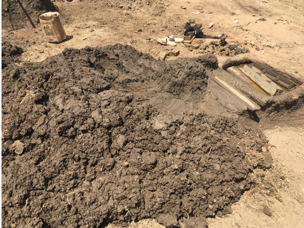
Fig.5. De la matière première au moule. © Auteur, 5 mars 2020, Al Gereif Sharg.

La brique rouge est produite à Khartoum dans des ateliers artisanaux, principalement sur les berges du Nil Bleu. Hormis l'extraction du limon du Nil qui est faite à la pelleteuse, toutes les étapes de fabrication sont manuelles : mélange de l'argile avec de l'eau et de la matière organique, moulage par des équipes d'ouvriers dans des moules en fer et en bois (Fig.5), séchage pendant plusieurs jours à l'air libre, cuisson dans un four et chargement dans un camion de livraison. La brique ainsi produite a des dimensions variables selon les producteurs, mais sa taille moyenne est de 21x11,5x5,5 cm.