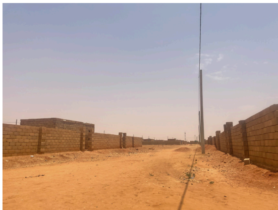
Fig.12. Des logements populaires tout en parpaings de ciment à Wadi Al Akhdar. © Auteur, 14 avril 2022.

Une série d'entretiens avec le directeur du département « Conception » (تصميم) de cette institution a révélé une transition dans les matériaux utilisés pour ces constructions : « D'abord, on utilisait des matériaux locaux, comme de la terre crue, de la brique crue et de la matière organique, comme à Andalus 17 par exemple. Puis, le Fonds s'est développé et on est passé à la brique rouge, avec Andalus 20, qui a été construit en brique rouge en 2004. Depuis 2007 et les projets de al-Tilal et Wadi al-Akhdar, on utilise le parpaing de ciment. » (entretien, avril 2022, souligné par l'auteur). Le passage d'un matériau à l'autre est ici directement associé à un développement économique du Fonds. L'utilisation du parpaing de ciment pour les logements « populaires », un matériau dont la production est semi-industrialisée et dont le moule est fixe, est considérée par ce fonctionnaire comme un progrès technologique. Comme on peut le voir sur la