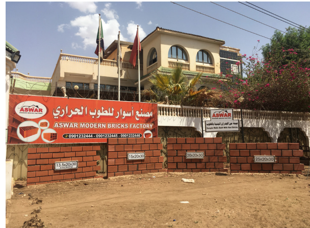
Fig.9. Des dimensions fixes. © Auteur, 27 avril 2021, Al Taif.

La brique rouge traditionnelle est d'abord critiquée pour ses petites dimensions. Selon un chef de chantier rencontré à Burri, un quartier central de Khartoum, il faut entre 150 et 300 briques rouges pour construire un mur d'1 m 2 , contre seulement 10 parpaings de ciment ou briques industrielles. Cela représente une économie de prix et de poids, mais aussi de mortier pour faire les joints entre les unités (entretien, avril 2021). Ce discours est confirmé par un ingénieur du BRRI, pour qui la taille réduite de la brique rouge la rend plus coûteuse et fragilise la construction : « Sur le marché local, les dimensions sont de 10x18x5 cm. C'est beaucoup plus petit, ce qui fait que tu prends plus de mortier et que la brique est plus faible... » (entretien, février 2021).