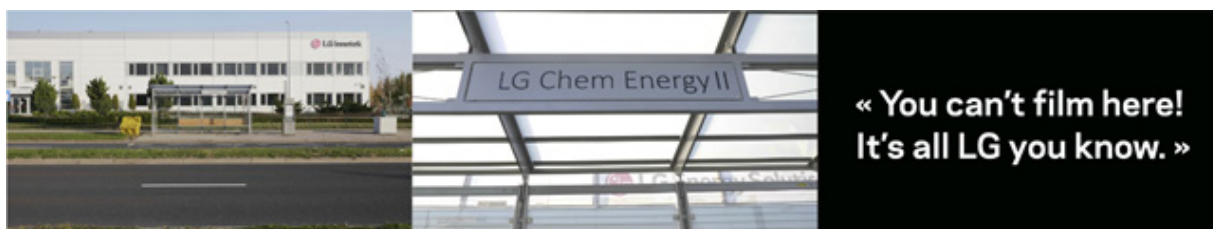
La zone LG, Misia Forlen, Images tournées dans la ZES de Wrocław-Kobierzyce, dans le sud-ouest de la Pologne, autour d'arrêts de bus qui portent le nom des différentes usines de l'entreprise coréenne LG.

C'est ce même film, « Strajk Matek », qui a guidé une enquête de terrain menée en novembre 2021 dans des ZES polonaises. Comme une carte, ce film a orienté les travaux de terrain sur place vers des sites industriels où avaient été tournées certaines scènes du film. Pendant la captation d'images de repérage dans la ZES de Biskupice Podgorne, au sud de Wrocław, autour d'arrêts de bus dont les stations portent toutes le nom de « LG », un membre du personnel de sécurité d'une des usines vient s'interposer devant la caméra : « You cant film here ! It's all LG you know. » L'entrée de l'usine ne se situe pas à la porte du bâtiment, c'est toute la zone qui devient en fait l'entreprise, une entreprise à l'échelle d'un territoire, ou du moins d'un quartier. La frontière n'est pas matérielle, visible, mais, pourtant bien réelle. Une fois encore, l'impossibilité de tourner dans ces zones vient confirmer cette hypothèse selon laquelle le sujet traité doit être analysé à travers les possibles de sa représentation.