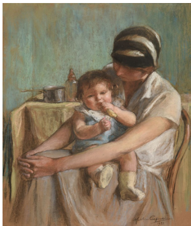
IMG_3 Madeleine Carpentier, Mère et son bébé , pastel sec et fusain sur papier vélin, 80.8 x 64,5, Reims, Musée des Beaux-Arts © Musées de Reims.