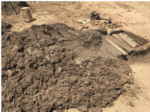
Fig.5. De la matière première au moule. © Auteur, 5 mars 2020, Al Gereif Sharg.

La brique rouge est produite à Khartoum dans des ateliers artisanaux, principalement sur les berges du Nil Bleu. Hormis l'extraction du limon du Nil qui est faite à la pelleteuse, toutes les étapes de fabrication sont manuelles : mélange de l'argile avec de l'eau et de la matière organique, moulage par des équipes d'ouvriers dans des moules en fer et en bois (Fig.5), séchage pendant plusieurs jours à l'air libre, cuisson dans un four et chargement dans un camion de livraison. La brique ainsi produite a des dimensions variables selon les producteurs, mais sa taille moyenne est de 21x11,5x5,5 cm.