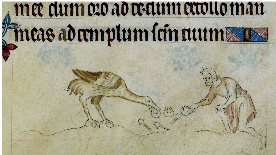
FIG. 5. — Homme nourrissant une autruche avec des clous et des fers à cheval. Psautier, dit «Queen Mary Psalter», 1310-1320. London, British Library, Ms Royal II B VII, f. 113v.