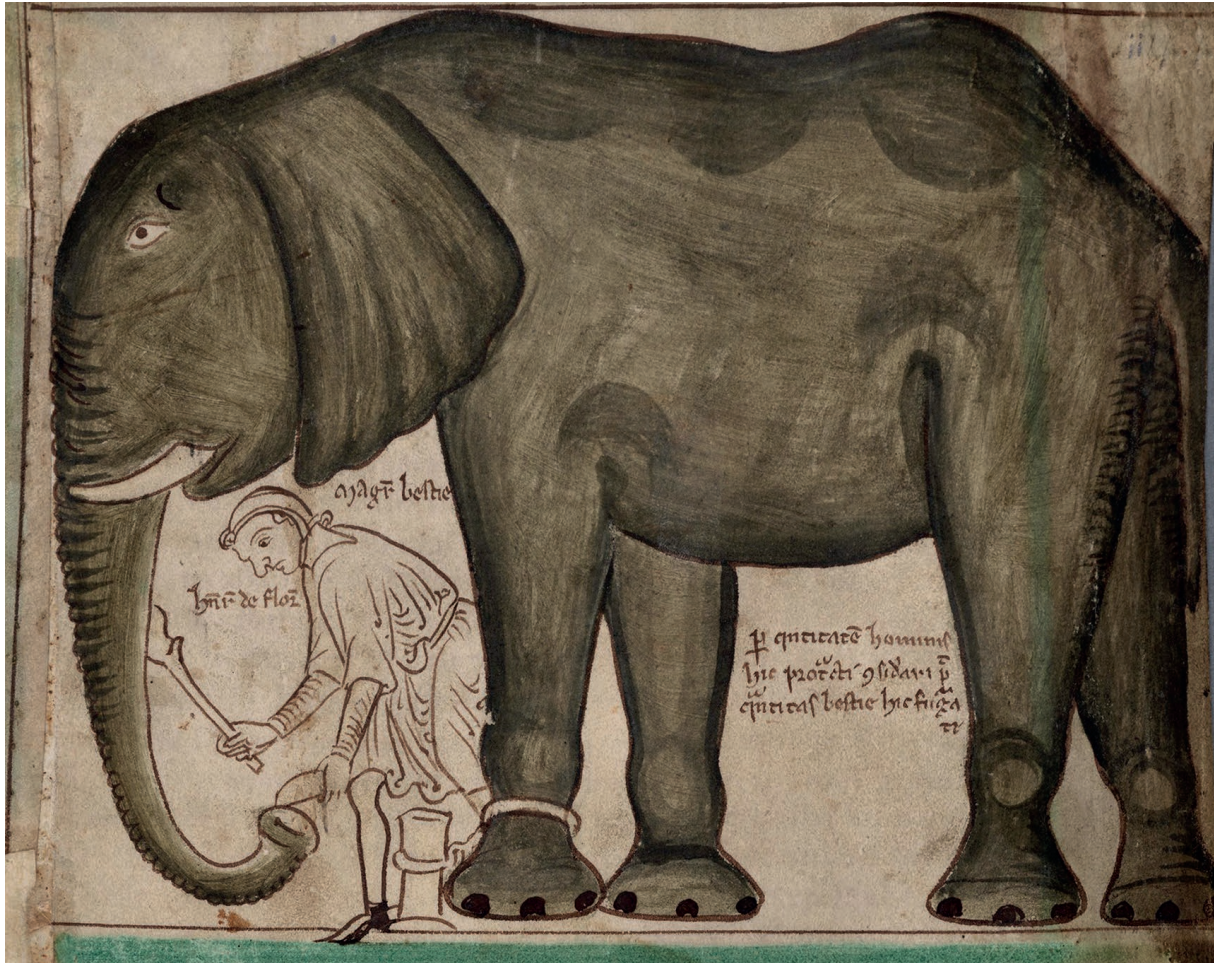
FIG. 1. — L'éléphant du roi Henri III et son gardien. Mathieu Paris, Cronica maiora , 2 e moitié du XIII e siècle. Cambridge, Corpus Christi College, Parker Library, CCC Ms 16, f. iir.