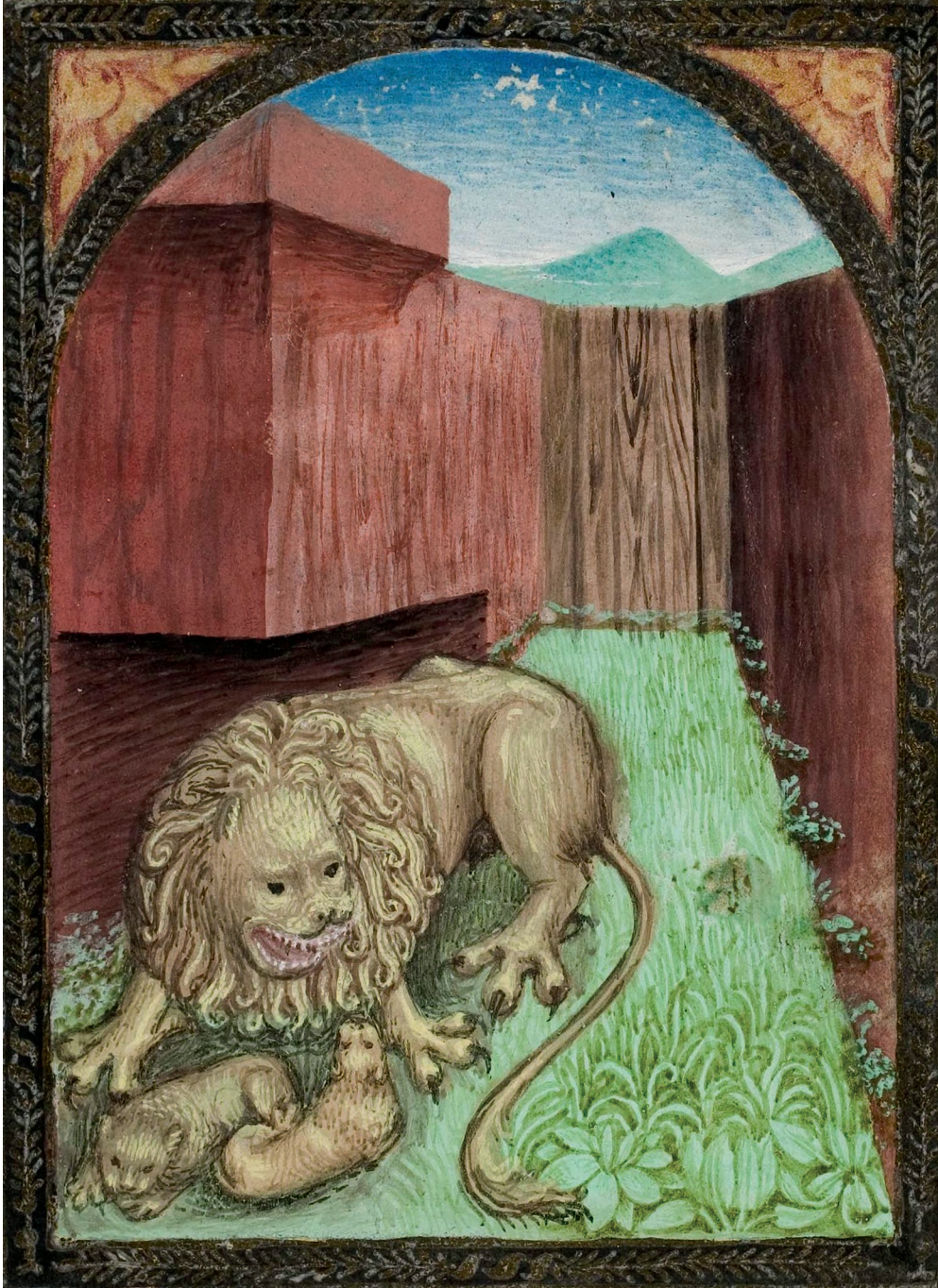
FIG. 3. — Lion captif ressuscitant ses petits par son souffle. Franz von Retz, Defensorium inviolatae virginitatis Mariae , Cologne, c. 1490? Dublin, Irish National Library, ms. 32,513, f. 31r.

Stadler 1916-1920: 229). Toutefois, dans aucun passage, AM ne signale son expérience propre ou ses observations d'après nature à ce sujet; il ne se réfère qu'à Aristote pour se démarquer des autres auteurs médiévaux.