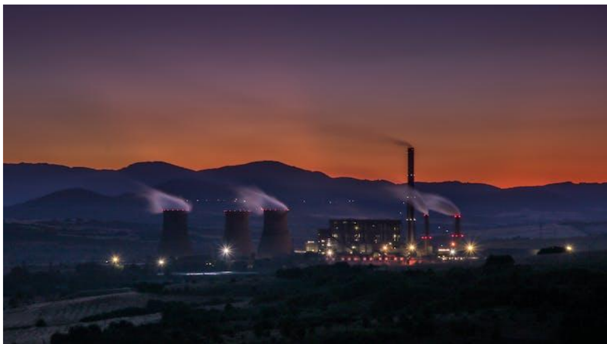
L'usine géothermique de Golemo Selo, en Bulgarie.

La géothermie consiste à capter la chaleur terrestre pour l'exploiter directement. Elle peut ainsi fournir de la chaleur à différentes échelles, des habitations individuelles jusqu'aux réseaux de chaleur d'une agglomération, en passant par l'industrie agroalimentaire. Lorsque la température et le débit sont suffisants, la chaleur peut également être convertie en énergie électrique et injectée sur le réseau national.