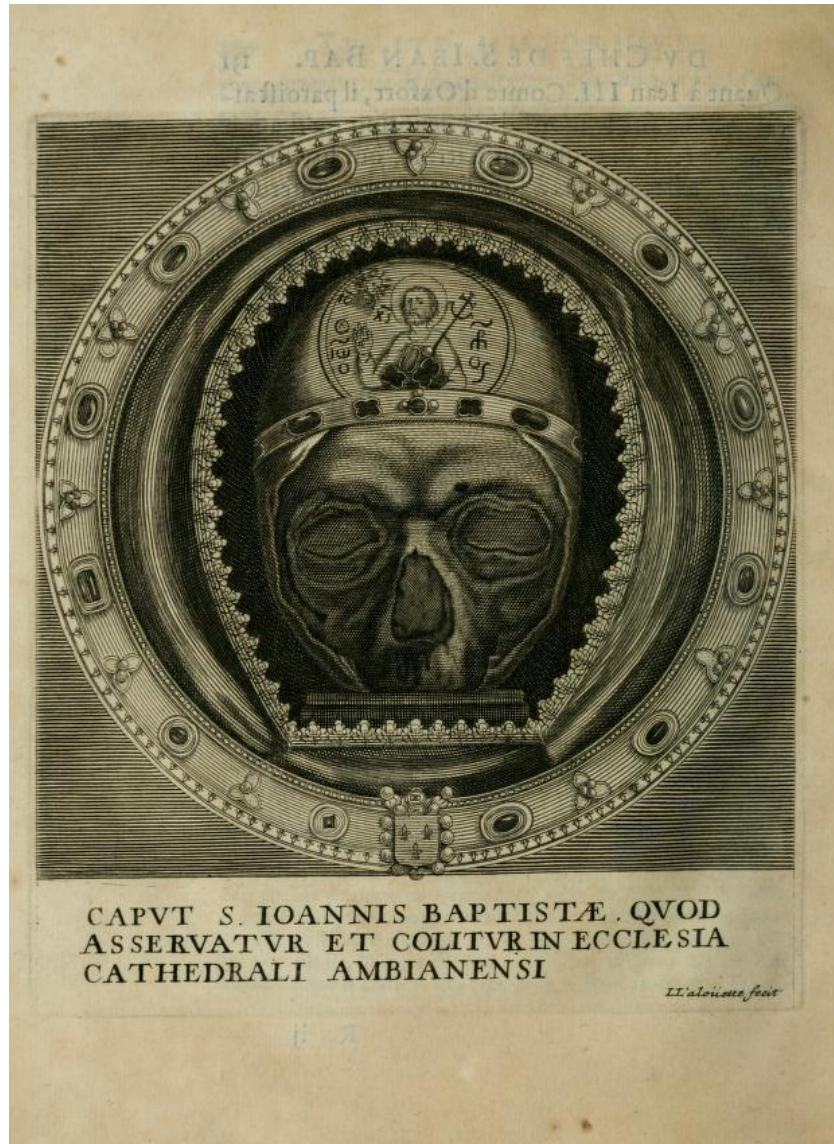
Fig. 2. Charles du Fresne du Cange, Traité historique du chef de S. Jean Baptiste, contenant une discussion exacte de ce que les auteurs anciens et modernes en ont écrit, et particulièrement de ses trois inventions... , Paris, chez S. Cramoisy et S. Mabre-Cramoisy, 1665, p. 132, © Gallica.

L'examen des diverses facettes des activités intellectuelles de Du Cange durant sa période amiénoise convainc de sa propension à accumuler les données tirées des autorités, à collecter des matériaux hétéroclites durant une période où les principes de véracité et de fiabilité des sources n'ont pas encore été fixés, puisque le De Re Diplomatica libri de Mabillon est publié plus tard, en 1681. L'image qui se dessine montre un esprit tourné vers l'érudition savante plus que vers une capacité de synthèse philologique ou historique, sans comprendre pourquoi Du Cange laisse de côté l'héraldique, domaine où il paraissait capable d'élaborer des traités structurants. Cependant, par-delà les interrogations sur les mobiles poussant Du Cange à amasser des connaissances aussi disparates, le savant amiénois mérite d'être considéré comme un magnifique exemple d'érudition laïque au XVII e siècle.