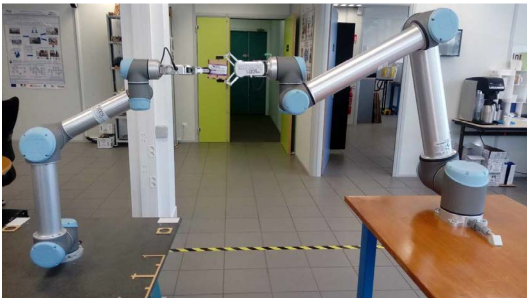
Figure 4 : Interopérabilité entre UR5 et UR10

Notre application consiste que UR10 ramasse une boîte de la table et se déplace jusqu'au point de rencontre avec UR5, puis il envoie une demande Current à l'agent MTConnect de UR5 pour voir son état, dans l'autre coté le robot UR5 se déplace aussi jusqu'au point de rencontre où il fait aussi un demande Current à l'agent MTConnect de UR10 pour voir si ce dernier est dans la bonne position, si ce condition est vrais, UR5 s'avance pour prendre la boîte et UR10 peut savoir que UR5 est arrivé et va prendre la boîte. Par cette méthode et le changement les états des pinces et les positions entre les deux robots, ils peuvent changer la boîtes de UR10 à UR5, ensuite UR5 va mettre la boîte dans sa place et UR10 va ramasser une autre boîte, ici cet opération va répéter plusieurs fois. La figure 4 montre les deux robots à l'instant de l'échange de la boîte.