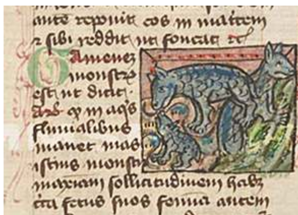
Fig. 19. Thomas de Cantimpré, Liber de natura rerum , 7, 74, Gamenez, Ms. Praha, Národní knihovna České republiky, X.A.4, f. 122r.