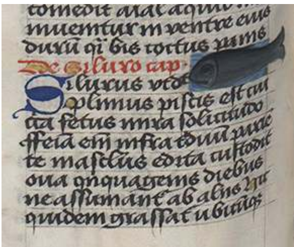
Fig. 18. Thomas de Cantimpré, Liber de natura rerum , 7, 74, Silurus , Ms. Kraków, Biblioteka Jagiellońska, 794, f. 165v.