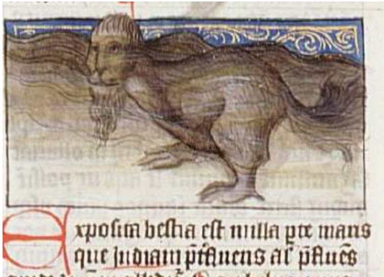
Fig. 1. Thomas de Cantimpré, Liber de natura rerum, De vibus nobilibus, Tacuinum sanitatis , 6, 21, Ms. Granada, Biblioteca Universitaria y Provincial, C-67, f. 57v.

tranchent fortement avec ce qu'on peut voir dans les chapitres consacrés aux autres animaux : les quadrupèdes sont dessinés avec précision et parfois dans un magnifique décor avec des personnages, comme le camelopardis / camelopardus / camelopardalis , et les oiseaux sont plus beaux encore ; si tous ne sont pas dessinés de manière réaliste, loin de là, certains sont cependant ressemblants et les représentations sont variées et chatoyantes.