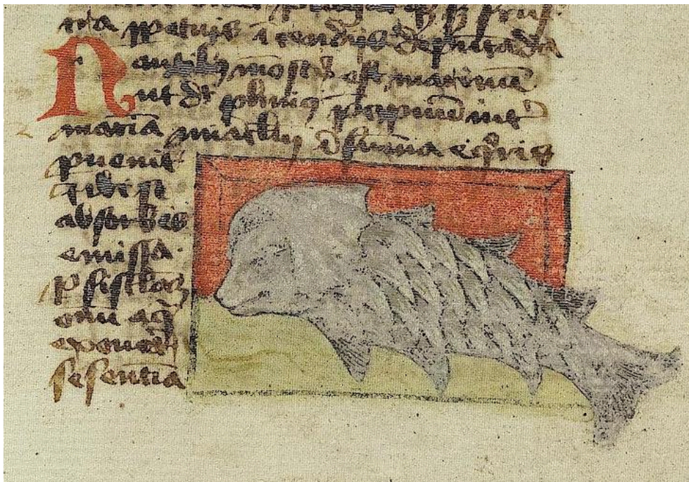
Fig. 11. Thomas de Cantimpré, Liber de natura rerum , 6, 37, Nautilus , Ms. Città del Vaticano, Biblioteca Apostolica Vaticana, Pal. lat. 1066, f. 112r.