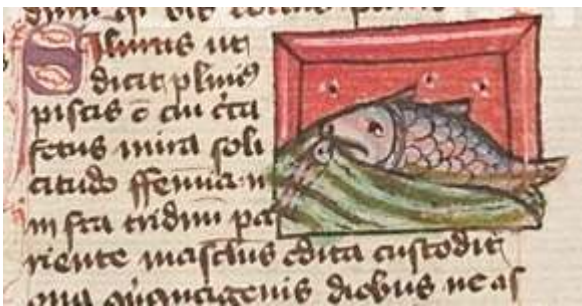
Fig. 17. Thomas de Cantimpré, Liber de natura rerum , 7, 74, Silurus , Ms. Praha, Národní knihovna České republiky, Česko, X.A.4, f. 139r.