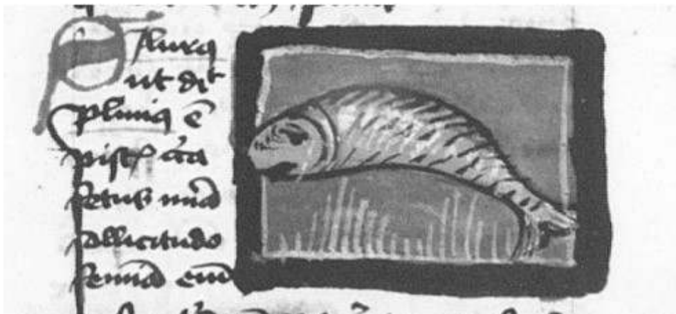
Fig. 15. Thomas de Cantimpré, Liber de natura rerum , 7, 74, Silurus , Ms. Würzburg, Universitätsbibliothek, M.ch.f.150, f. 163r.