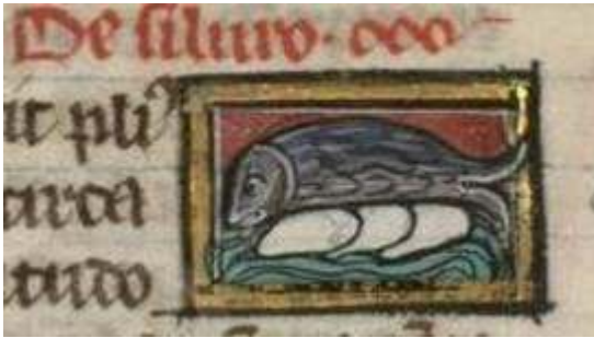
Fig. 12. Thomas de Cantimpré, Liber de natura rerum , 7, 74, Silurus , Ms. Valenciennes, Médiathèque S. Veil, 320, f. 131r.

Pal. lat. 1066 se placent dans la lignée des bestiaires et représentent, sur le dos de l'animal, les marins qui l'ont confondu avec une île et le feu qu'ils y ont allumé, ce qui constitue le détail le plus marquant de la description. Il en va de même pour le silure : alors que la plupart des manuscrits représentent un gros poisson neutre, Valenciennes et Praha 10 s'attachent à la précision la plus marquante du texte qui est l'attachement du mâle à ses œufs : Valenciennes représente un poisson couvant plusieurs œufs, tandis que Praha 10 représente le silure et son petit [fig. 12 à 18].