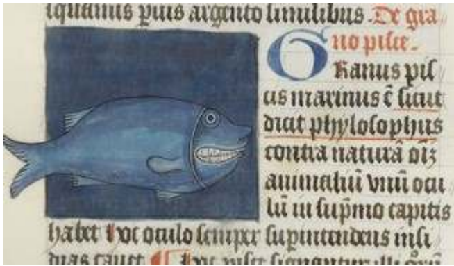
Fig. 3. Thomas de Cantimpré, Liber de natura rerum , 7, 40, Granus , Ms. Gent, Sint Baafskapittel, 15, f. 69r.

comportemental : le poulpe emporte dans ses bras le marin dont il va se repaître, la sirène porte dans son giron le petit qu'elle allaite, l' eracliodes creuse le sol à la recherche de cours d'eau souterrains, la fundula repose au fond de l'eau. Mais pour la très grande majorité, les illustrations, extrêmement soignées et contrastées, sur fond de couleurs vives, semblent viser avant tout un objectif esthétique et faire peu de cas du texte. Les interactions semblent rares, ce qui là encore limite les possibilités de représentation [Fig. 3 et 4].