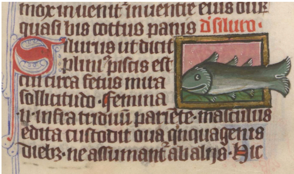
Fig. 13. Thomas de Cantimpré, Liber de natura rerum , 7, 74, Silurus , Ms. Wrocław, Biblioteka Uniwersytecka, Rehdig. 174, f. 136r.