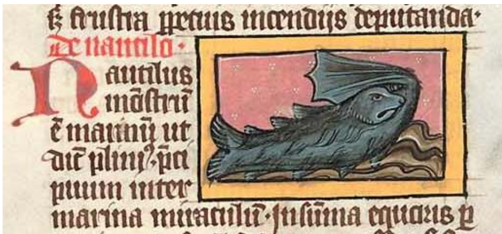
Fig. 8. Thomas de Cantimpré, Liber de natura rerum , 6, 37, Nautilus , Ms. Praha, Národní knihovna České republiky, XIV.A. 15, f. 88r.