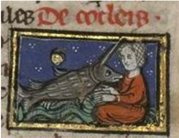
Fig. 20. Thomas de Cantimpré, Liber de natura rerum , 7, 27, Cochlea , Ms. Valenciennes, Médiathèque S. Veil, 320, f. 125r.