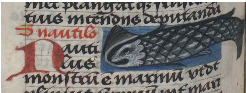
Fig. 9. Thomas de Cantimpré, Liber de natura rerum , 6, 37, Nautilus , Ms. Kraków, Biblioteka Jagiellońska, 794, f. 147v.