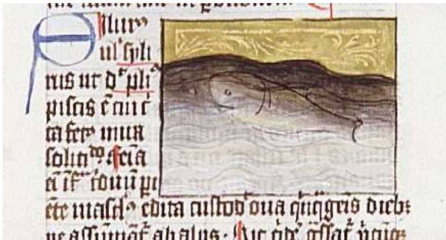
Fig. 2. Thomas de Cantimpré, Liber de natura rerum , 7, 74, Silurus , Ms. Granada, Biblioteca Universitaria y Provincial, C-67, f. 69r.