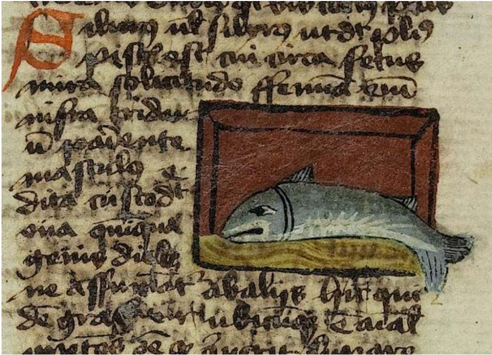
Fig. 16. Thomas de Cantimpré, Liber de natura rerum , 7, 74, Silurus , Ms. Città del Vaticano, Biblioteca Apostolica Vaticana, Pal. lat. 1066, f. 125v.