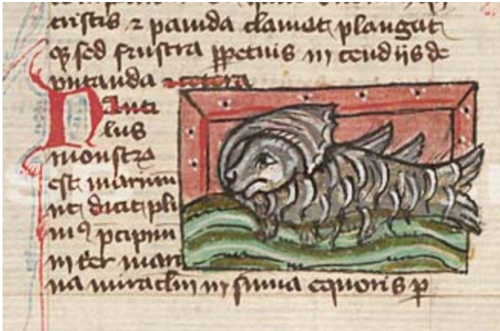
Fig. 7. Thomas de Cantimpré, Liber de natura rerum , 6, 37, Nautilus , Ms. Praha, Národní knihovna České republiky, X.A.4, f. 123v.