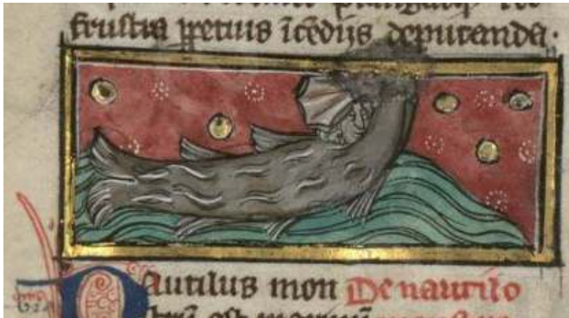
Fig. 5. Thomas de Cantimpré, Liber de natura rerum , 6, 37, Nautilus , Ms. Valenciennes, Médiathèque S. Veil, 320, f. 117v.