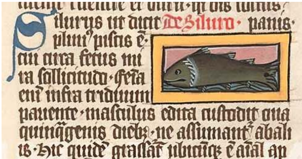
Fig. 14. Thomas de Cantimpré, Liber de natura rerum , 7, 74, Silurus , Ms. Praha, Národní knihovna České republiky, XIV.A. 15, f. 99r.