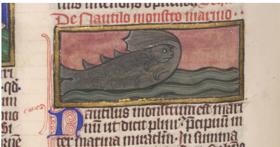
Fig. 6. Thomas de Cantimpré, Liber de natura rerum , 6, 37, Nautilus , Ms. Wrocław, Bibl. Uniw., Rehdig. 174, f. 121r.