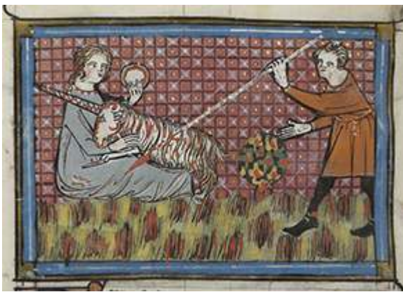
Fig. 21. Richard de Fournival, Bestiaire d'Amours , Ms. Paris, Bibliothèque nationale de France, Fr. 15213, f. 74v.