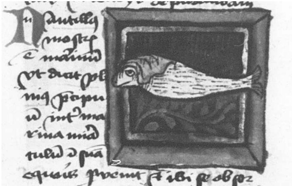
Fig. 10. Thomas de Cantimpré, Liber de natura rerum , 6, 37, Nautilus , Ms. Würzburg, Universitätsbibliothek, M.ch.f.150, f. 145r.