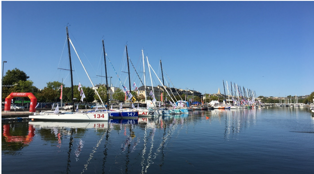
Figure 3 : Le bassin de plaisance occupé par la Normandy Channel Race .

populaires. La commande faite par la municipalité à une agence privée de développer pour les étudiants une course à pied « fun », la Colore Caen, s'inscrit dans cette optique. L'animation des commerces et la promotion touristique sont au cœur du repositionnement des Courants de la Liberté en centre-ville, offrant la perspective de mettre en scène le patrimoine architectural, de susciter la venue de visiteurs et de dépayser les habitants par l'ambiance urbaine éphémère ainsi créée. La Normandy Channel Race vise quant à elle à offrir des débouchés aux entreprises de la filière nautique.