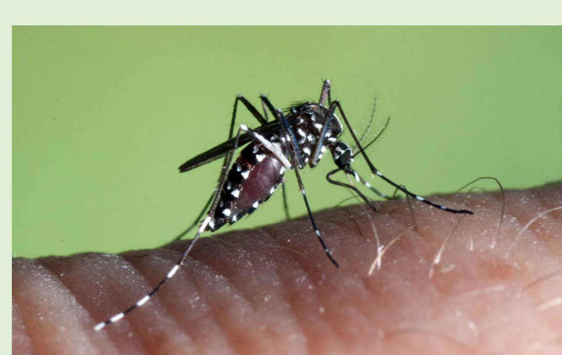
Figure 4. Aedes albopictus : communément appelé « moustique tigre »