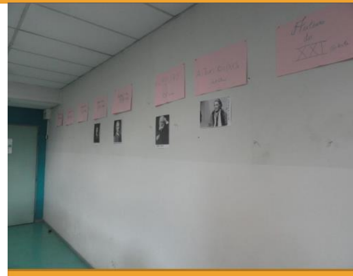
6eme E, français (mur du fond), décembre 2012