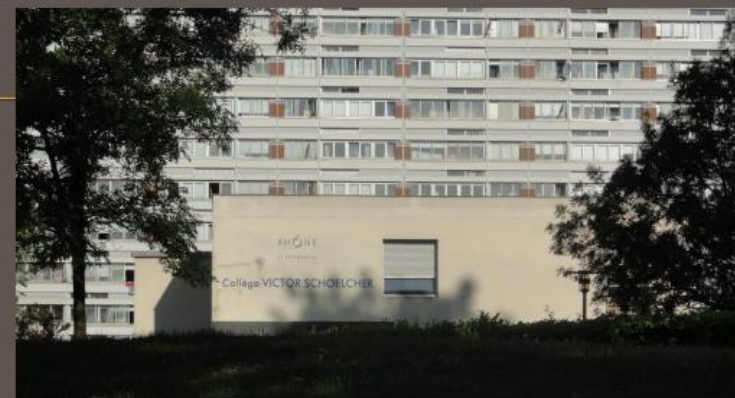
Le collège V. Schoelcher, juin 2012. A.-L. Le Guern