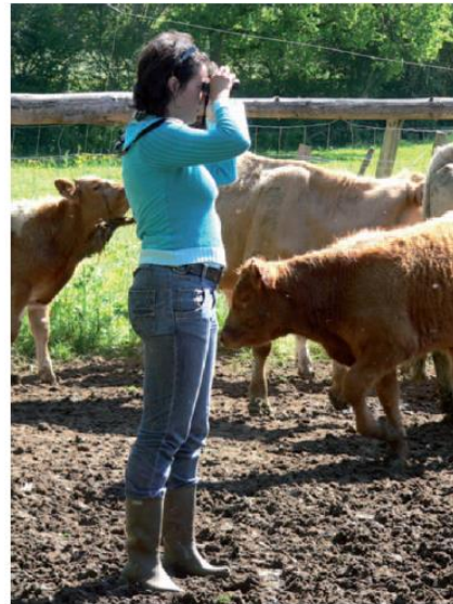
Un agent contrôleur « relève physiquement » les boucles des bovins à l'aide de jumelles, Côte-d'Or, 2006.

Si l'on se rapporte à la scène qu'on a retenue, les protagonistes vont échanger, plus de trois heures durant, autour des papiers. On y trouve, autour d'une large table centrale, outre les deux auteurs de ce texte, une éleveuse et deux contrôleuses de la DDAF. À ce stade de leur visite – c'est ici la deuxième journée –, ces dernières ont vu la totalité du cheptel sur l'ensemble des pâtures et dans la stabulation qui jouxte la ferme, soit près de cent cinquante bêtes au total. Les agents de l'administration ont donc désormais une certaine connaissance de l'exploitation. Quant à l'éleveuse, bien que son nom n'apparaisse jamais sur les documents officiels – seuls figurent celui de son mari et celui d'un de ses fils –, c'est elle qui « s'occupe des papiers ». C'est donc elle qui a passé la journée d'hier et la présente en compagnie des contrôleuses et des sociologues, répondant à leurs questions, les guidant sur ses parcelles à bord de son pick-up, arpétant les chemins broussailleux pour leur montrer ses vaches, et,