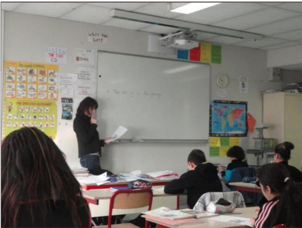
6eme E, cours d'anglais, décembre 2012