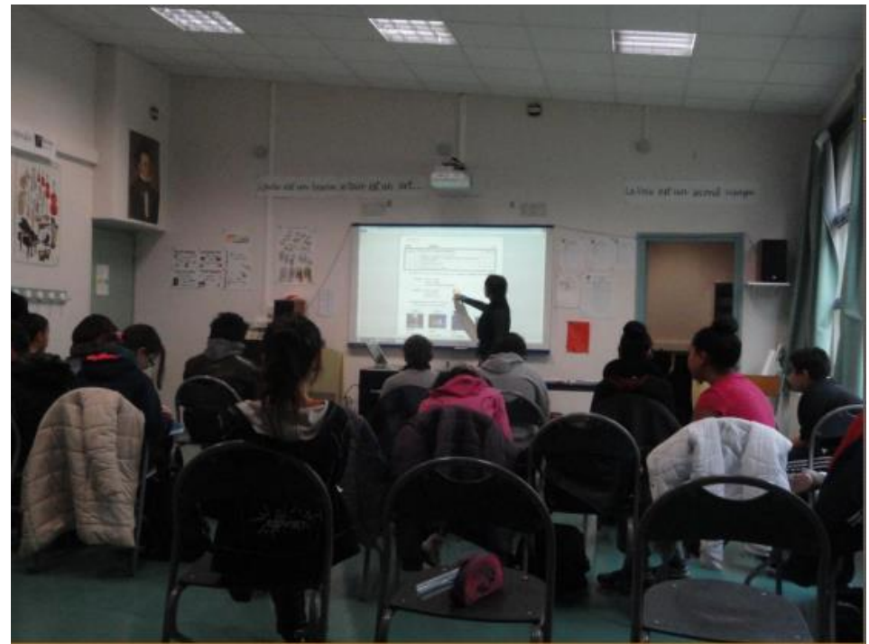
6eme E, cours d'éducation musicale, décembre 2012