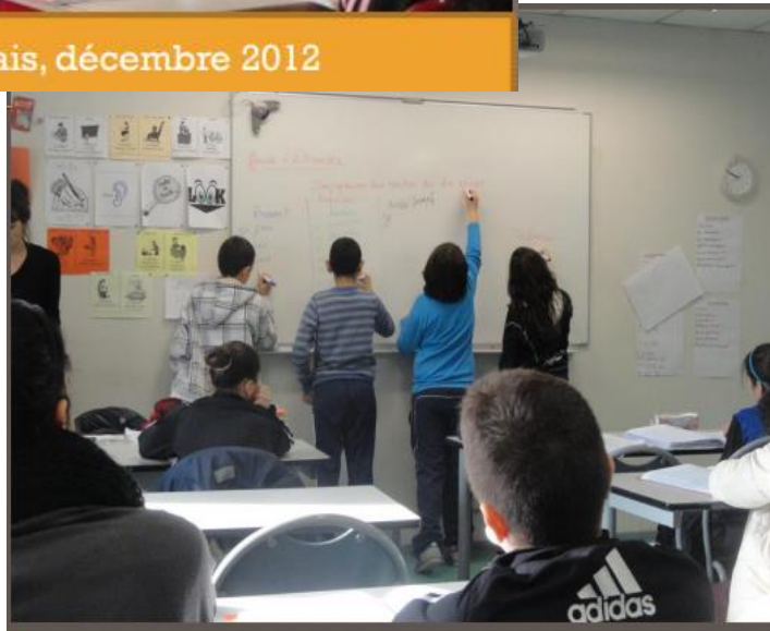
6eme E, cours de français, décembre 2012