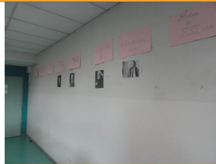
6eme E, français (mur du fond), décembre 2012