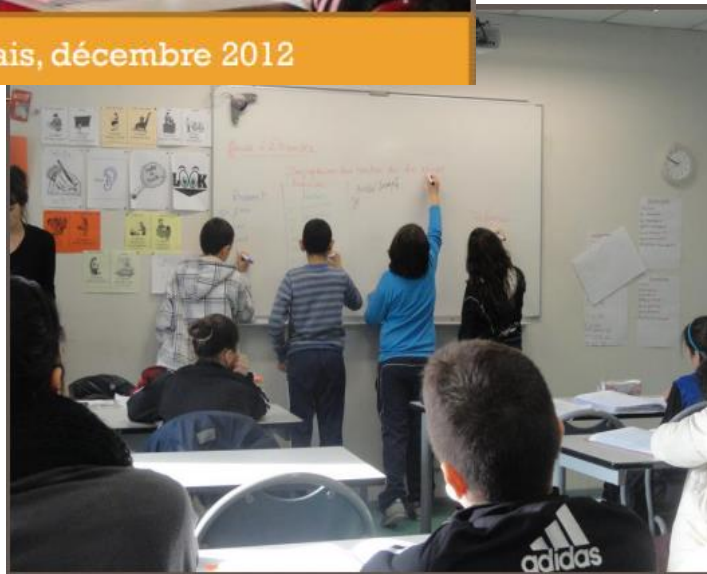
6eme E, cours de français, décembre 2012