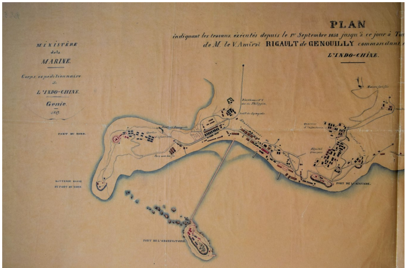
Plan de la base militaire de Tourane, sur la presqu'île de Tiên-Tcha, lors de l'occupation de Tourane par le corps expéditionnaire franco-espagnol (Campagne de Cochinchine, 1859). SHD, GR 1 VN 270.