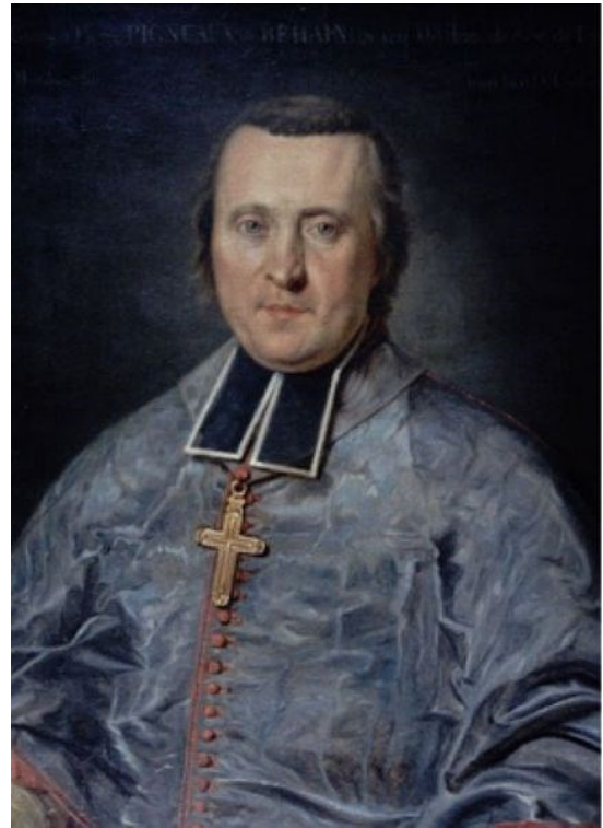
Portrait de Pierre Pigneau de Béhaine (1741-1799), peinture à l'huile, 1787, Collection des Missions Etrangères de Paris.