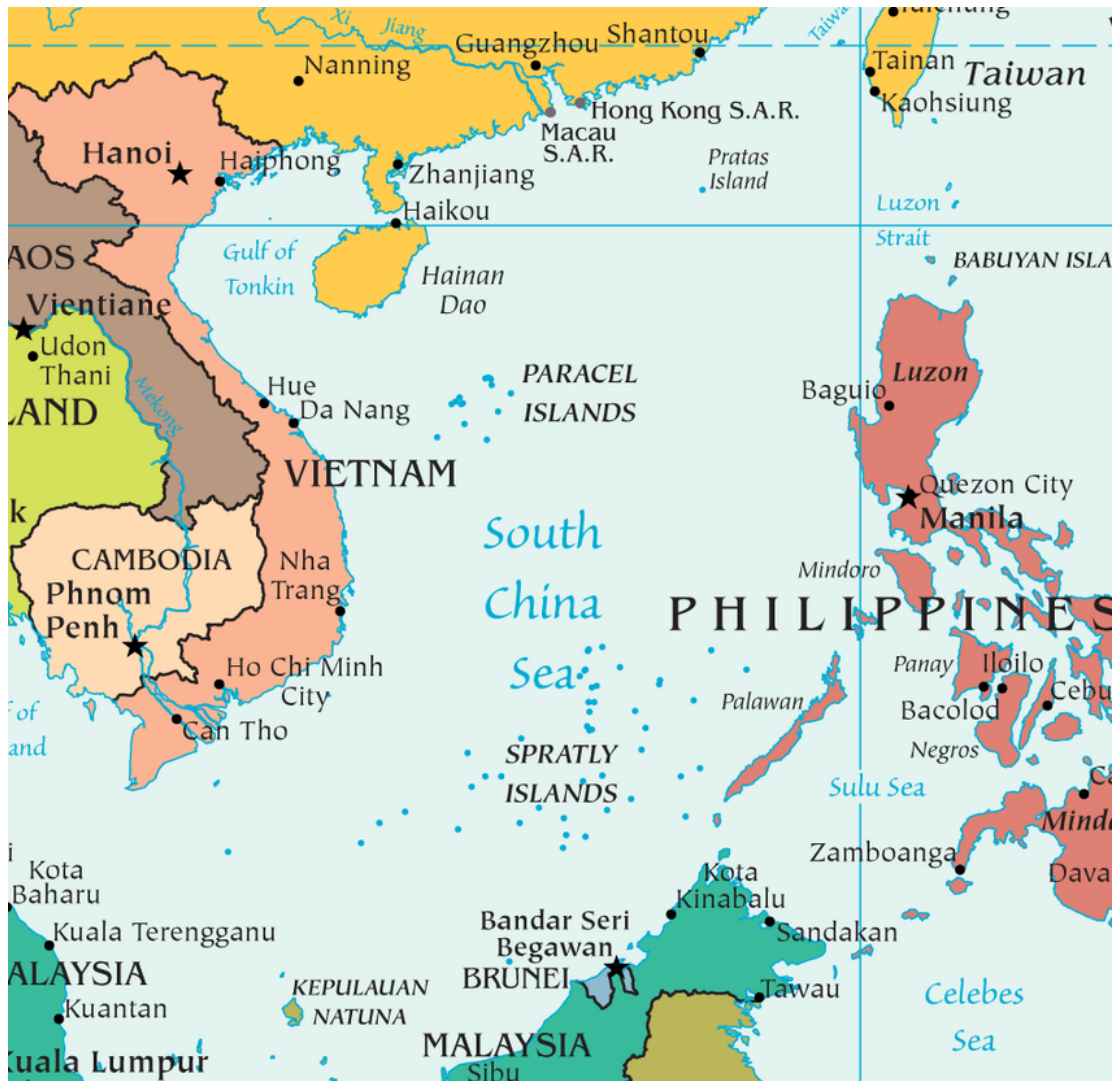
Carte contemporaine de la Mer de Chine méridionale (mer de l'Est), Texas Perry-Castañeda Library Map Collection : http://www.lib.utexas.edu/maps/asia.html