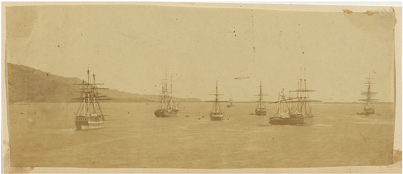
Les bâtiments de l'expédition de Cochinchine dans la baie de Tourane, mars-avril 1859, Australia National Gallery .