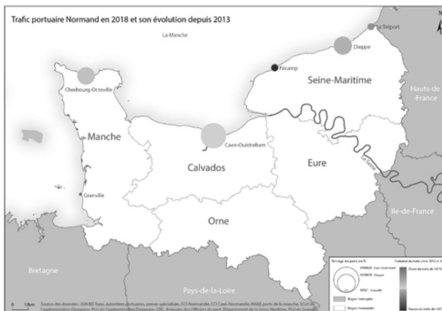
Figure 1 : Evolution du trafic portuaire normand de 2013 à 2018

Réalisation/conception : Jules Garraud & Ronan Kerbiriou