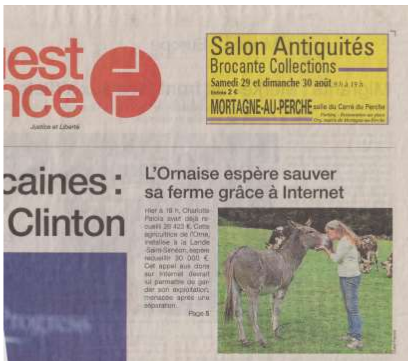
Document 1 : Extrait de la une de l'édition ornaise de Ouest-France du 27 août 2015

Voici la une à l'origine de la première étude de cas [doc. 1]. Par les sources mobilisées, l'histoire de cette agricultrice divorcée commence le 27 août 2015, alors qu'elle se trouve dans une situation financière difficile. L'article de cette édition nous apprend que suite au divorce entre l'agricultrice et son mari associé, l'exploitation agricole est en redressement judiciaire, avec obligation de rassembler 30 000 euros pour sauver le cheptel et 50 000 euros pour relancer l'activité. Ami·e·s et confrères/sœurs lui suggèrent de solliciter du financement participatif via le site dédié KissKissBankBank . Le 26 août 2015, à 18 h 00, 26 423 euros 7 sont collectés. L'opération réussit partiellement dans un premier temps puisque 36 238 euros sont récoltés le 28 août 2015 8 , et finalement 48 840 € le 1 er septembre 2015. S'ajoutent 6 000 euros reçus par voie postale. L'agricultrice dispose ainsi de 54 840 euros pour la sauvegarde du troupeau et la relance partielle de son activité agricole. Elle décrit ainsi à la journaliste les donateurs et donatrices : « Des personnes qui souhaitent [...] une agriculture plus paysanne, en équilibre avec la nature » 9 .