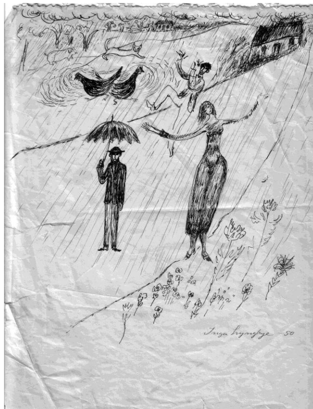
1950, dessin d'Inga Lyngbye, artiste danoise née en 1923, offert à Christian Dotremont. Les deux personnages masculins, celui qui danse encore plus que l'homme au parapluie, ressemblent beaucoup à Dotremont.

Les années de l'après-guerre sont caractérisées par d'incessants déplacements entre Bruxelles et Paris. Dotremont signe des textes et des tracts, fonde ou co-fonde des revues ( La Main à plume , Le Ciel bleu , Le Suractuel , Le Surréalisme révolutionnaire , Les Deux Sœurs... ) dans un univers intellectuel se situant dans les marges du surréalisme. En 1948, allié à des artistes hollandais et danois (Appel, Constant, Corneille, Jorn auxquels s'est joint le poète belge Noiret), Dotremont crée un nouveau mouvement qu'il baptise CoBrA. Son œuvre, sa vie intime également, s'inscrivent désormais à l'intérieur d'une géographie précise. Copenhague, Amsterdam, Bruxelles (dont CoBrA est l'anagramme) ainsi que, de manière provisoire, Paris ne forment qu'une seule ville dans laquelle Dotremont va et vient à un rythme qui stupéfie ses amis tant il semble être partout à la fois.