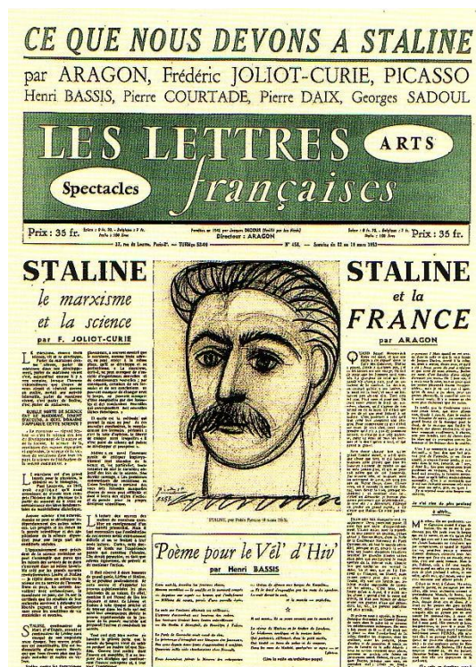
FIG.5 Portrait de Staline par Picasso, Les Lettres françaises , 12 mars 1953.