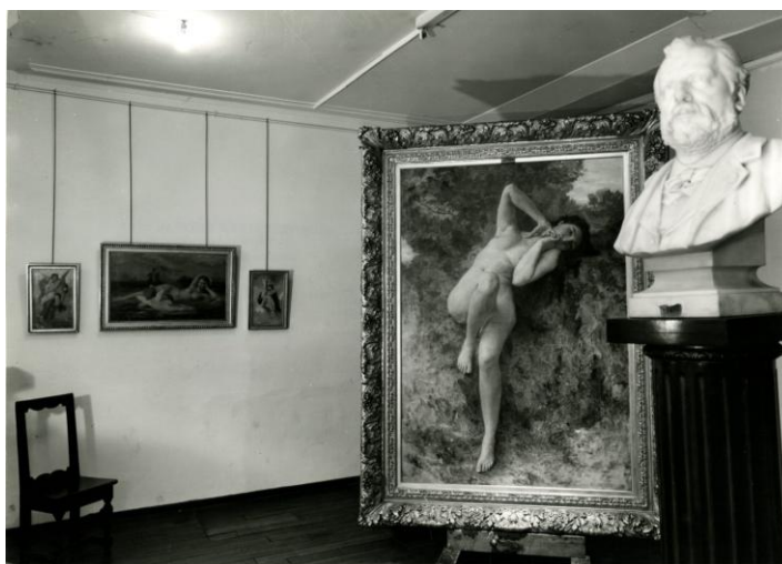
Exposition Bouguereau , 1965

Quelques semaines plus tard, après de nombreuses démarches auprès d'institutions, de musées et de particuliers 10 , mais toujours mue par le même désir – pointer du doigt le moment où surgit une forme d'académisme – Denise Breteau opte pour une démonstration anachronique en exposant des toiles et des esquisses de William Adolphe Bouguereau (1825-1905) du 22 décembre 1965 au 10 février 1966. Un buste trône sur une colonne au milieu d'une salle, entouré d'immenses toiles, dont les fameuses « Oréades » ; dans L'Express , Otto Hahn écrit : « ...ayant commencé son offensive en s'attaquant aux assembleurs d'objets et