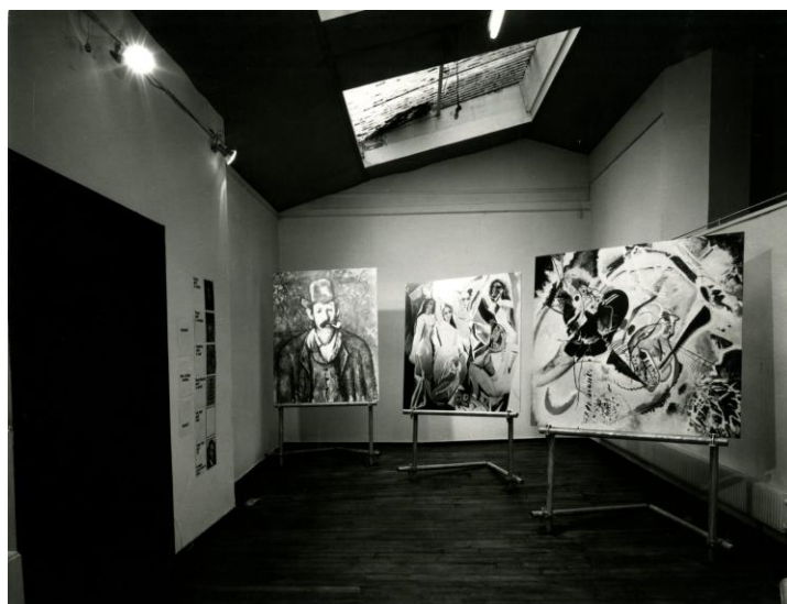
Exposition La mort d'Apollon et son testament, 1968

exemple, n'était que du pipi de grenouille, après avoir voulu ridiculiser Dada et le néo-réalisme en présentant des objets appropriés par Duchamp, César ou Klein, mais non signés (c'est-à-dire non élevés à la fonction d'œuvre d'art), elle montre aujourd'hui une exposition intitulée la mort d'Apollon et son testament à l'occasion de laquelle elle a édité une sorte de plaquette appelée notre héritage artistique et qui reproduit en petit les photographies d'œuvres célèbres de Cézanne, Picasso, Kandinsky, Duchamp, Klein (représenté par le vide) et Tzara (réduit à son portrait). En réponse à la double question : "Épuration-libération", un commentaire apprend que Cézanne a aboli la tradition, Picasso, la conception, Kandinsky le sujet, Duchamp, la peinture, Klein, l'objet, Tzara, l'art. Tout cela pour conclure que le langage a pris la place du visuel. [...] Conclusion logique : il ne peut y avoir de créateur en art, puisqu'il n'y a plus d'art. [...] On se demande pourquoi, dans ces conditions, la Galerie Breteau s'obstine à rester ouverte, logique pour logique, autant l'être jusqu'au bout et céder la place à un crémier 13 . »