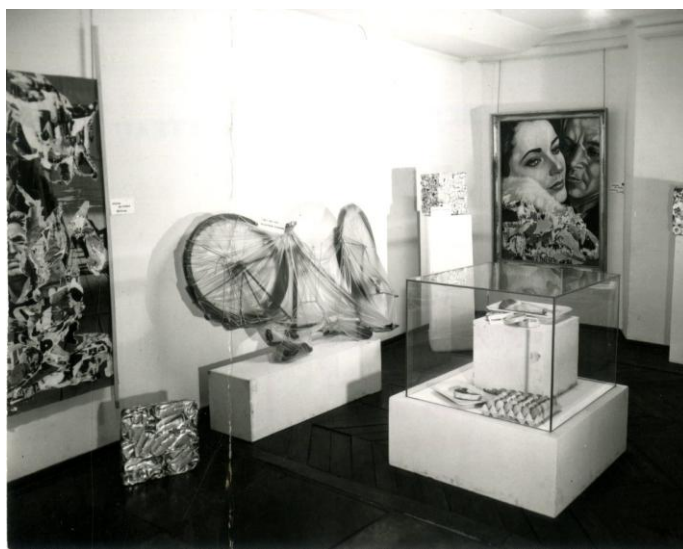
Exposition La réhabilitation de l'objet , 1965