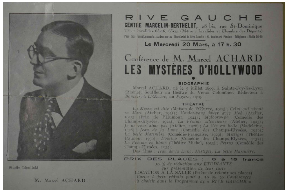
Figure 1. Prospectus « Les Mystères d'Hollywood », 1935, BNF.