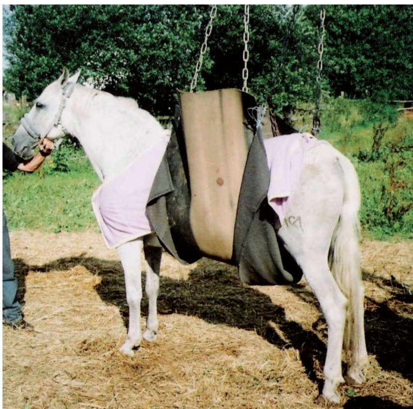
Figure 2 : Cheval atteint d'EMH maintenu par des sangles pour éviter qu'il ne se couche et pour favoriser la récupération.

L'épidémiologie de l'EMH comporte beaucoup d'inconnues et la connaissance des facteurs de risques qui lui sont associés est encore lacunaire. Aussi, en l'absence d'une vaccination efficace, la prévention demeure-t-elle le meilleur moyen de protection contre la maladie.