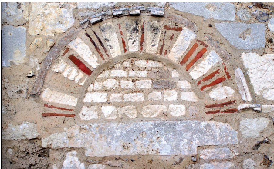
2 - Porte dans le mur sud de l'église Saint-Martin à Condé-sur-Risle. On remarque au niveau de l'arcature l'alternance de briques et de pierres calcaires