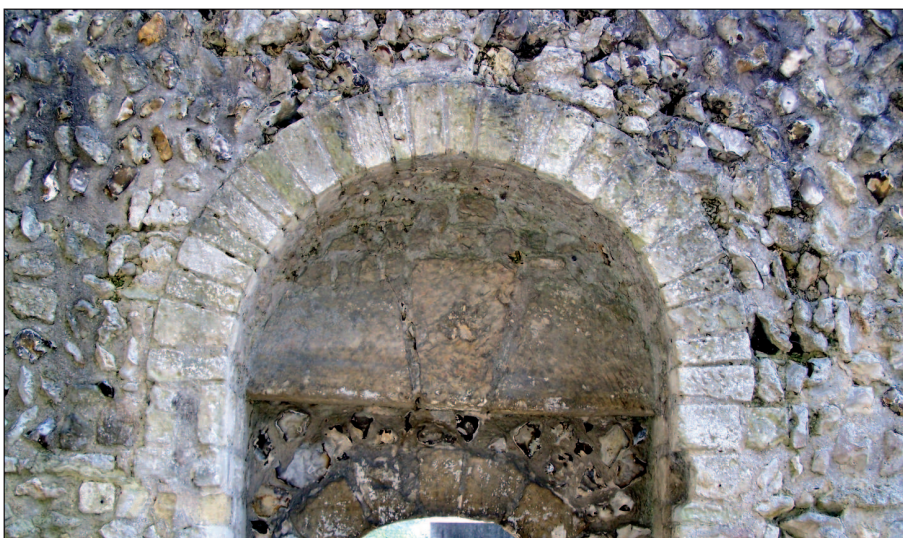
3 - Porte à fins claveaux dans le mur sud de la nef de l'église Saint-Martin à Neaufles-Saint-Martin