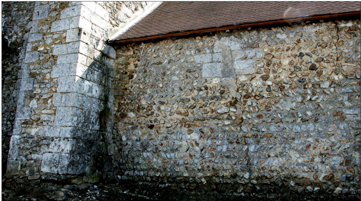
11 - Vue générale du mur nord de la nef