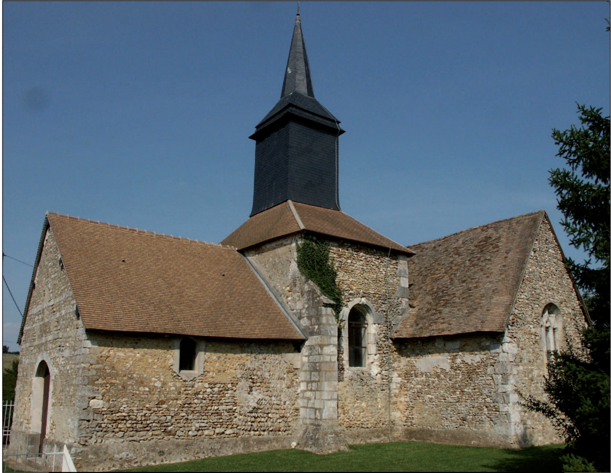
7 - Villez-sous-Bailleul - Vue générale de l'église prise du sud