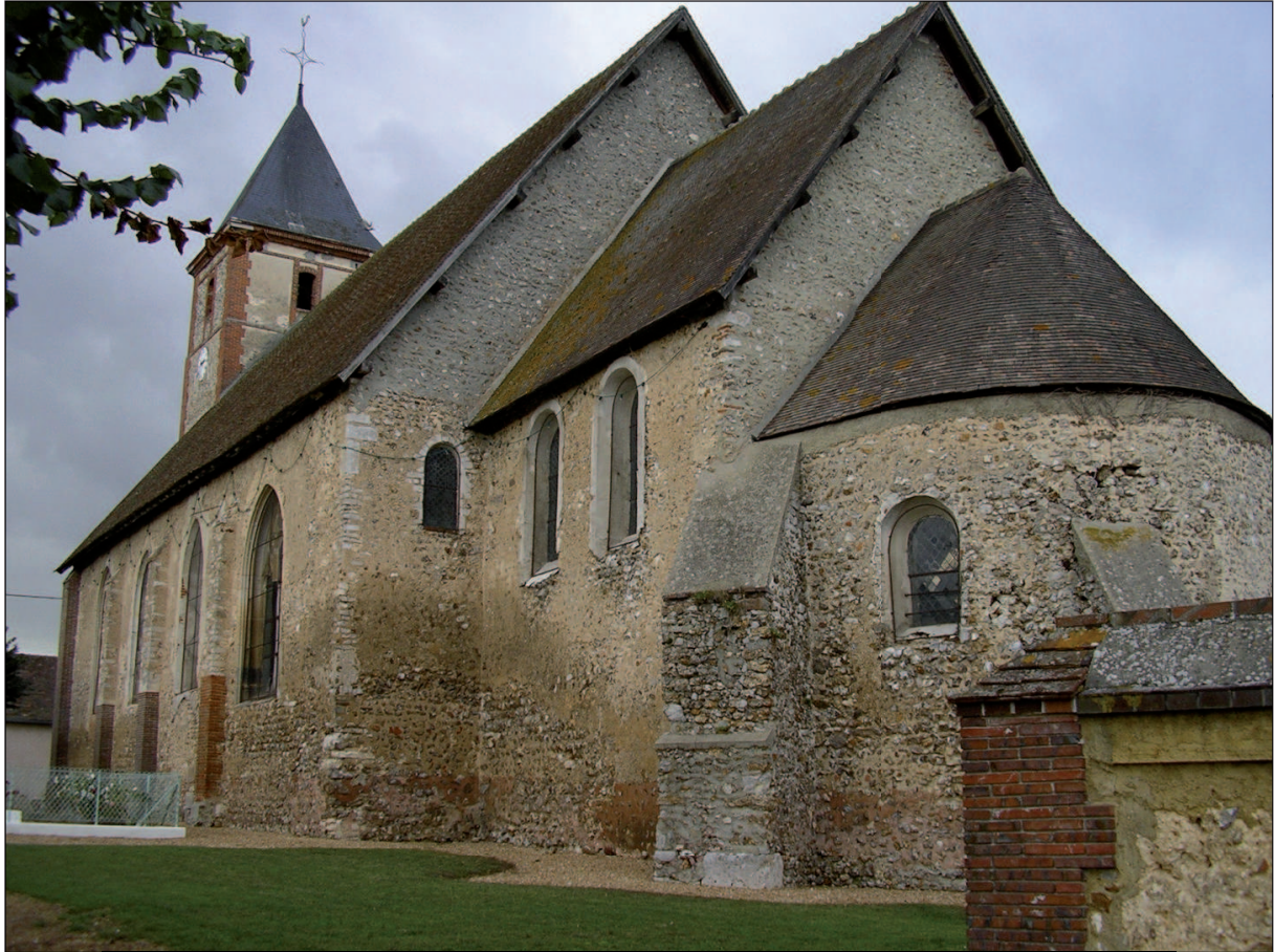
4 - Chevet Semi-circulaire de l'église Saint-Georges à Saint-Georges-Motel