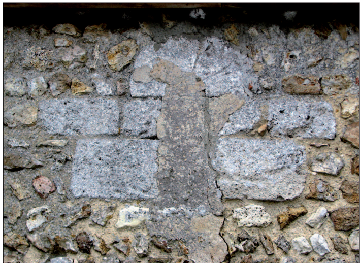
12 - Détail de la petite fenêtre haute percée dans le mur nord de la nef. On distingue également le linteau monolithe gravé de faux claveaux