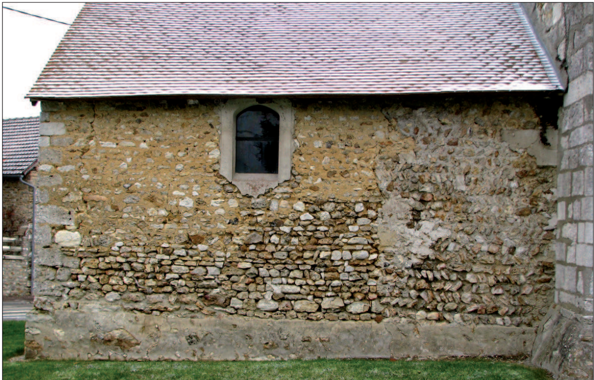
8 - Sud de la nef. Seule la partie la plus orientale comporte un appareillage en opus spicatum