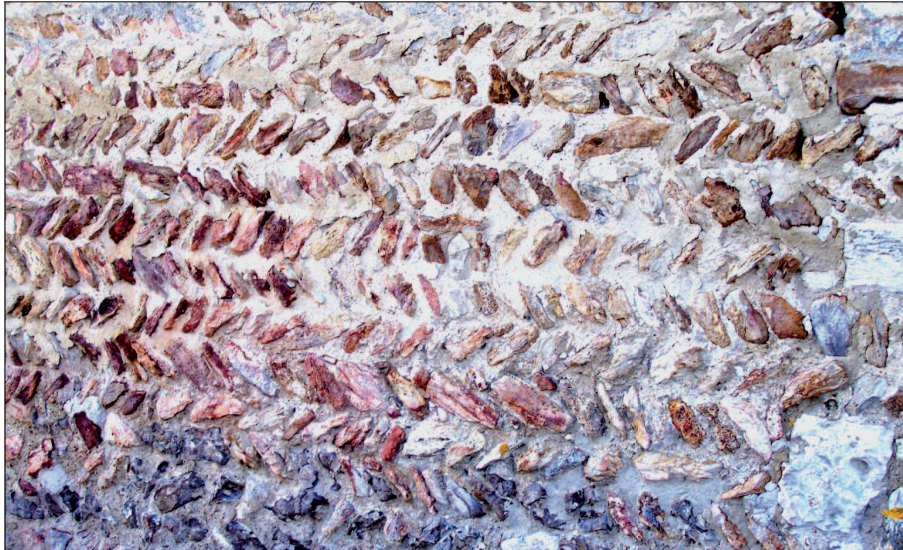
1 - Détail de la maçonnerie en opus spicatum de l'église Saint-Christophe à Reuilly