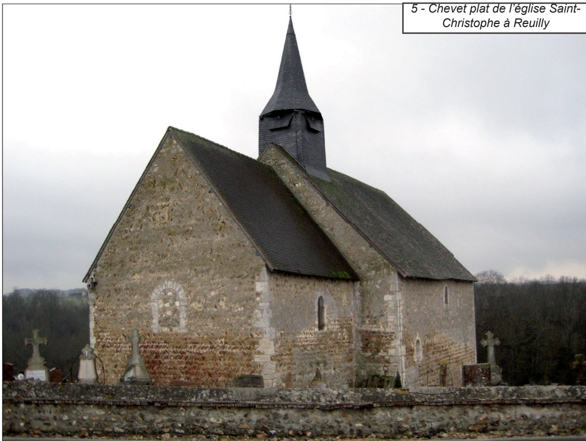
5 - Chevet plat de l'église Saint-Christophe à Reuilly