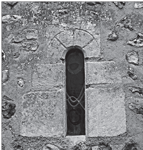
6 - Fenêtre sur le mur sud de la nef de l'église Saint-Martin à Fontaine-la-Soret (Canton de Beaumont-le-Roger, Eure). On distingue le linteau monolithe, gravé de faux claveaux

opus reticulum avec des pastoureaux ou petits moellons calcaires comme à l'église Saint-Pierre à Courdemanche (canton de Nonancourt, Eure) et à l'église Saint-Georges à Quessigny (canton de Saint-André de l'Eure, Eure), avec parfois des alternances de lits de briques comme les églises Saint-Martin à Condé-sur-Risle (canton de Montfort-sur-Risle, Eure), Notre-Dame-d'outre-l'Eau à Rugles (Chef-lieu de canton, Eure), Saint-Martin à Coudray-en-Vexin (canton d'Etrépagny, Eure) et Saint-Georges à Saint-Georges-Motel (canton de Nonancourt, Eure).