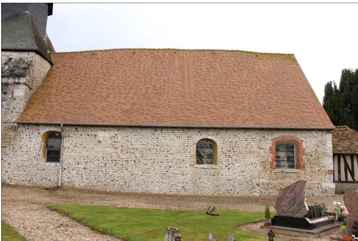
Mur nord de la nef construit en petits modules de silex en assise régulière et disposés en opus spicatum

En premier lieu, c'est une construction maçonnée en petits silex disposés en épi ( opus spicatum ) et en assises régulières horizontales. Malheureusement, un rejointoiement invasif des maçonneries gêne la lecture des murs de la nef et ne permet pas d'observer les mortiers anciens. Par ailleurs, ce mur n'est raidi par aucun contrefort comme la quasi-totalité des édifices antérieurs au milieu du XI e siècle.