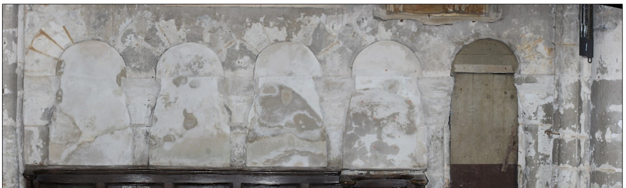
Arcatures du mur Nord de la première travée de la nef

Le premier niveau de la première travée est agrémenté d'arcatures en plein cintre sur les murs nord et sud. Celles-ci reposent sur des chapiteaux sculptés. Leur état ne nous permet de voir uniquement quelques décors en godrons. Ces chapiteaux reposent sur des colonnes semi-circulaires. Le mur nord comporte quatre arcatures dont la troisième en partant de l'ouest est plus grande que les autres et elle est percée d'une ouverture qui communique avec la sacristie. Le mur sud a cinq arcatures dont quatre sont aveugles ; la cinquième située à l'ouest est percée d'une porte étroite permettant d'accéder à la tourelle d'escalier qui dessert le clocher.