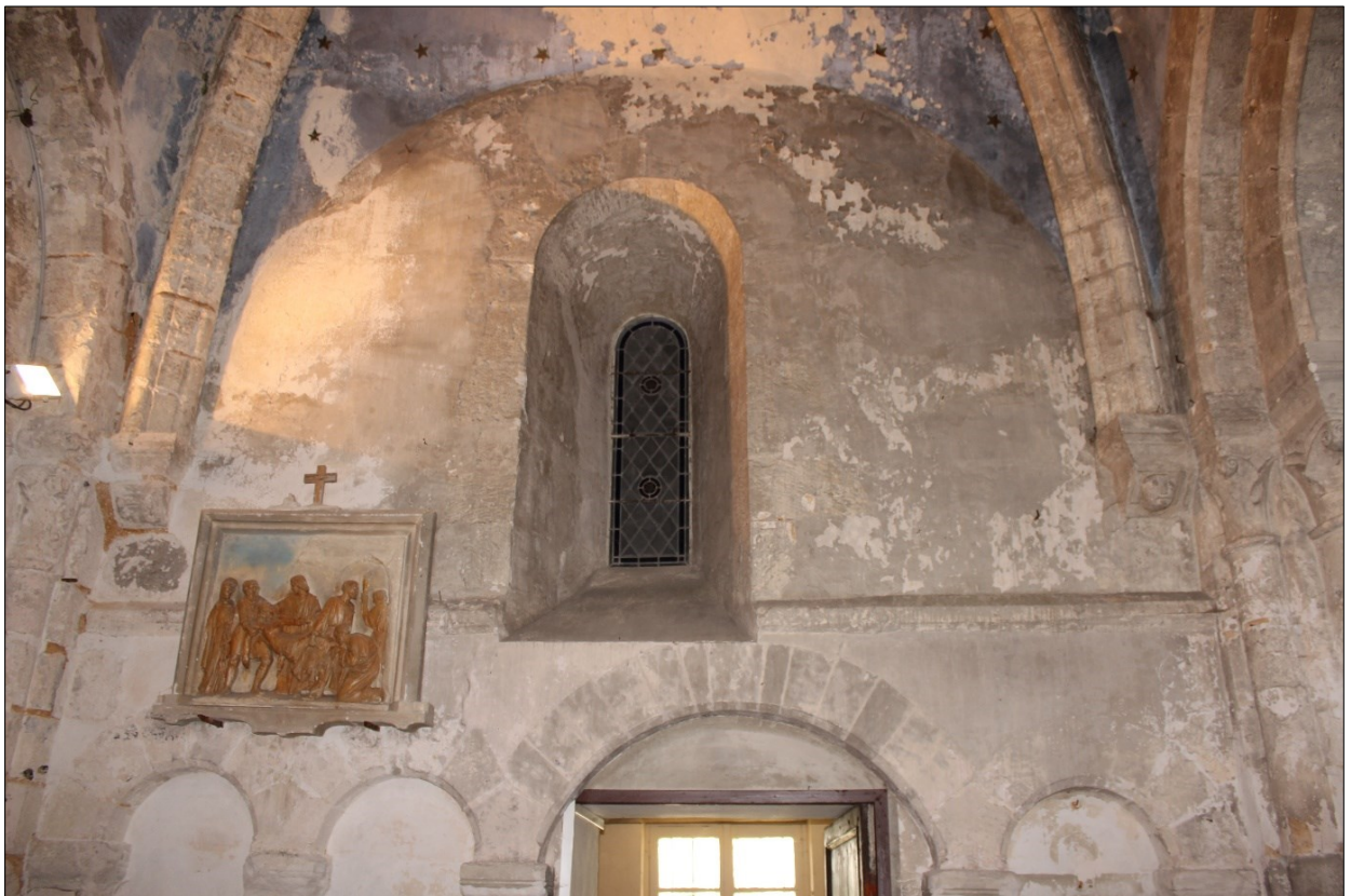
Baie en plein cintre située au-dessus des arcatures de la première travée de la nef. On remarque aussi sur cette photographie les nervures de la voûte qui retombent sur des modillons

Au-dessus de chacun de ces groupes d'arcature une baie en arc de plein cintre est percée dans les murs nord et sud de la première travée du chœur. Celle-ci est couverte d'une voûte quadripartite sur croisée d'ogives. Les nervures moulurées reposent sur des modillons sculptés de têtes humaines.