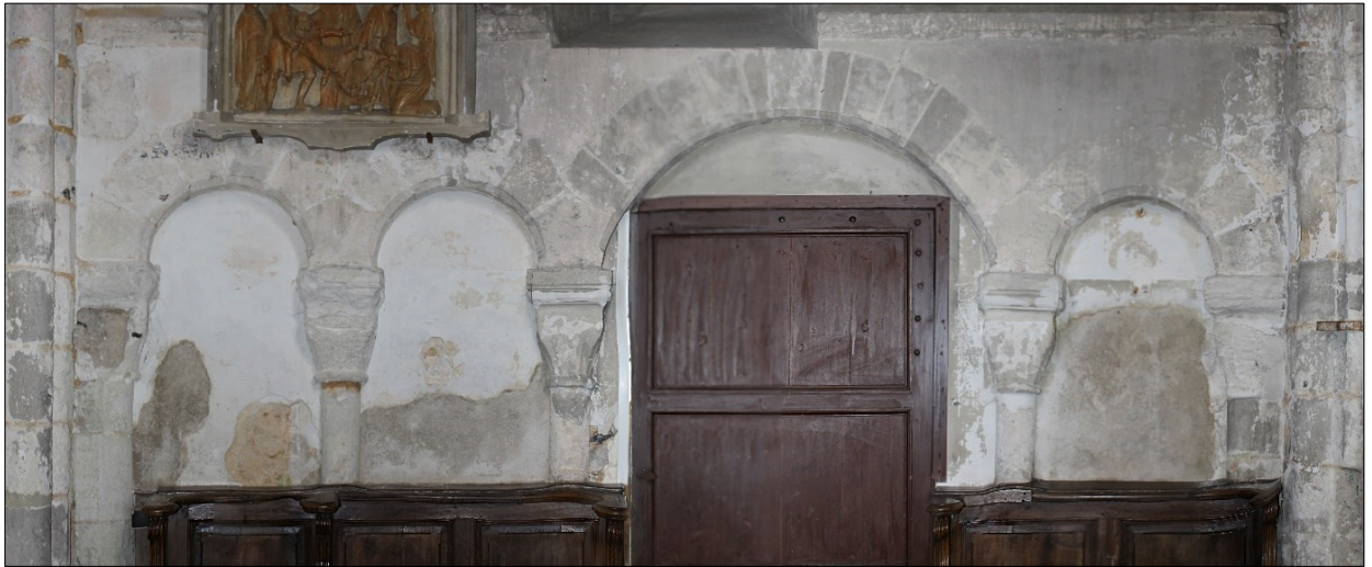
Arcatures du mur sud de la première travée de la nef

Au-dessus de chacun de ces groupes d'arcature une baie en arc de plein cintre est percée dans les murs nord et sud de la première travée du chœur. Celle-ci est couverte d'une voûte quadripartite sur croisée d'ogives. Les nervures moulurées reposent sur des modillons sculptés de têtes humaines.