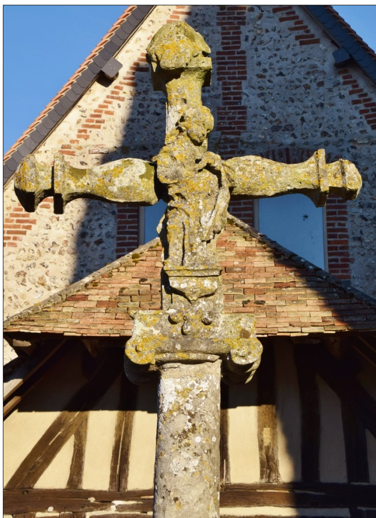
Calvaire (inscrit M.H.), dans l'enclos du cimetière

Cette étude mériterait d'être approfondie avec des recherches sur les charpentes, sur la tour-clocher et sur les décors peints.