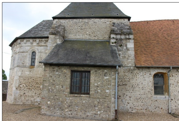
Façades nord et sud du chœur de l'église de Cuverville