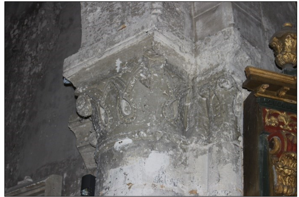
Chapiteau à feuillages plats à crochets

Le chevet est couvert d'une voûte en cul de four posée sur quatre nervures moulurées qui retombent sur des chapiteaux décorés de feuillages plats.