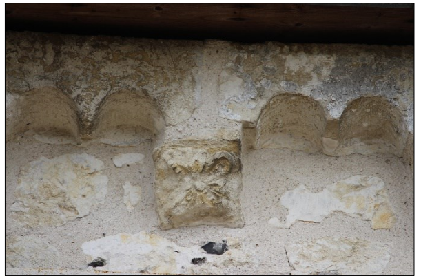
Modillons supportant la corniche du chevet

L'intérieur du chœur présente une architecture romane assez élaborée qui comporte des éléments sculptés. Malheureusement, ceux-ci sont en très mauvais état à cause de problèmes d'humidité importants. En effet, de nombreuses pierres sont en état de ruine.