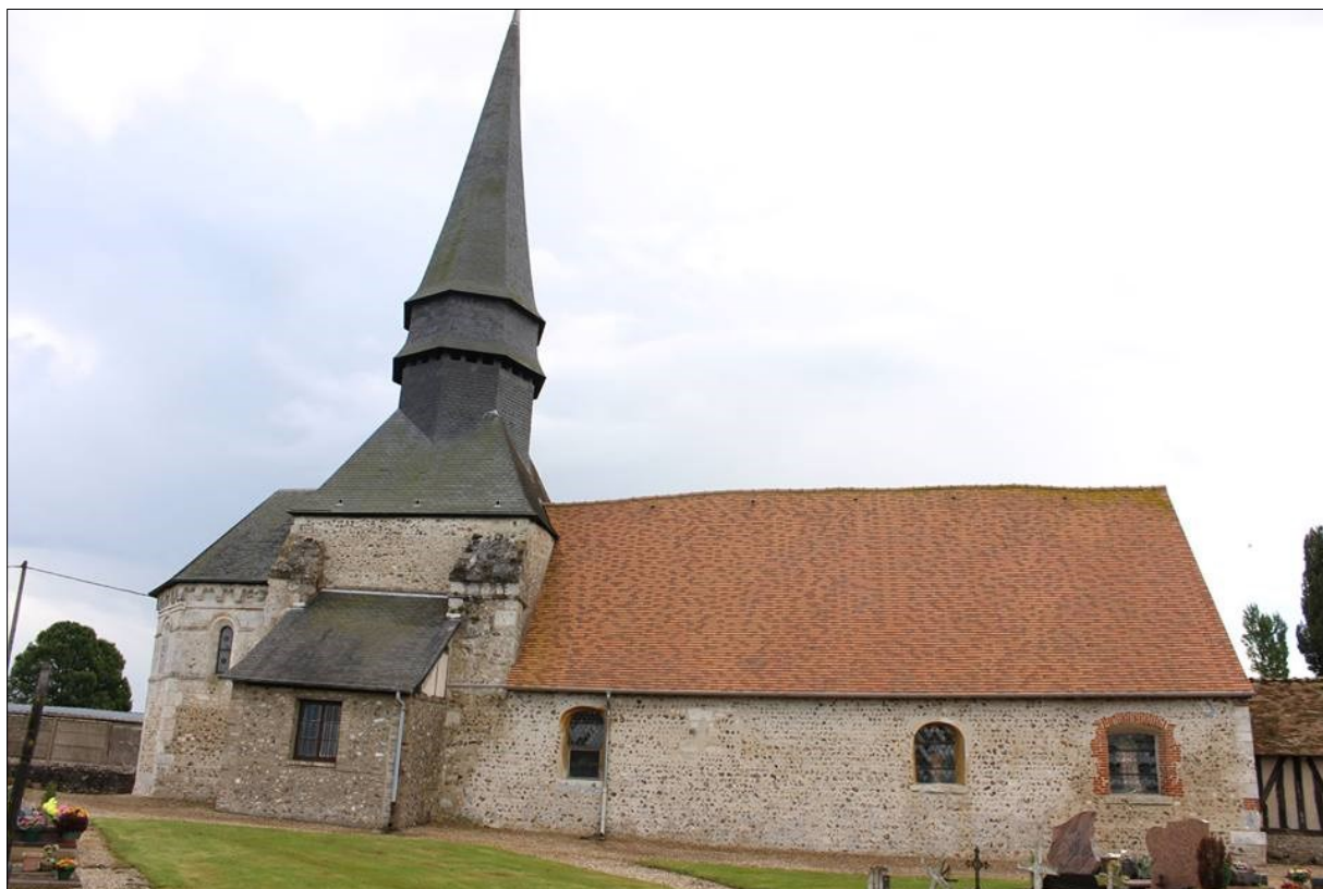
Eglise Saint-Pierre, vue d'ensemble

Or, des observations nouvelles permises par des recherches récentes sur les édifices romans les plus anciens, nous permettent de penser que la nef de l'église de Cuverville est bien antérieure au chœur. Elle peut être rattachée aux constructions romanes précoces construites à l'aube du XI e siècle 1 . Depuis près de vingt ans, une étude est menée sur ces édifices cultuels et a permis de recenser dans l'Eure et en Seine-Maritime quatre-vingt-seize églises affectées ou désaffectées qui ont des parties présentant des caractéristiques architecturales de cet art roman précoce 2 .