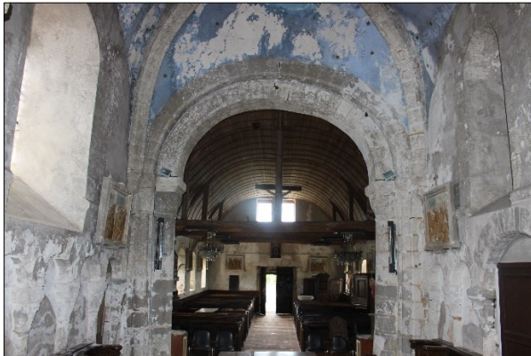
Arcature en plein cintre séparant le chœur de la nef