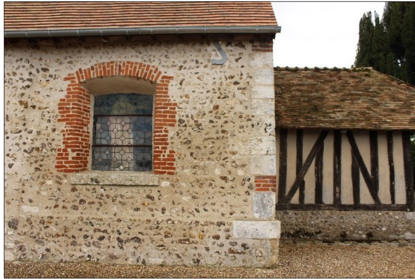
Baies repercées au XVIII e siècle sur les murs nord (à gauche) et sud (à droite) de la nef