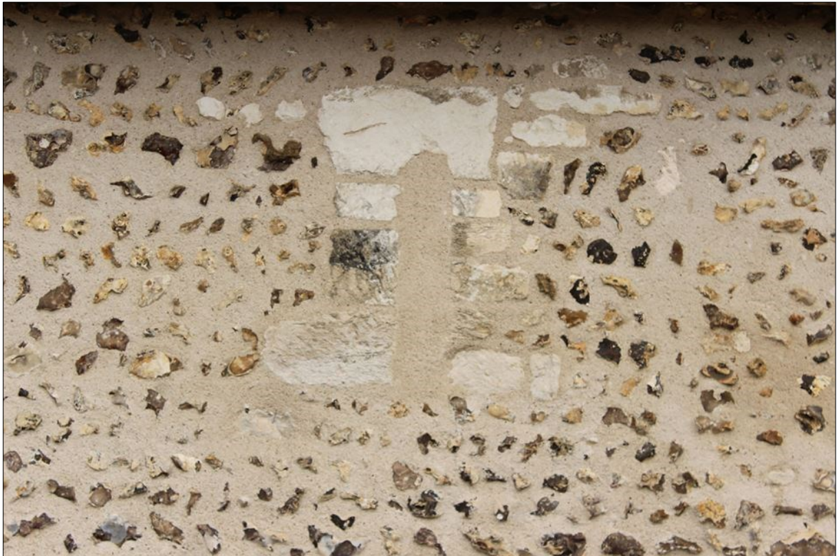
Baie à linteau monolithe sur le mur nord de la nef

Ces différentes caractéristiques se retrouvent dans des édifices que nous datons maintenant entre la seconde moitié du X e et la première moitié du XI e siècle. On peut comparer cette architecture à celle des églises de Pierre-Ronde (Commune de Mesnil-en-Ouche, Département de l'Eure) ou de Calleville (Département de l'Eure). Pierre Ronde a été datée par radiocarbone de 974 +/- 30 ans. Quant à Calleville, les résultats des analyses des charbons de bois provenant des mortiers de la nef de cette église permettent de penser que ce bâtiment fut édifié entre 960 et 1025.