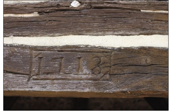
Porche en pan de bois sur une base maçonnée en silex construit en 1713