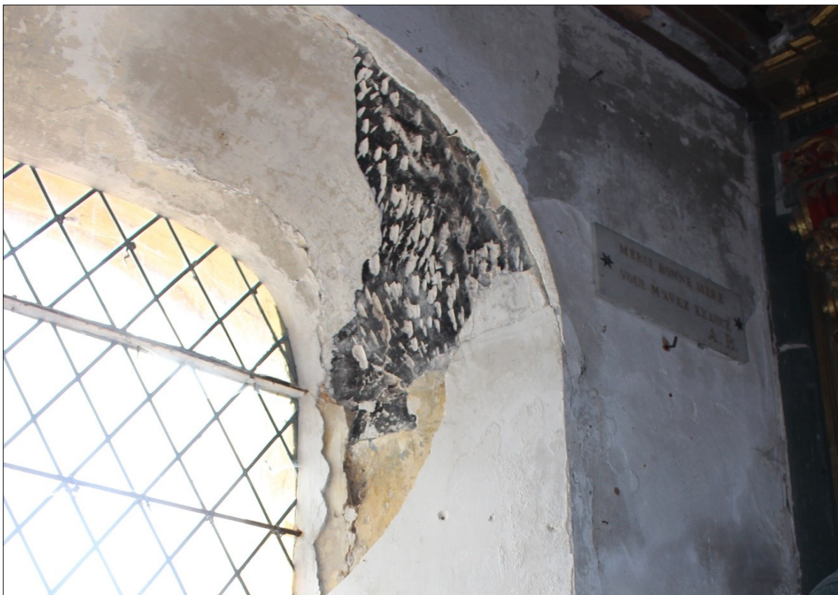
Trace de peinture noire témoignant la présence d'une litre funéraire à l'intérieur de la nef

Néanmoins, des traces d'une litre funéraire ont été observées sur le mur nord de la nef sur l'encadrement de la fenêtre la plus orientale.