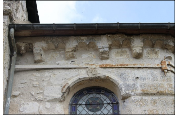
Mur est et sud du chevet, détail de la corniche et des modillons