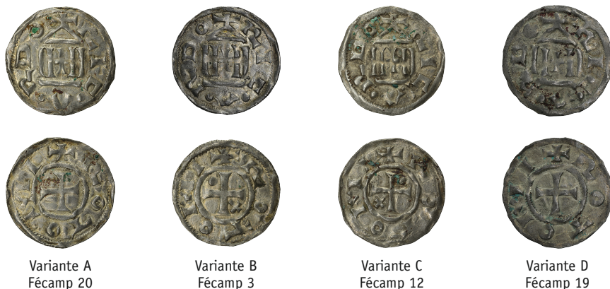
Figure 1 - Illustration des quatre variantes du type Fécamp 3-20.