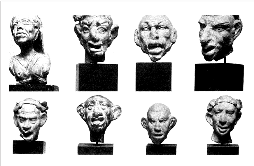
Fig. 3 – Têtes grotesques (Musée de l'État, Berlin) (reproduction Grmek & Gourevitch 1998, 227, fig. 170)