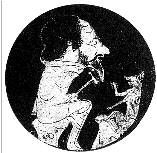
Fig. 2 – Portrait d'Ésope ( kylix attique, ca 440 av. J.-C., Musées du Vatican, Museo Gregoriano Etrusco, Inv. 16552) (reproduction Grmek & Gourevitch 1998, 33, fig. 8)