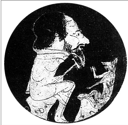
Fig. 2 – Portrait d'Ésope ( kylix attique, ca 440 av. J.-C., Musées du Vatican, Museo Gregoriano Etrusco, Inv. 16552) (reproduction Grmek & Gourevitch 1998, 33, fig. 8)