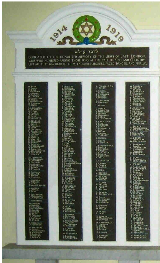
5 Plaque de commémoration des morts à la guerre d'une des synagogues de Londres

Little Solomon Isaacstein lived down in Petticoat Lane Until the war, this terrible war Then off he went and enlisted In the Black watch. Said he 'I'd rather have the gold watch For that's the watch for me' They gave him a khaki suit he loathes He ran in the street to sell his left off clothes.