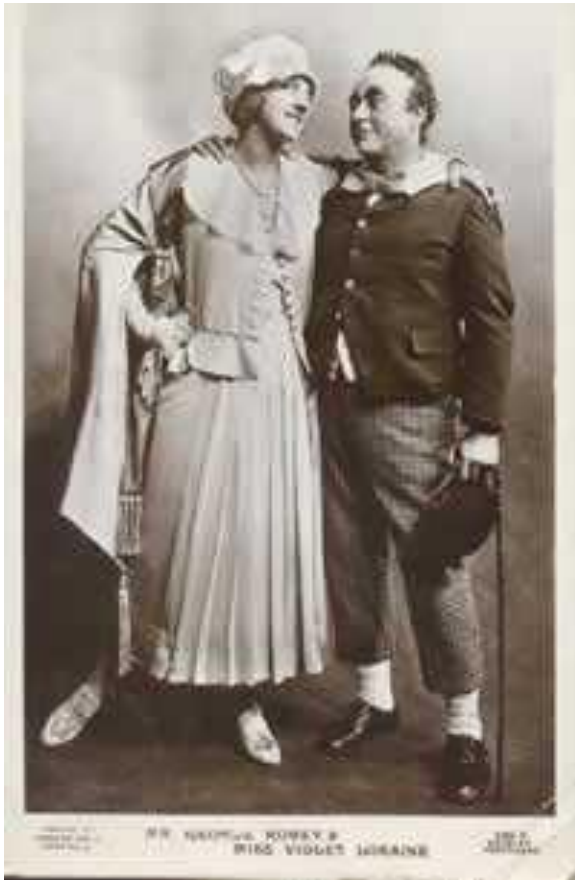
6 George Robey and Violet Loraine

Sometimes when I feel low And things look blue I wish a boy I had... say one like you ! Someone within her heart to build a throne Someone who'd never part, to call my own.