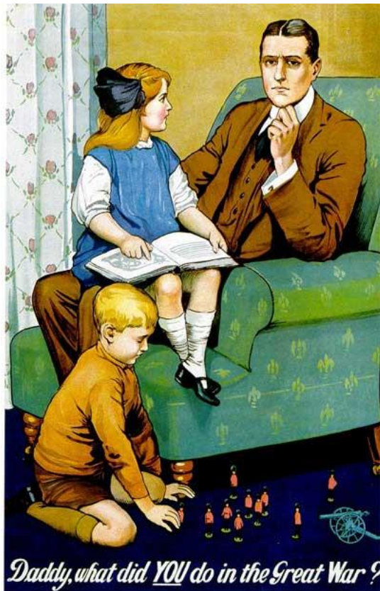
8 Affiche de propagande qui a inspiré cette chanson

Take my head on your shoulder Daddy, Tell me the tale once more I've often asked you to tell me, Daddy What you did in the great Great War ?