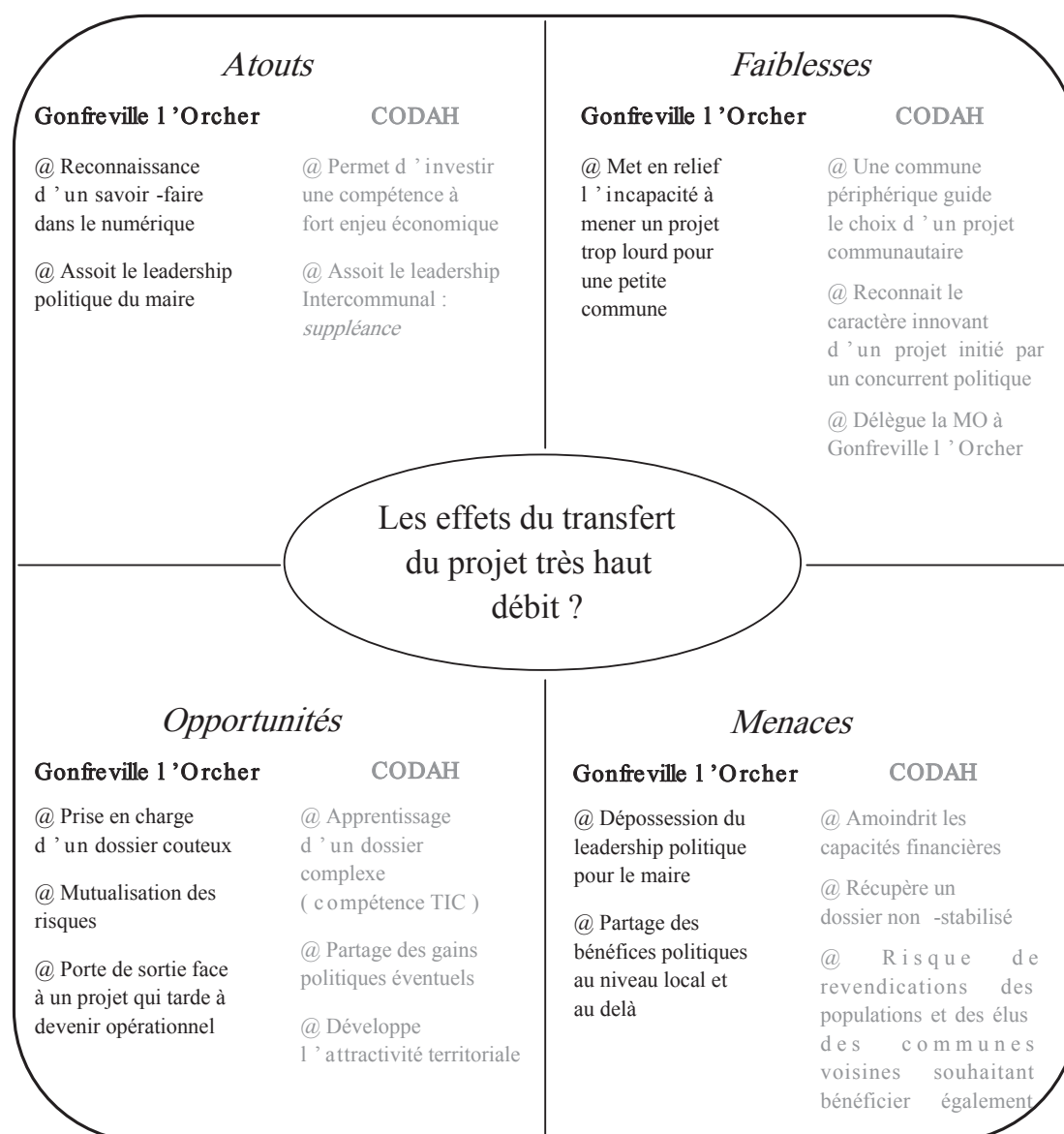
Figure 1 : Les effets du transfert de projet très haut débit

régional de Haute-Normandie... principal opposant au maire du Havre et président de la CODAH) a accepté de se dessaisir partiellement des gains politiques (figure 1). Il considère toutefois que ce transfert n'a en rien écorné son crédit d'expert dans le domaine des TIC et que son leadership, déjà conséquent, s'en trouve renforcé : « J'ai toujours dit que si un jour il y avait l'élection du président de l'agglomération au suffrage universel, je serai candidat. Je ne m'appuierai pas sur ce projet [numérique] comme argument électoral, mais je sais que les habitants l'auront en tête... Quand vous déployez un réseau comme le nôtre cela se sait, cela se voit. » 37 .