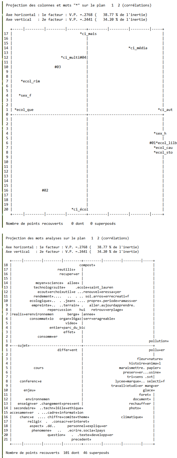
Figure 2 – Analyse factorielle des correspondances (AFC) des mots étoilés et des mots analysés

LE SYMBOLE + INDIQUE LES TERMINAISONS DIFFÉRENTES D'UN MÊME MOT (NOM, ADJECTIF OU VERBE). LE SYMBOLE < INDIQUE LA PRÉSENCE, DANS LE DICTIONNAIRE ALCESTE, DE LA TRONCATURE D'UN MOT POUR N'EN CONSERVER QUE LA RacINE. LES SYMBOLES...SERVENT À BARRER LES MOTS QUI ONT ÉTÉ MASQUÉS SUR LE GRAPHIQUE. LE SYMBOLE* REPRÉSENTE NOS MOTS ÉTOILÉS (SEXE, ÉCOLES, CIRCONSTANCES)