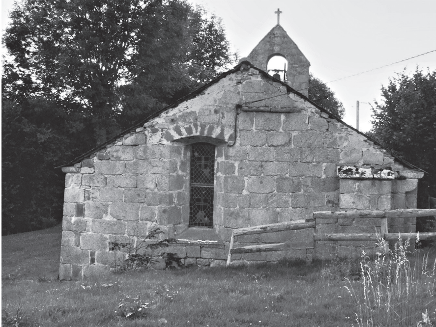
Fig. 4. Chevet de la chapelle de L'Éclache, état actuel.

bibliographie est sans doute plus développée pour d'autres régions d'Europe, mais même dans ce cas, il convient de remettre en cause quantité d' a priori . Cet article se veut donc d'abord une invitation à remettre en cause de nombreux lieux communs d'une historiographie cistercienne encore profondément marquée par une vision téléologique, qui n'accorde guère d'intérêt à tous ceux qui ont vécu entre Bernard de Clairvaux et Rancé. Il est d'ailleurs regrettable que le passage d'une historiographie centrée sur le cycle ininterrompu des réformes et des décadences à la problématique « idéal et réalité » n'a fait qu'accentuer le désintérêt pour les cisterciens passé le vivant de Bernard ou, au maximum, les années 1200 ou 1250, dates de leur déclin irréversible selon un Georges Duby 182 ou un Robert Fossier 183 .