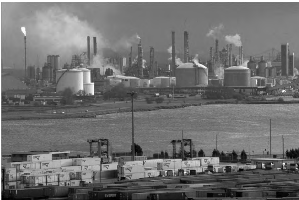
« Total a scindé les attentes devant faire l'objet d'une réponse de la part du site de celles relevant de l'ensemble de la zone industrielle du Havre ». Vue de la raffinerie de Normandie située dans la zone industrielle du port du Havre (en avril 1998).

mieux communiquer auprès de ses PPL, mais aussi impliquer les salariés du site dans une démarche sociétale. Lors de nos derniers entretiens, notre recherche a permis de faire prendre conscience aux responsables de la communication de la place privilégiée occupée par les salariés dans le RDD local. Il est d'ailleurs intéressant de noter que ce RDD local n'est disponible en version électronique que sur l'intranet de la raffinerie de Normandie, ce qui renforce une fois de plus la place occupée par les salariés dans le processus.