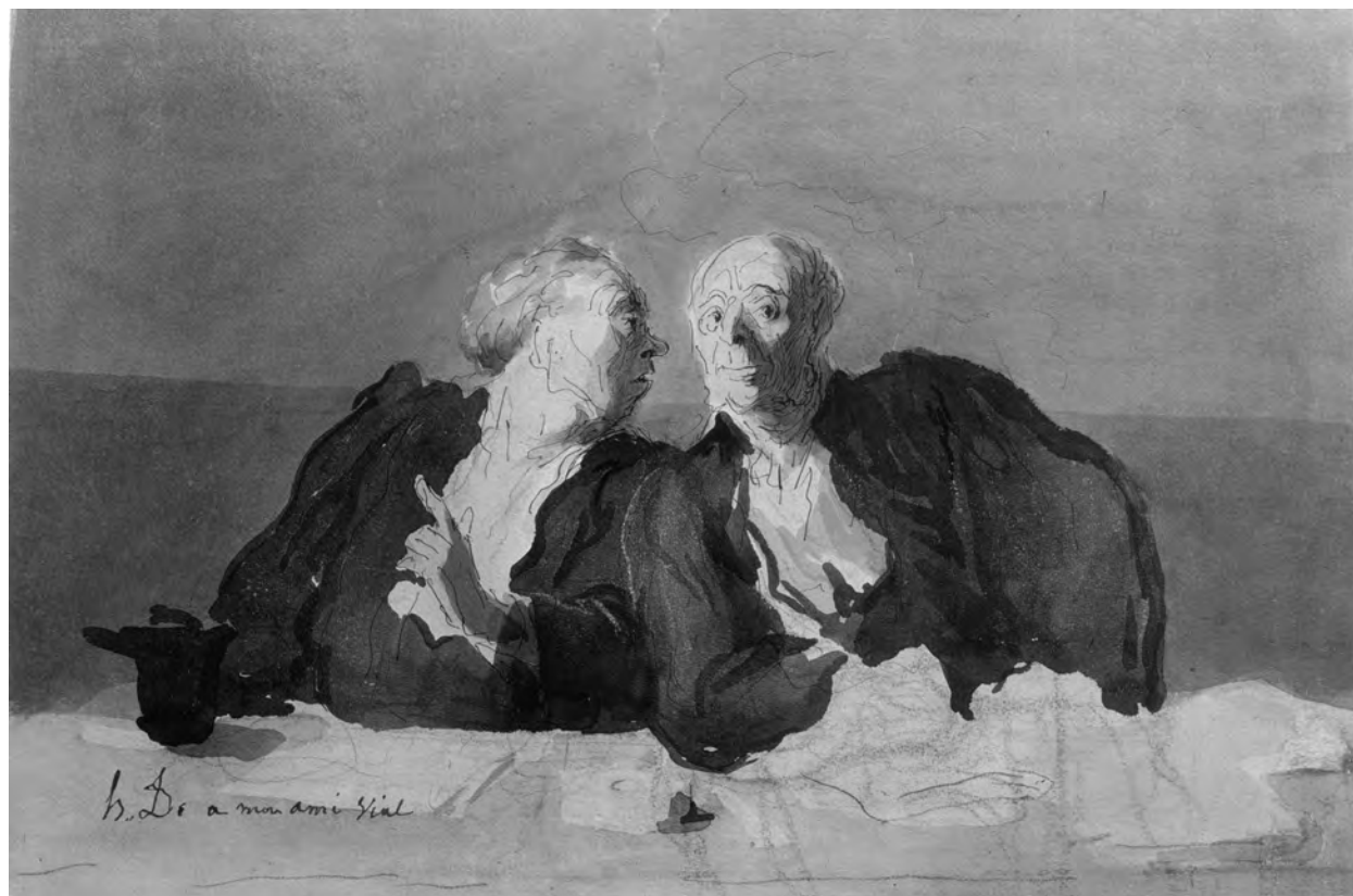
« Chacune des parties prenantes apprend de sa mise en relation avec une autre entité ». "Un argument péremptoire", aquarelle de Daumier (1808-1879), 1850.

Sans envisager la concurrence entre les différentes parties prenantes, la diversité des objets d'apprentissage (ce qui est appris et les caractéristiques de ce qui est appris) inscrit l'apprentissage dans un processus. À ce stade, nous pouvons préciser notre question de recherche, qui devient : « La consultation des PPL n'est-elle qu'un exercice de style ou bien doit-elle être envisagée comme le point d'ancrage d'un processus