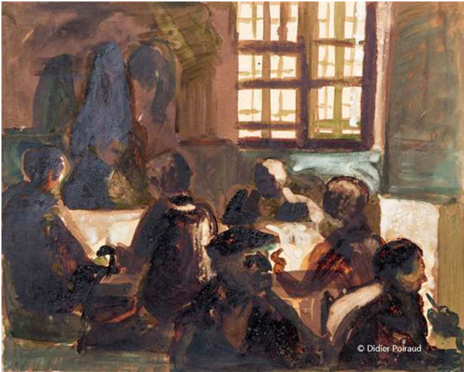
Grenoble - février 1962 Fig. 2. La société

Source : 56x45, papier « mecanorama » © Didier Poiraud