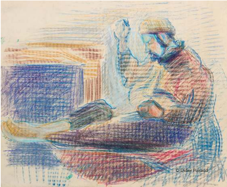
Grenoble – mai, juin 1962 Fig. 9a. Ravaudage (1)

Source : 56x45, papier « mecanorama » © Didier Poiraud