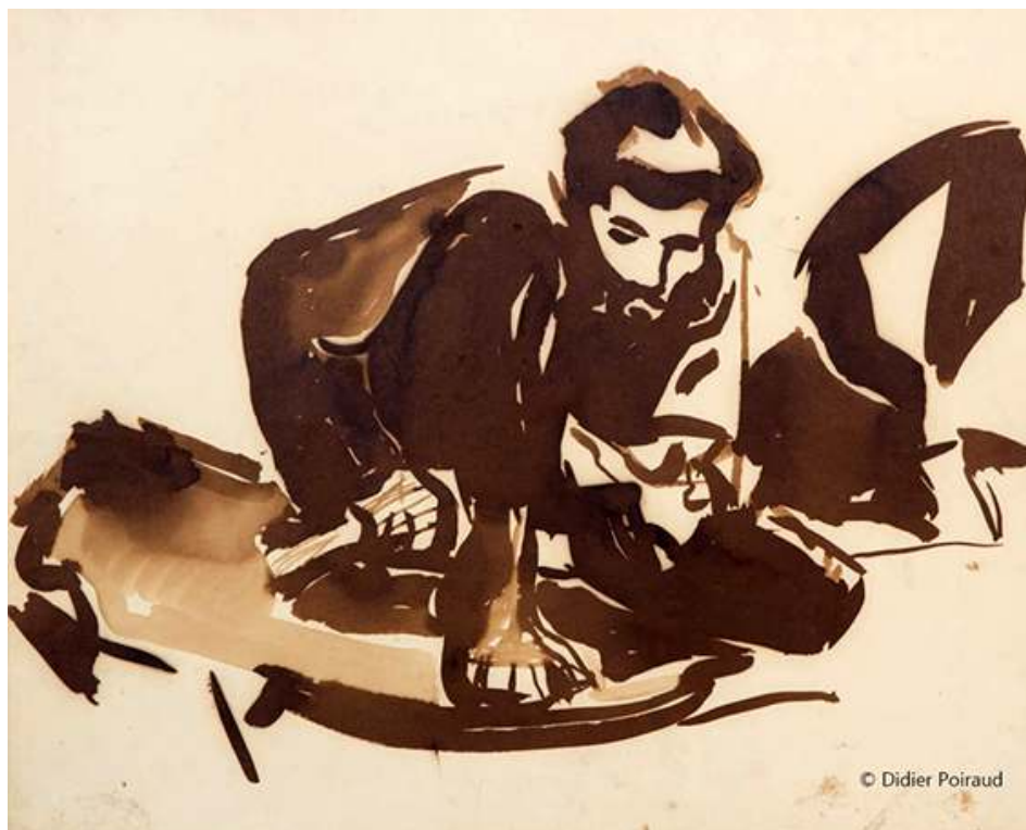
Fig. 1. Erwan

Source : 56x45, papier « mecanorama » 22 © Didier Poiraud