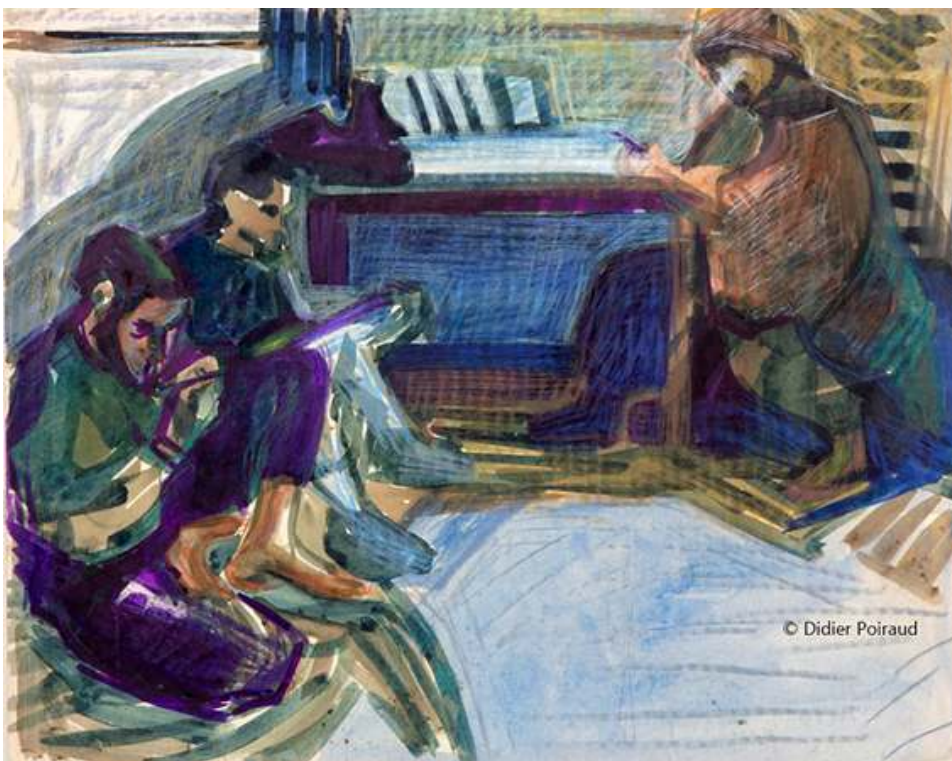
Fig. 12. Lumière polaire

Source : 56x45, papier « mecanorama » © Didier Poiraud