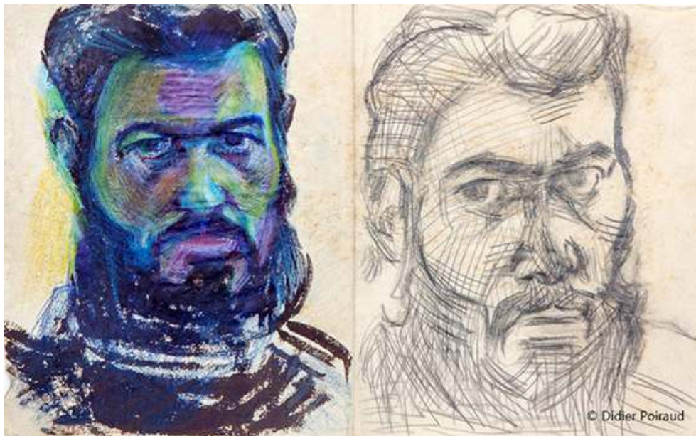
Fig. 16-17. Autoportraits 1 et 2

Source : verso 1 et 2, 24x30, papier « chiffons » © Didier Poiraud