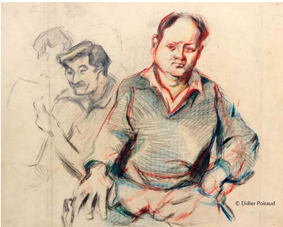
Fig. 6. Le jovial plâtrier

Source : 56x45, papier « mecanorama » 28 © Didier Poiraud