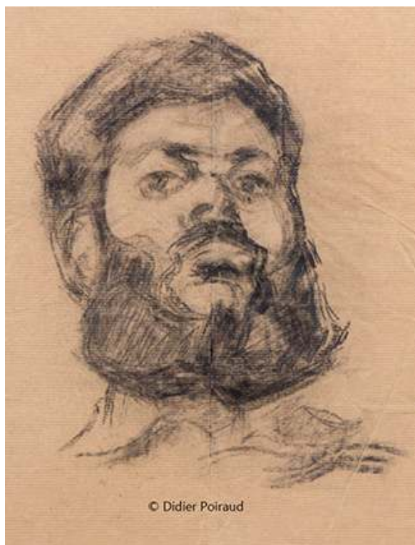
Fig. 18. Autoportrait 3

Source : 32x49, papier « kraft » (Fontevraud) © Didier Poiraud