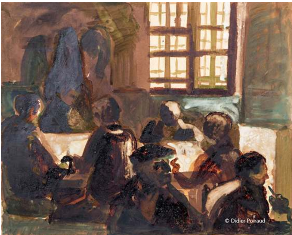
Grenoble - février 1962 Fig. 2. La société