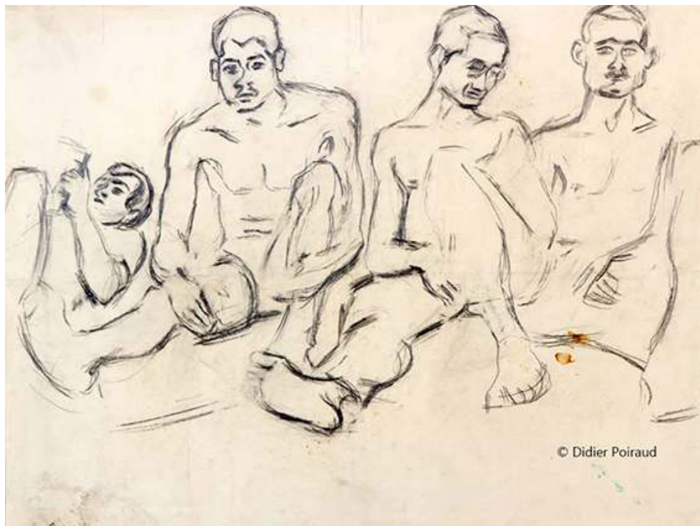
Fig. 14. Au poste, privés de cortie

Source : 65x50, papier « cansou » © Didier Poiraud