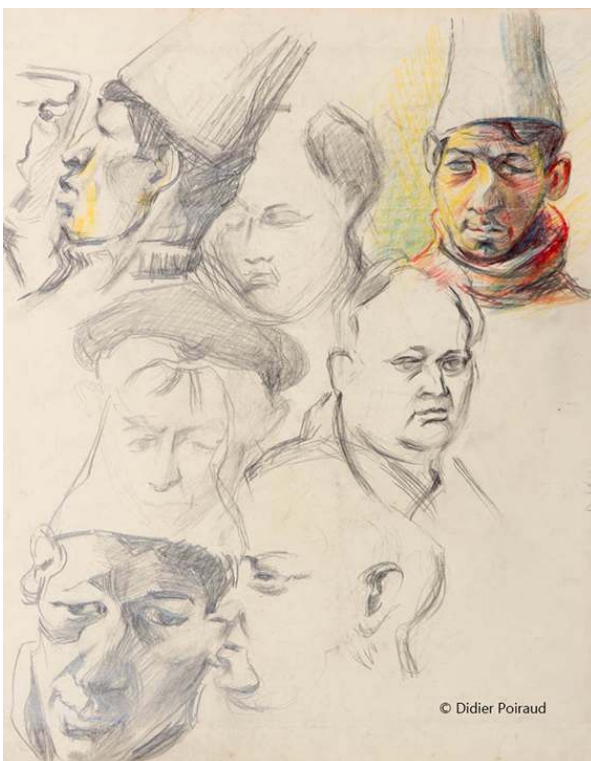
Fig. 8. Étude de visages

Source : 45x56, papier « mecanorama » © Didier Poiraud