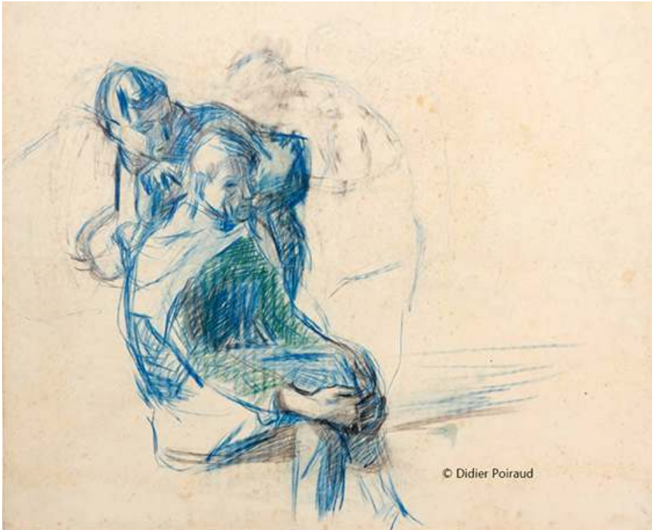
Fig. 5. Le coiffeur

Source : 56x45, papier « mecanorama » © Didier Poiraud