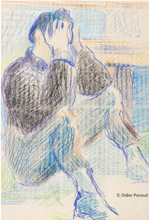
Fig. 11. Gamberger

Source : 45x56, papier « mecanorama » © Didier Poiraud