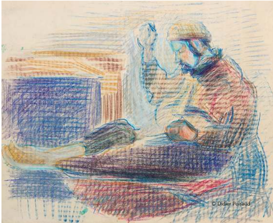
Grenoble – mai, juin 1962 Fig. 9a. Ravaudage (1)

Source : 56x45, papier « mecanorama » © Didier Poiraud