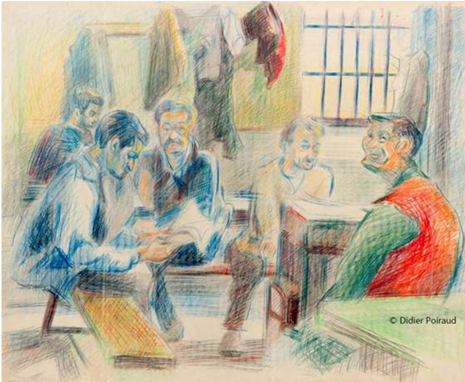
Fig. 7. Près du poêle

Source : 56x45, papier « mecanorama » 29 © Didier Poiraud