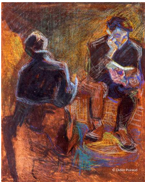
Fig. 13. La lecture

Source : 45x56, papier « mecanorama » © Didier Poiraud