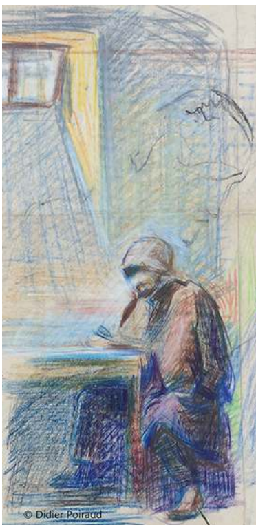
Fig. 10. Lecture dans le froid

Source : 40x62, papier « mecanorama » © Didier Poiraud