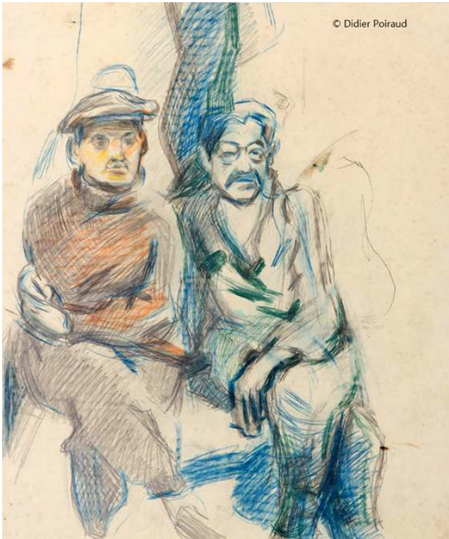
Grenoble – mars, avril 1962 Fig. 4. Dialogue

Source : 45x56, papier « cansou » © Didier Poiraud