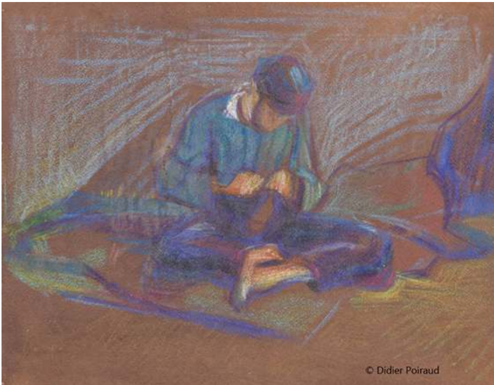
Fig. 9b. Ravaudage (2)

Source : 56x45, papier « mecanorama » © Didier Poiraud