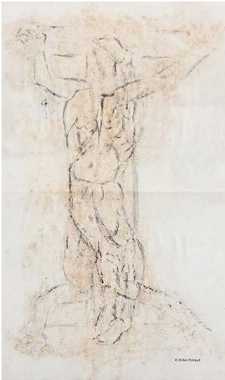
Bourges – fin juillet 1962 Fig. 15a. Le crucifié dupliqué