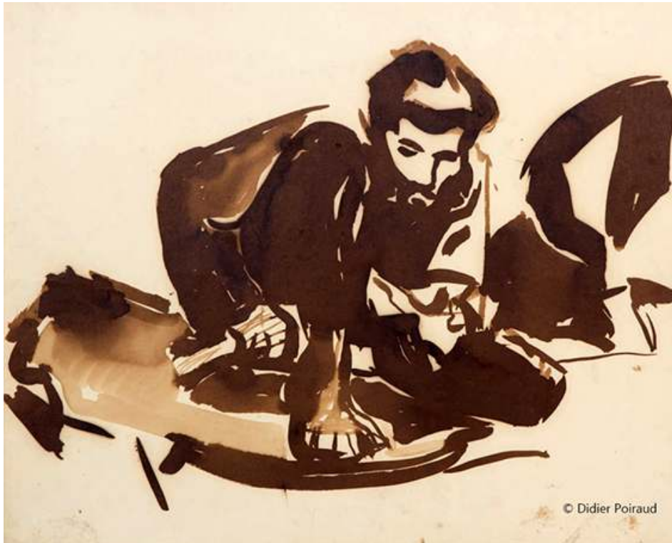
Fig. 1. Erwan

Source : 56x45, papier « mecanorama » 22 © Didier Poiraud