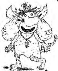
Trucs et ficelles d'un petit troll , ill. E. Lindström, Hachette Jeunesse