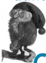
Tomten, ill. Harald Wiberg, Rabén & Sjögren