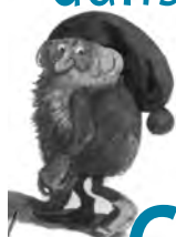
Tomten, ill. Harald Wiberg, Rabén & Sjögren