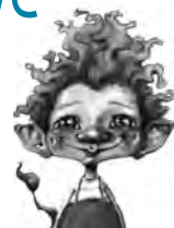
Tambar er et troll, ill. Tor Åge Bringsværd, Gyldendal