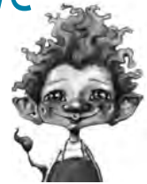
Tambar er et troll, ill. Tor Åge Bringsværd, Gyldendal