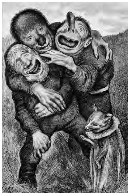
Norwegian Folktales , collectés par P. C. Asbjørnsen et Jørgen Moe, ill. T. Kittelsen, Pantheon Books