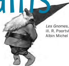
Les Gnomes, ill. R. Poortvliet, Albin Michel