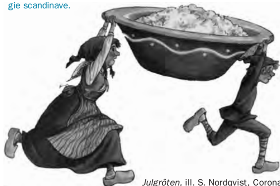
Julgröten, ill. S. Nordqvist, Corona

2. L'Edda est un ensemble de poèmes rassemblés dans un manuscrit islandais du XIII e siècle. C'est aujourd'hui la plus importante source de connaissances sur la mythologie scandinave.