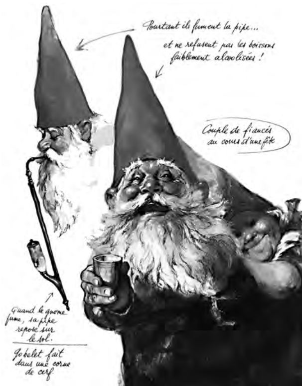
Gnomes, ill. R. Poortvliet, Albin Michel

Ces êtres issus des contes populaires sont désormais les héros des histoires et incarnent le bien. Ils ont parfois intégré le monde des hommes, ou bien ils vivent à l'écart, l'observant de l'extérieur. Les auteurs restent ancrés dans la tradition mais y apportent des nouveautés et modifient les personnages pour qu'ils correspondent aux attentes des jeunes lecteurs. Dans la littérature enfantine actuelle, la nature sauvage imprégnée du folklore est un reflet de notre monde, car trolls et lutins nous ressemblent, mais les problèmes de la société contemporaine n'y existent pas. C'est un monde harmonieux, un retour aux sources. Les trolls et les lutins sont devenus des symboles