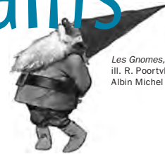
Les Gnomes, ill. R. Poortvliet, Albin Michel