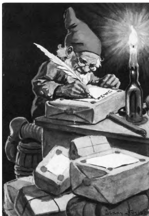
Carte de vœux, ill. Jenny Nyström