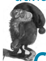
Tomten, ill. Harald Wiberg, Rabén & Sjögren