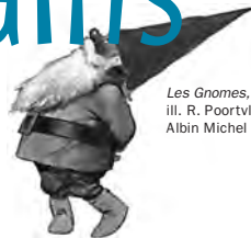
Les Gnomes, ill. R. Poortvliet, Albin Michel