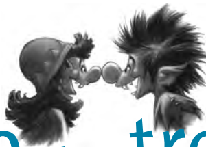
Radder