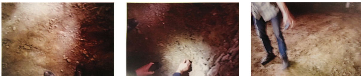
Fig. 3 – Prises de vue du sol lors de la trouvaille.