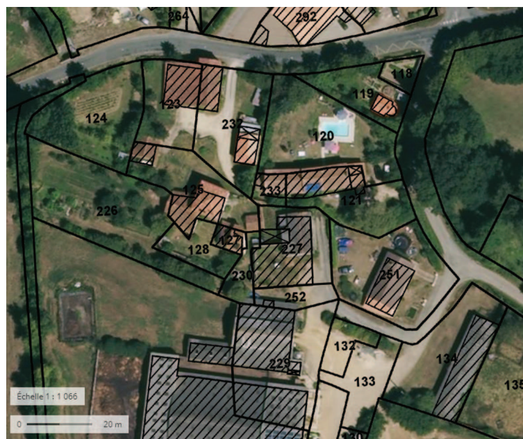
Fig. 1 – Localisation de la trouvaille et parcelles cadastrales.