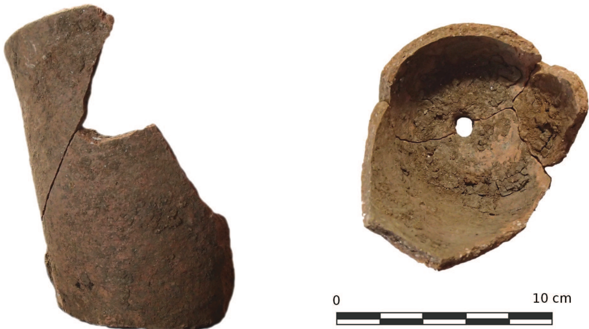
Fig. 4 – « Pot à fleur », vue de profil et du dessus. Photos T. C.

En revanche, plusieurs fragments de céramique ont été prélevés en même temps que les monnaies. Deux individus peuvent être distingués.