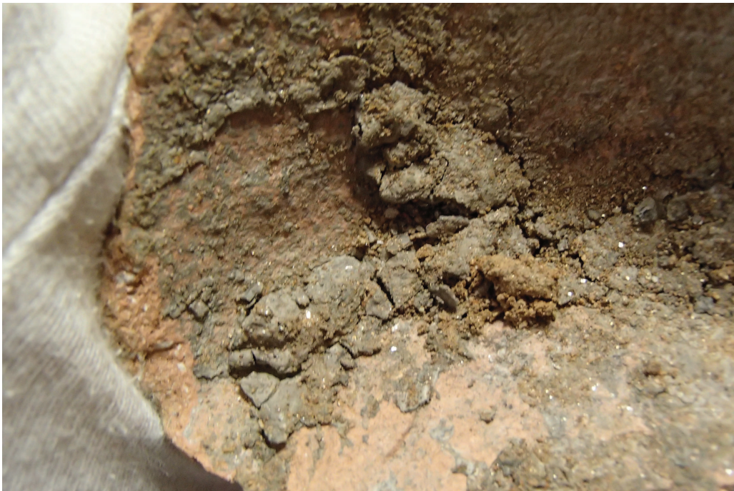
Fig. 6 – Fond du « Pot de fleur » et dépôt de cuir (?).

Outre ces deux éléments céramique, il faut noter la possible présence d'un contenant souple, en matière organique. Le redoublement des contenants en dur par des contenants souples est un phénomène quasi systématique dans les dépôts monétaires, qu'ils soient antiques, médiévaux ou modernes. La sources écrites mentionnent presque toujours l'usage de sacs (textile, cuir) en plus des coffres ou céramiques. Lorsque ces contenants souples sont conservés ou que l'on peut observer des effets de paroi, les sources archéologiques donnent également à voir l'utilisation conjointe de contenants durs et souples (Cardon 2016, p. 185-196).