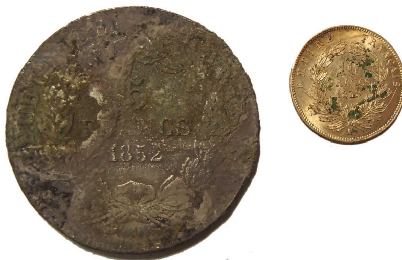
Fig. 9 – Corrosion différenciée au diamètre d'un petit napoléon sur un écu d'argent, et petit napoléon correspondant avec oxydes de cuivre.