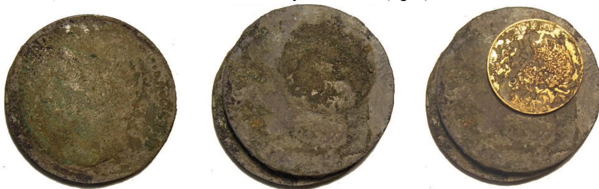
Fig. 8 – Corrosion différenciée permettant de restituer l'agencement de quelques monnaies. Photos T.C.

qu'il s'agisse de monnaies d'or et, dans une moindre mesure, d'argent, a de plus limité les possibilités d'une fixation de cette disposition par les oxydes cuivreux. Un seul élément nous permet de préciser quelque peu cette structure interne. Les monnaies présentes dans le dépôt, si elles sont en métal précieux de haut titre (90 %), n'en contiennent pas moins une petite part (moins de 10 %) de métal vil, principalement du cuivre. Cette faible part de cuivre a donné lieu sur les monnaies d'argent à une oxydation superficielle dans laquelle on peut discerner les empreintes des monnaies qui leur étaient collées. Ainsi, on peut restituer que deux monnaies d'argent étaient plaquées l'une contre l'autre, avec seulement un faible décalage entre les deux (fig. 8). On peut également noter qu'une troisième pièce de 5 F portait sur une même face l'empreinte de deux pièces de 20 F or et d'une pièce de 10 F or. Ces dernières ont d'ailleurs été retrouvées, une de leur face étant couverte d'oxyde de cuivre (fig. 9).