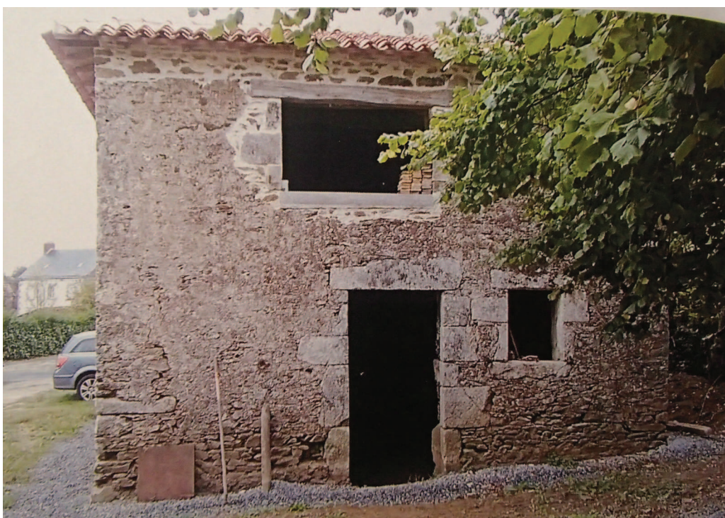
Fig. 2 – Boulangerie dans laquelle se trouvait le dépôt.

Le dépôt monétaire a été mis au jour dans le sol d'une ancienne boulangerie dépendante d'un corps de ferme. Le four de la boulangerie n'a été démonté que dans les années 1960 ou 1970, et il était très probablement encore en fonction lors de l'enfouissement du dépôt monétaire. Par la suite, le bâtiment a servi de lieu de stockage agricole, particulièrement pour des grains et, plus récemment, pour des intrants. Le dépôt se trouvait dans l'angle interne nord-ouest du bâtiment (fig. 2), soit à gauche de la porte d'entrée, inséré dans le sol en terre battue (fig. 3). L'enfouissement a donc été réalisé en dehors d'une habitation et à l'abri des regards.