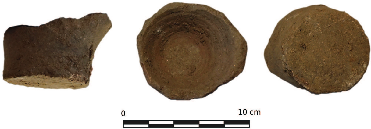
Fig. 5 – Fond de cruchon, vue de profil, du dessus et du dessous.

D'autre part (fig. 5), une seconde céramique n'est présente que par un fond, et le fort émoussement des bords de ce dernier indique qu'il s'agit là d'un fragment ancien, ré-utilisé à l'état de fragment. Cette céramique est peu caractérisée, mais semble s'apparenter à un cruchon. Le fond est étroit (diam. 6,3 cm) et le départ des bords indique qu'ils étaient évasés (hauteur max : 5,3 cm ; diam. max. : 8,5 cm). Un départ d'anse est visible d'un côté.