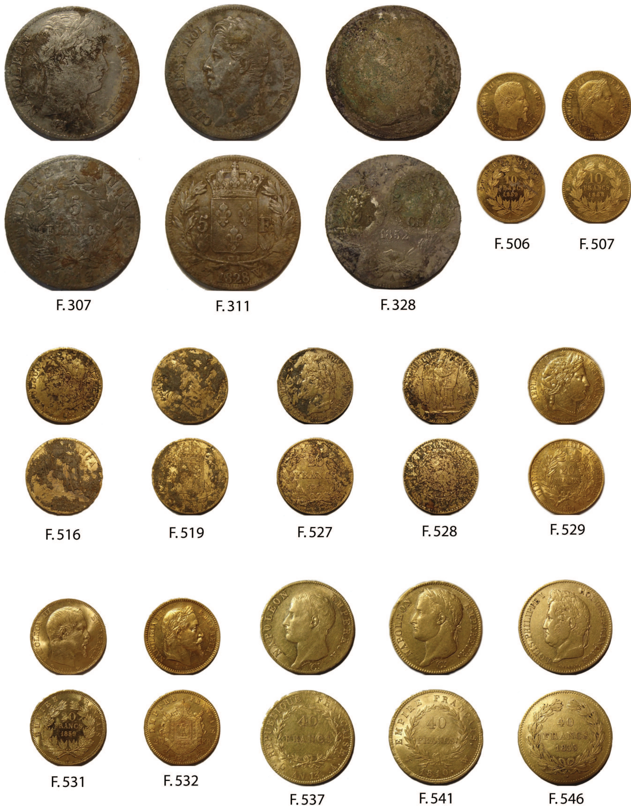
Fig. 12 – Types monétaires présents dans le dépôt de Montreverd. Les renvois sont faits à l'ouvrage de référence (Franc V)