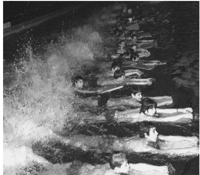
Figura 3. Piscina de Montreuil 1969.

En cuanto a establecer el trabajo educativo, se observa que todos abandonaron el aprendizaje instrumental de la brazada en cuatro fases para optar por el uso de las situaciones pedagógicas más globales de enseñanza con los estudiantes que no sabían nadar. En las nuevas piscinas climatizadas todo el año, los dispositivos de suspensión de los estudiantes (Trotzier o potencia) fueron sustituidos por equipo flotante (cinturón, tabla) liberando de este modo las habilidades motoras acuáticas y el movimiento de los estudiantes. Algunos profesores también mostraron ingenio en la fabricación de equipos para facilitar temporalmente la flotación de sus estudiantes. Evidenciado por la creación de medias planchas atadas por elástico (antepasado de pull-buoy) que, colocados en los tobillos, permitió aumentar la horizontalidad del cuerpo mediante la reducción de la resistencia frontal para avanzar. Con los estudiantes más avanzados, continuaron usando situaciones analíticas para refinar sus acciones técnicas de nadadores: perfeccionamiento del nado, virajes y salidas. En el Instituto de Secundaria, al final del ciclo, la evaluación se centró generalmente en una sola prueba, a veces cronometrada, que van desde 25 metros a 100 metros, ofreciendo o no a los estudiantes la oportunidad de elegir las formas de desplazamiento ventral o dorsal, con o sin la ayuda de material de flotación.