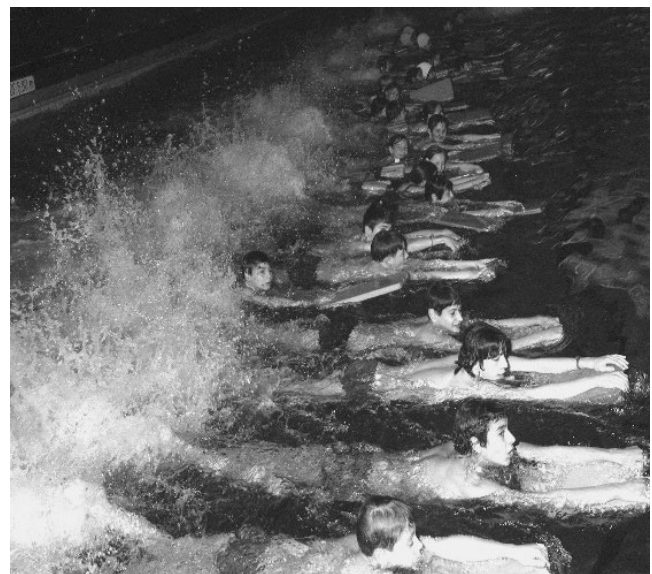
Figura 3. Piscina de Montreuil 1969.

En cuanto a establecer el trabajo educativo, se observa que todos abandonaron el aprendizaje instrumental de la brazada en cuatro fases para optar por el uso de las situaciones pedagógicas más globales de enseñanza con los estudiantes que no sabían nadar. En las nuevas piscinas climatizadas todo el año, los dispositivos de suspensión de los estudiantes (Trotzier o potencia) fueron sustituidos por equipo flotante (cinturón, tabla) liberando de este modo las habilidades motoras acuáticas y el movimiento de los estudiantes. Algunos profesores también mostraron ingenio en la fabricación de equipos para facilitar temporalmente la flotación de sus estudiantes. Evidenciado por la creación de medias planchas atadas por elástico (antepasado de pull-buoy) que, colocados en los tobillos, permitió aumentar la horizontalidad del cuerpo mediante la reducción de la resistencia frontal para avanzar. Con los estudiantes más avanzados, continuaron usando situaciones analíticas para refinar sus acciones técnicas de nadadores: perfeccionamiento del nado, virajes y salidas. En el Instituto de Secundaria, al final del ciclo, la evaluación se centró generalmente en una sola prueba, a veces cronometrada, que van desde 25 metros a 100 metros, ofreciendo o no a los estudiantes la oportunidad de elegir las formas de desplazamiento ventral o dorsal, con o sin la ayuda de material de flotación.