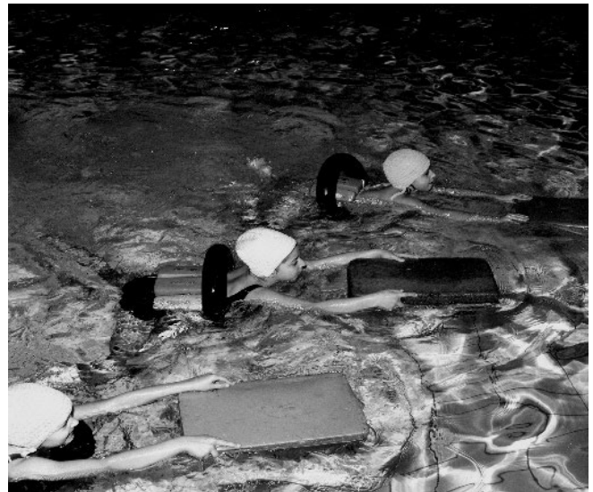
Figura 2. Piscina de Montreuil 1969 31 .

Las implementaciones pedagógicas entonces defendidas eran de naturaleza colectiva y mixta en las cuales la competición era a priori una fuente suficiente de motivación para iniciar y entrenar un máximo de estudiantes en la práctica de la natación deportiva. En cuanto a la evolución de la evaluación de los certificados (Bachillerato), se modificó entre 1959 y 1972, de 50 m de estilo libre no cronometrado a 50 m de estilo libre cronometrado (1966), luego a 50 m cronometrado (1972) eligiendo un nado deportivo de acuerdo con las regulaciones de la Federación Internacional de Natación Amateur (FINA), entre los cuatro estilos (mariposa, espalda, braza, crol o estilo libre). Esta evolución docimológica refleja la introducción del cronómetro y el cumplimiento de las normas reglamentarias específicas de cada deporte en la evaluación y la apreciación del valor físico del alumnado durante un examen escolar. Es en este contexto escolar marcado por la deportivización de la educación física y la masificación de la fuerza