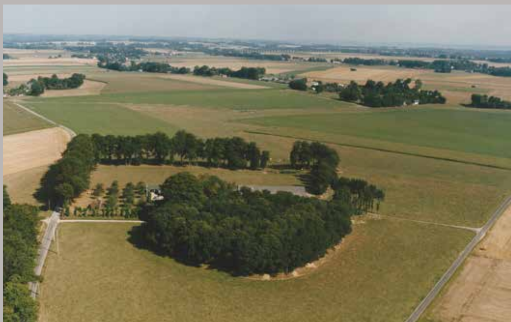
ill. 1 : La motte de Rames

derrière une ferme (ill. 1, vue aérienne). L'élément central, qui a sans doute été le support d'une maison-forte, est une motte rectangulaire d'environ 20 m sur 12 m, haute de 2 m. Tout autour règne une double ceinture de fossés, le premier à fond plat, le second à profil en V. Rarement observé ailleurs en pays de Caux, ce dispositif n'est pas sans rappeler la double enceinte fossoyée de Baynard Castle à Cottingham (Yorkshire), un des principaux châteaux de la famille d'Estouteville en Angleterre, reconstruit à la fin du XII e siècle. À l'est, la berme qui sépare les deux fossés s'élargit pour former une plate-forme où se voient de nombreux débris de constructions. Plusieurs documents font état de la présence d'une chapelle Notre-Dame dans le château au XV e siècle, et un pont-levis y est encore mentionné au XVII e siècle 2 .