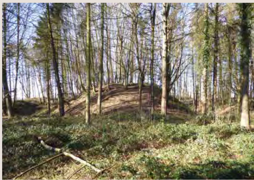
ill. 1 : La motte d'Étoutteville