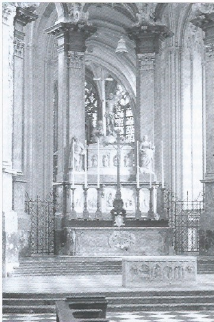
Fig. 3 – Fécamp, abbatale de la Trinité, vue du chœur (avant 2007). Au premier plan se trouve le coffre sculpté du XII e siècle improprement appelé « sarcophage des ducs ». L'autel majeur à la romaine, visible au deuxième plan, fut érigé au milieu du XVIII e siècle. Juste derrière s'élève, entre deux des colonnes du rond-point, le retable du XVIII e siècle dans lequel furent intégrés les vestiges de l'autel commandé par l'abbé Antoine Bohier en 1507 : en haut, la châsse en marbre blanc, flanquée par les deux statues de saint Taurin et sainte Suzanne ; en dessous, les reliefs représentant notamment à gauche et à droite Richard II et Richard I er . En 1942, les cercueils en plomb ont été retrouvés sous les deux reliefs plus au centre qui montrent la Trinité et la Pentecôte.