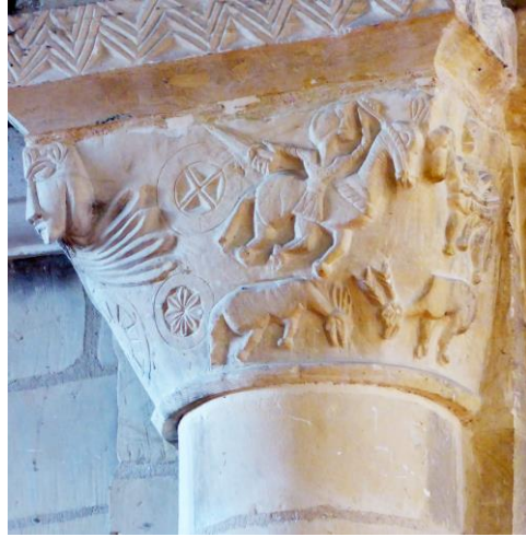
Fig. 10 : Personnage au marteau et combat singulier. Fig. 11 : Deux cavaliers, une biche et un cerf.

À côté de ces scènes profanes, le décor de trois autres chapiteaux relève davantage, semble-t-il de l'iconographie des saints. L'un d'eux, à la composition particulièrement riche, évoque peut-être deux épisodes de la légende de saint Martin. En bas à gauche, un groupe de trois hommes tire sur une corde pour renverser une statue d'idole. Cette statue a une grosse tête ronde et ses bras sont légèrement écartés ; elle est en train de basculer. En haut à gauche, deux hommes se tiennent debout de part et d'autre d'un objet étroit et allongé, avec une pointe dressée en l'air. La composition évoque celle des représentations les plus anciennes du Partage du manteau : le saint évêque de Tours y est à pied et non à cheval comme dans ses représentations ultérieures, le morceau de vêtement pend entre les deux hommes et l'on voit l'épée dans la main de Martin. À l'appui de cette interprétation, on notera que l'homme de droite met la main à sa ceinture et semble avoir le bas du corps en partie dénudé (Fig.12). Le deuxième chapiteau de ce groupe montre deux hommes décapités qui portent chacun leur tête à bout de bras. Au-dessous de ces « céphalophores », il y a comme une surface ondulée et, à la base, une ligne transversale fortement marquée en dents-de-scie. Ce pourrait être une évocation des eaux de la Seine où, selon une version normande de la passion de saint Denis, la tête du saint martyr aurait été jetée, avant de finir par s'échouer sur la grève de Chef-de-Caux (Fig.13).