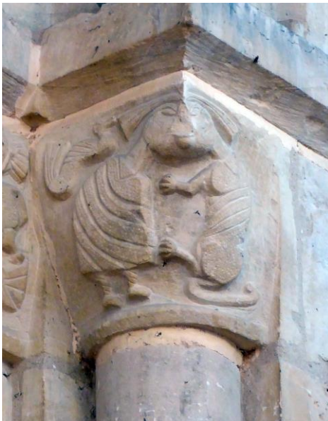
Fig. 9 : Femmes aux longues tresses.

Le même thème est illustré de manière un peu différente sur un autre chapiteau montrant côte à côte une femme et un quadrupède à corps de chien, avec une tête commune servant de crochet d'angle et une coiffure à deux longues tresses soulevées d'un geste de la main ; c'est sans doute à la suite d'une maladresse de restauration que le bras droit de la femme a été séparé du corps (Fig.9).