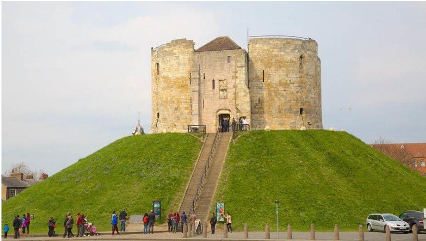
Fig. 4 : La motte de la Tour Clifford à York.