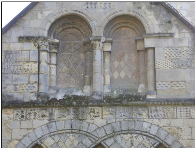
Fig. 6 : Frise sculptée du pignon nord du transept.

La principale originalité de l'église romane de Graville réside dans son décor architectural. À l'extérieur, la partie haute des murs du transept s'orne de grandes arcatures plates entrecroisées, dispositif relativement peu fréquent dans le duché ; on a évoqué, en l'occurrence, de possibles modèles anglais (fig.5). À cela s'ajoute, au sommet du pignon nord du transept, une longue frise de décors sculptés en méplat, présentant une grande variété de motifs géométriques, végétaux et animaliers (fig.6).