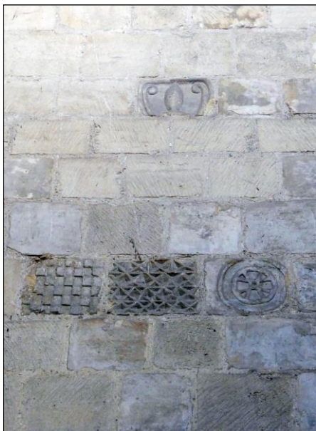
Fig. 7 : Mur oriental du bras nord du transept, pierres d'appareil à décors géométriques.

Cette similitude, particulièrement frappante lorsque l'on compare le transept de Graville à celui de Secqueville-en-Bessin par exemple, est aisément explicable. La pierre utilisée pour les appareils et les décors sculptés de la collégiale est une variété de pierre de Caen, matériau très apprécié des bâtisseurs romans. Extraite des carrières de la plaine de Caen et du Bessin, elle fut exploitée et commercialisée à grande échelle aux XI e et XII e siècles. Les livraisons à longue distance se faisaient par la voie maritime, les éléments de décors étant le plus souvent façonnés à proximité des carrières et arrivant tout taillés sur le chantier, prêts à être posés. Cela n'explique pas seulement la présence, sur le parement intérieur du bras nord du transept, de plusieurs pierres sculptées de motifs géométriques (fig.7).