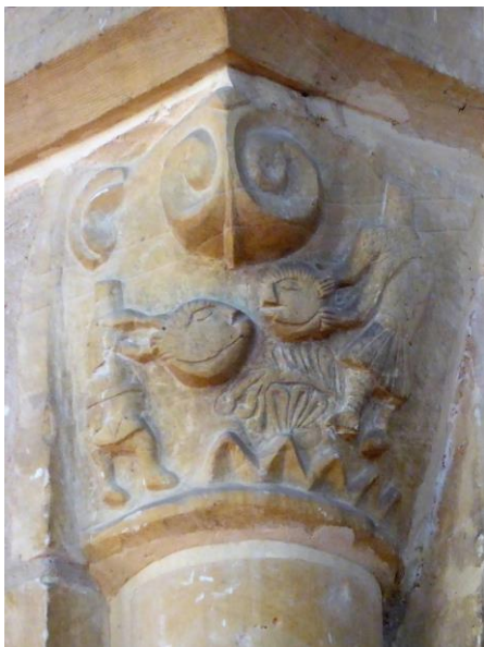
Fig. 13 : Deux personnages céphalophores.