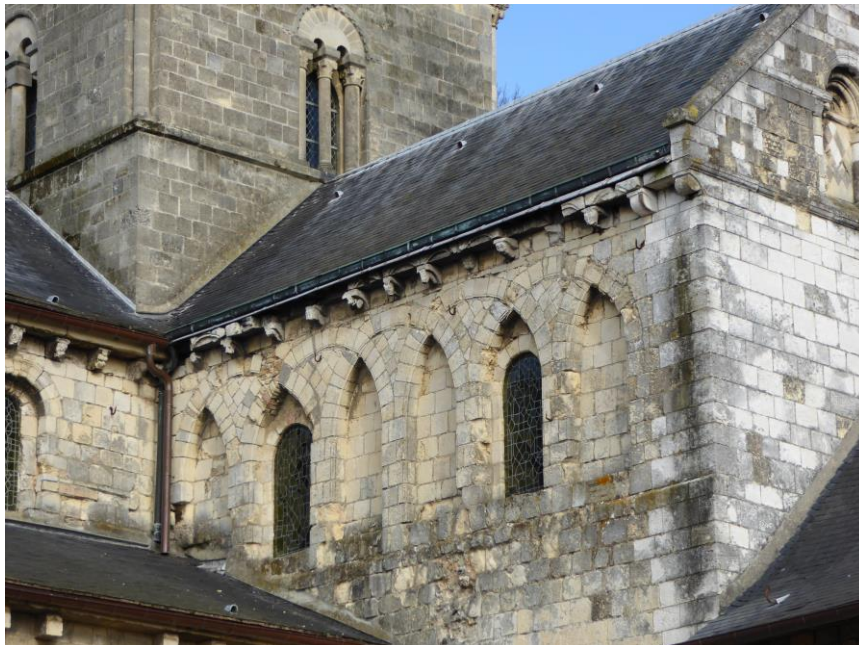
Fig. 5 : Décor d'arcatures entrecroisées du croisillon sud du transept.

L'ampleur et la qualité des parties romanes de l'église de Graville compensent fort heureusement ce silence des textes : manifestement, un édifice d'importance majeure a remplacé, vers le dernier quart du XI e siècle, l'oratoire primitif du haut Moyen Âge.