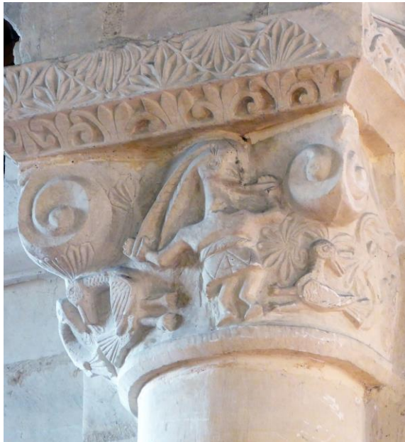
Fig. 8 : Femmes aux longues tresses.

Le décor d'un chapiteau s'organise autour d'un étrange personnage à tête d'oiseau, souvent décrit comme brandissant un sabre. Un examen attentif montre qu'il s'agit en réalité d'une femme écartant des deux mains les longues tresses de sa chevelure. C'est la créature sensuelle et tentatrice, allégorie du péché de la luxure (Fig.8).