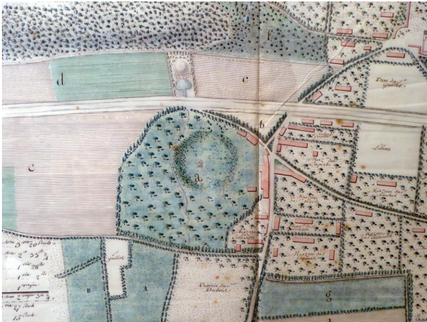
Fig. 3 : Extrait d'un plan de Graville, avec la motte de l'ancien château des Malet (Musée de Graville, XIX e siècle)

Il est difficile de se faire une idée précise de l'aspect du château de Graville au temps des ducs. Plusieurs plans anciens montrent au bas de la rue qui monte au prieuré une vaste motte ovalaire, avec au nord et à l'est une parcelle en arc de cercle évoquant le tracé d'une enceinte annexe, ou « basse-cour » (fig.3).