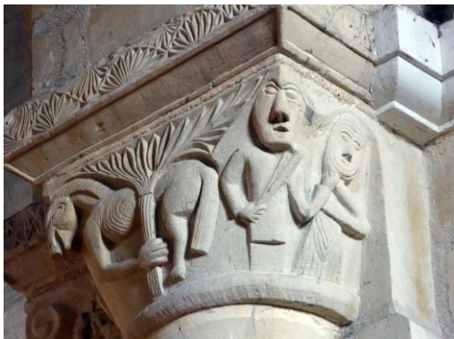
Fig. 14 : Sainte Honorine et son bourreau ?

Le troisième chapiteau, au style nettement plus sophistiqué que les précédents, contient peut-être la représentation la plus ancienne de la sainte patronne de l'église de Graville, figurée en martyre : une femme voilée, qu'un homme saisit par le cou et semble sur le point de frapper avec des verges (Fig.14).