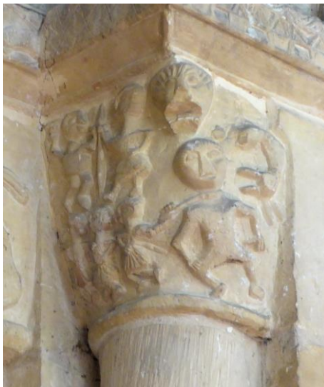
Fig. 12 : Le Bris des idoles et le partage du manteau.