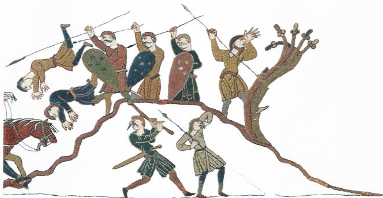
Fig. 9 Les Anglais sur la colline. Détails de la Tapisserie de Bayeux – XI e siècle.

ses côtés s'identifierait dans ce cas à son fils Canaan, maudit par Noé pour le même motif. Pour les Anglais comme pour les Normands, le pied de la colline s'apparenterait ainsi au coin des damnés.