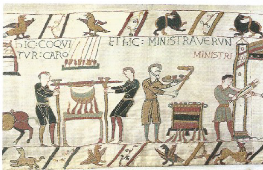
Fig. 15 La préparation du repas au camp de Hastings. Détail de la Tapisserie de Bayeux - 11 e siècle.

normande (fig. 15). L'association de tous ces éléments rappelle beaucoup l'histoire d'un des personnages de la Chanson de Guillaume . Il s'agit de Renouart, un esclave de noble naissance qui a été affecté aux cuisines du roi, où il est chargé de la cuisson des viandes 19 . Ne supportant plus de rester enfermé au palais, il quitte son poste pour aller se mettre au service de Guillaume d'Orange, qui prépare une campagne contre les Sarrasins. Dans la cuisine du camp, il est en butte aux mauvaises plaisanteries de deux marmitons qui, pendant son sommeil, lui brûlent sa barbe et sa moustache, puis tentent de lui voler son bien le plus précieux, son grand tinel, cette lourde barre de bois qui sert à suspendre les chaudrons. Ayant réussi à les mettre hors d'état de nuire, il obtient ensuite la permission de se joindre aux combattants. La bataille de Larchamp va lui donner l'occasion de prouver sa force et sa vaillance ; avec son tinel pour seule arme, il accomplira maints exploits et deviendra un des meilleurs compagnons de Guillaume. Dans sa forme actuelle, le récit n'est pas antérieur au XIII e siècle, mais cette histoire de prisonnier de haut rang livré aux brimades humiliantes des aides-cuisiniers est la reprise d'un thème plus ancien, déjà présent dans la Chanson de Roland . On y voit le traître Ganelon arrêté sur l'ordre de Charlemagne et confié à la garde des garçons de cuisine du camp qui, déjà dans cette version, s'en prennent à sa barbe et à ses moustaches 20 .