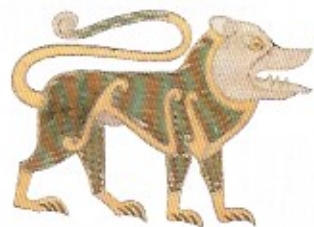
Fig. 13b Le lion du Livre de Durrow. The Board of Trinity College Dublin, Ms 57 E. 191 v.