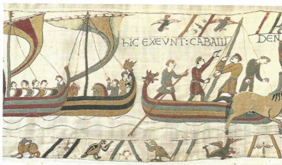
Fig. 6 Le lâcher de deux oiseaux à l'approche de la côte anglaise. Détails de la Tapisserie de Bayeux - XI e siècle.

La clé de l'image se trouve probablement, là encore, dans l'histoire de Noé : pour savoir s'il y a une terre à proximité, Noé envoie un corbeau. L'oiseau revient sur le navire, ce qui indique qu'il n'a trouvé aucun endroit pour se poser. Puis Noé lâche une colombe, qui, après plusieurs aller-retour, revient avec un rameau d'olivier dans le bec, ce qui montre que le niveau des eaux a commencé à baisser et que Noé pourra donc bientôt faire sortir les animaux de l'arche. C'est précisément la scène que nous voyons se dérouler ensuite, en deux séquences parallèles. Au registre principal, celui du récit de l'expédition de 1066, les chevaux descendent du bateau, tandis que la bordure supérieure, consacrée au récit de la Genèse, nous montre un cortège de trois animaux d'espèces différentes marchant vers la droite, comme s'ils sortaient eux aussi du bateau (fig. 7). Le recours à l'image de Noé dans la scène du chantier naval est donc bien un choix délibéré : il confère à l'expédition de Guillaume une dimension biblique.