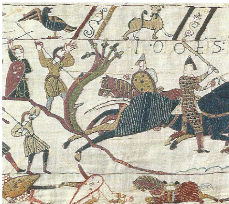
Fig. 17 Le combat autour de la colline, détail. Détails de la Tapisserie de Bayeux – XI e siècle.

le front, ni pourquoi sa barbe n'est pas blanche comme sur les représentations précédentes (fig. 17). En revanche, on reconnaît là les attributs littéraires du personnage d'Olivier, le célèbre compagnon de Roland de Roncevaux. La Chanson de Roland le décrit comme barbu, et l'on se souvient de ces trois vers fameux qui annoncent le drame de Roncevaux : « Olivier est monté sur une hauteur. / Il regarde sur sa droite par une vallée herbeuse / et voit venir l'armée des païens » 24 . L'hypothèse d'une correspondance fortuite ne peut certes être écartée, mais quand on voit que l'homme de la Tapisserie est frappé dans le dos par la lance d'un chevalier arrivant à bride abattue sur une monture de couleur fauve, il devient très difficile de s'en tenir à cette explication. En effet, voici comment la Chanson de Roland rapporte le coup fatal qui va entraîner la mort d'Olivier : « Le calife monte un cheval fauve. / Il le pique avec vigueur de ses éperons d'or / et court frapper Olivier par derrière, en plein dos. » 25 . Ces vers ont été écrits postérieurement à la Tapisserie de Bayeux, mais l'existence d'une relation plus ancienne de la bataille de Roncevaux est prouvée entre autres par un document du troisième tiers du XI e siècle, la Nota Emilianense , où il est déjà question d'Olivier, de Roland et de l'embuscade mortelle tendue par les Sarrasins au pied du col de Cize 26 .