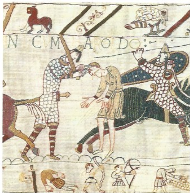
Fig. 10 Scène de décapitation. Détails de la Tapisserie de Bayeux – XI e siècle.

Parallèlement à cette métaphore biblique, il se peut que la version de la flèche dans l'œil ait eu également pour but de montrer que Harold était voué au même sort que celui subi