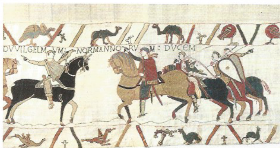
Fig. 1 Guy de Ponthieu remet Harold à Guillaume. Détails de la Tapisserie de Bayeux – XI e siècle.