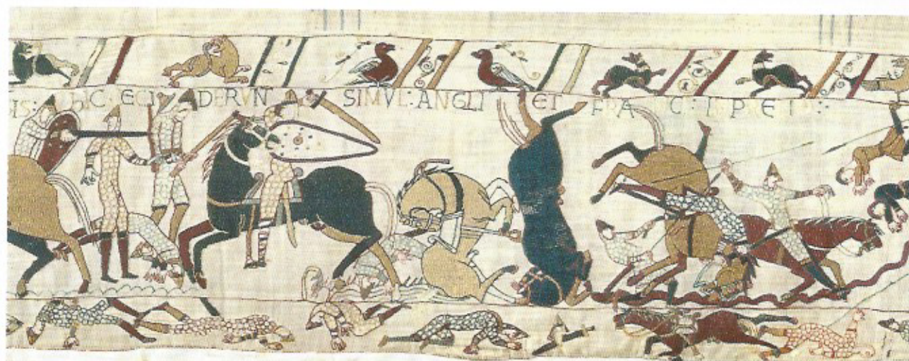
Fig. 8 Les deux colombes au-dessus de la scène de bataille. Détails de la Tapisserie de Bayeux - XI e siècle.

Dans ce qui apparaît ainsi comme une véritable métaphore du Jugement dernier, seul semble momentanément sauvé le groupe de quatre Anglais faiblement armés qui, tels Noé et ses trois fils déposés par les eaux au sommet de la montagne, a trouvé refuge sur une hauteur (scène 53). En examinant de près la scène, on constate que l'un des quatre, à l'écart du groupe, est représenté avec une barbe qui le désigne a priori comme relativement âgé, mais aussi que les trois autres observent des postures identiques et se ressemblent effectivement comme trois frères, avec pour signe distinctif une épaisse moustache (fig. 9). Il n'y a dans cette partie de la broderie qu'un seul autre personnage pour porter le même attribut, c'est l'Anglais armé d'une hache qui se trouve coincé avec un jeune homme au pied de la colline, directement exposé aux assauts des cavaliers normands ; tous deux semblent terrorisés comme s'ils vivaient leur dernier instant. Vêtu du même habit noir que l'un de ceux du dessus et blond comme lui, l'homme à la hache pourrait donc être un autre double du personnage de Cham, l'un des trois fils de Noé, chassé pour avoir manqué de respect à son père. Le jeune qui est à