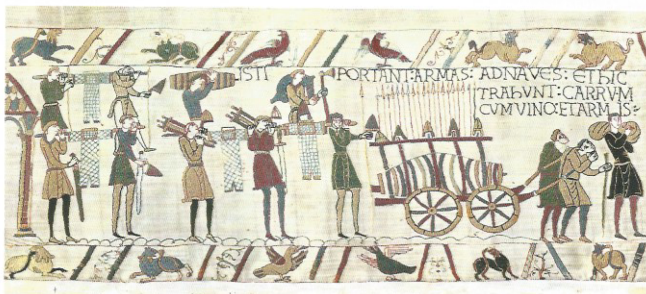
Fig. 11 Transport d'armes et de vivres dans les navires. Détails de la Tapisserie de Bayeux - XI e siècle.

Un autre exemple de l'utilisation de sources littéraires croisées, avec une référence à la mythologie antique, nous est fourni par la scène de l'embarquement des armes et des vivres dans les navires (scène 37). À première vue, ce tableau d'une grande richesse descriptive a toute l'apparence d'authenticité d'une scène saisie sur le vif. Cependant, on peut s'étonner que, en tête du convoi, deux hommes soient attelés à un grand chariot chargé d'une énorme barrique de vin et d'une quantité de casques et de lances, alors que, derrière eux, leurs camarades portent apparemment sans effort, qui un tonnelet sur l'épaule, qui une lance et un casque