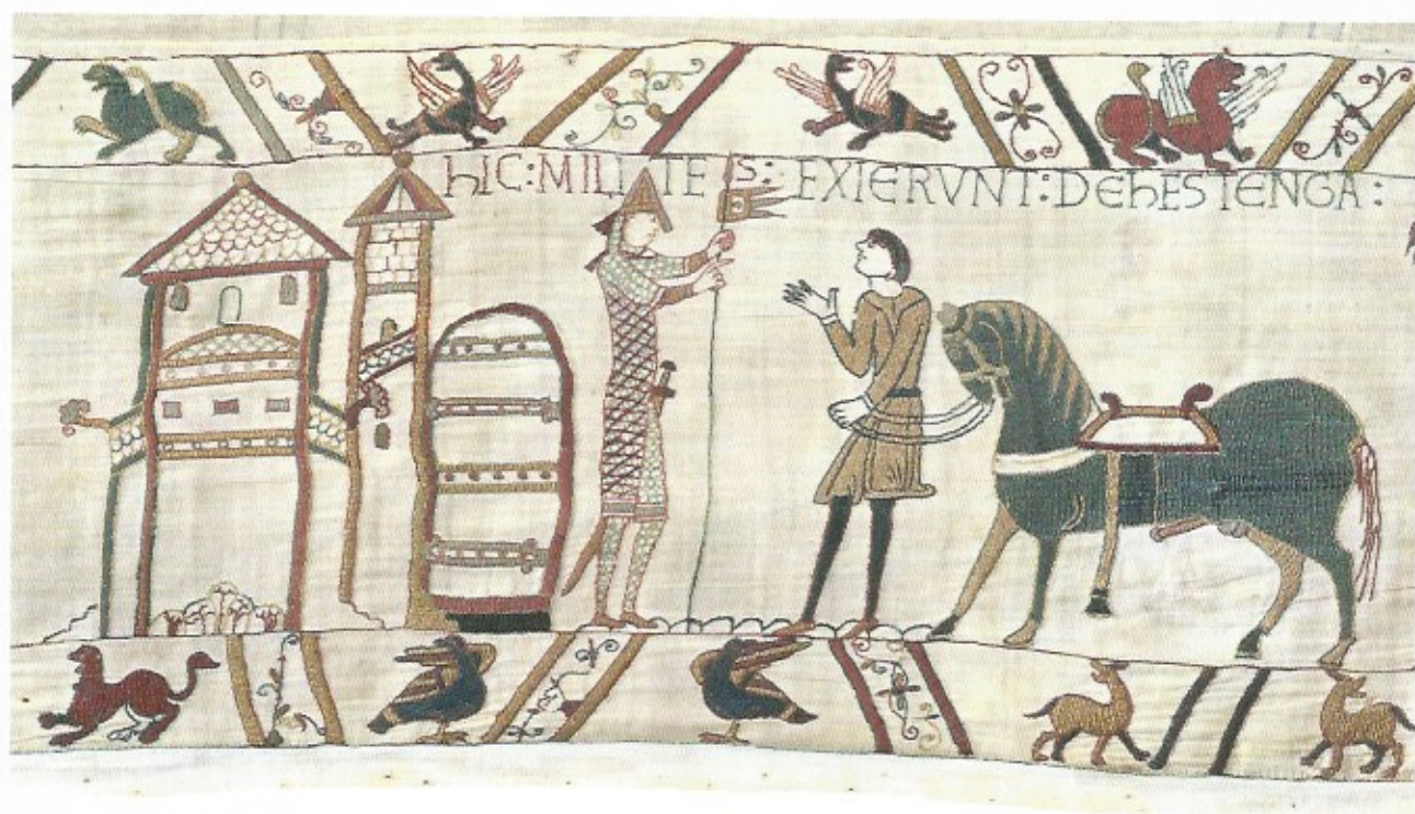
Fig. 16 La sortie du camp de Hastings ; Guillaume et son palefrenier. Détails de la Tapisserie de Bayeux – XI e siècle.