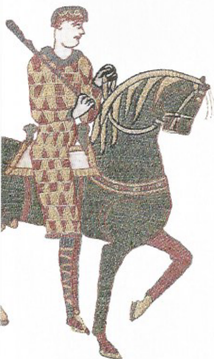
Fig. 11 Guillaume à l'entrée du gué du Couesnon. Détails de la Tapisserie de Bayeux. XI e siècle.

Or, à l'autre extrémité du gué que s'apprête à traverser Guillaume, au registre inférieur de la scène 17, se trouve précisément la représentation d'un centaure, sur le modèle iconographique