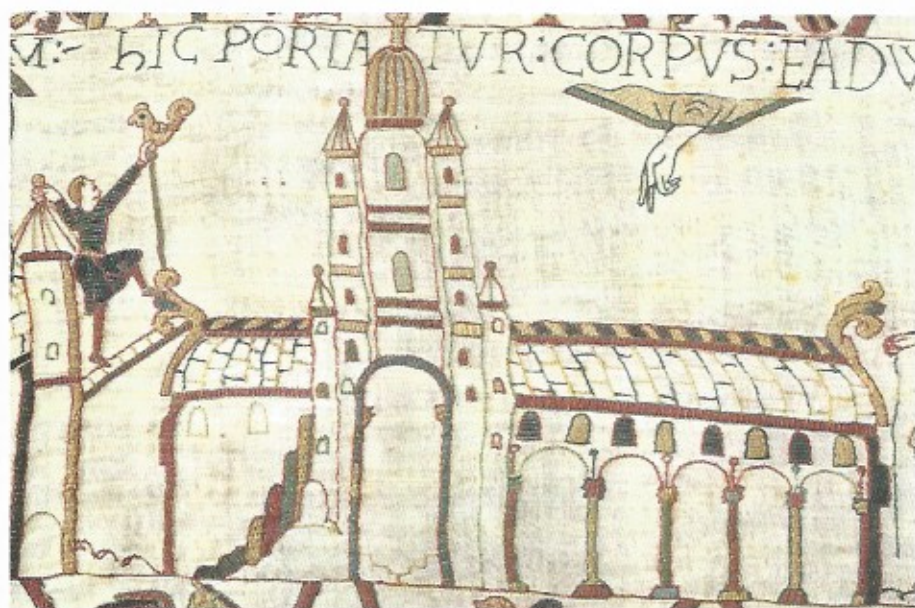
Fig. 18 L'église de Westminster. Détail de la Tapisserie de Bayeux – XI e siècle.

mort, avec différents personnages qui se tiennent à son chevet (scène 27), est remarquablement proche de cette narration. Parmi les détails les plus troublants, l'image de la reine Édith, assise au pied du lit en train de pleurer, et le geste d'Édouard tendant la main vers Harold : ces deux détails correspondent très exactement à la scène décrite par l'hagiographe 28 . Il en est de même pour la fameuse représentation, abondamment commentée par les archéologues, de l'église de Westminster (scène 26). S'il est vrai qu'elle est sans doute très proche de l'aspect que devait présenter cette église en 1066, peu de spécialistes semblent cependant s'être avisés que la grappe de sept ressauts et contreforts qui monte à l'assaut d'une des quatre tourelles confortant les étages de la tour est architecturalement très improbable (fig. 18). Il faut en déduire que le dessinateur ne montre pas l'église telle qu'il l'a vue, mais qu'il a seulement essayé de la représenter telle qu'elle est décrite dans la Vie d'Édouard , avec ses hautes arcades, son arc triomphal, sa toiture de plomb et son imposante tour de croisée qui « s'enfle d'une multitude de tourelles dans un beau mouvement ascendant » 29 .