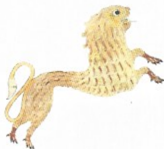
Fig. 13a Le lion de l'Évangélaire d'Echternach. Bibliothèque nationale de France. Manuscrit latin 9389. Évangélaire quattuor, fol. 71r.