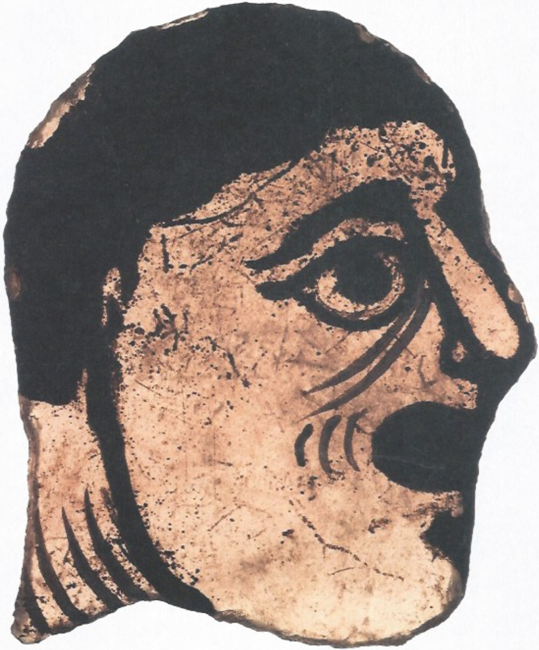
III. 27 Fragment de vitrail, abbaye Notre-Dame de Jumièges (Seine-Maritime), XII e siècle Rouen, musée des Antiquités