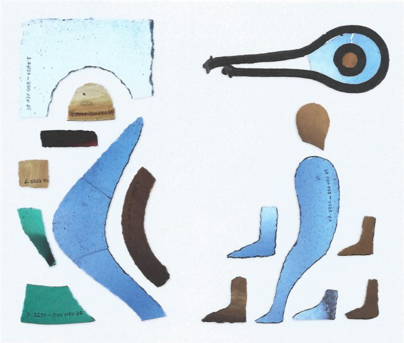
•III. 25 Fragments de vitraux de Notre- Dame-de-Bondeville (Seine-Maritime), VII e siècle Rouen, musée des Antiquités

Vitrail de couleur marron, en arc de cercle : H. 82 ; L. 10-15 mm Plomb en forme d'« œil », comprenant un verre bleu, lui même enserrant un disque marron contenu par un plomb : L. 140 mm Vitrail bleu pouvant représenter une forme anthropomorphe (jambe ?) : H. 124 mm ; L. 3-31 mm.