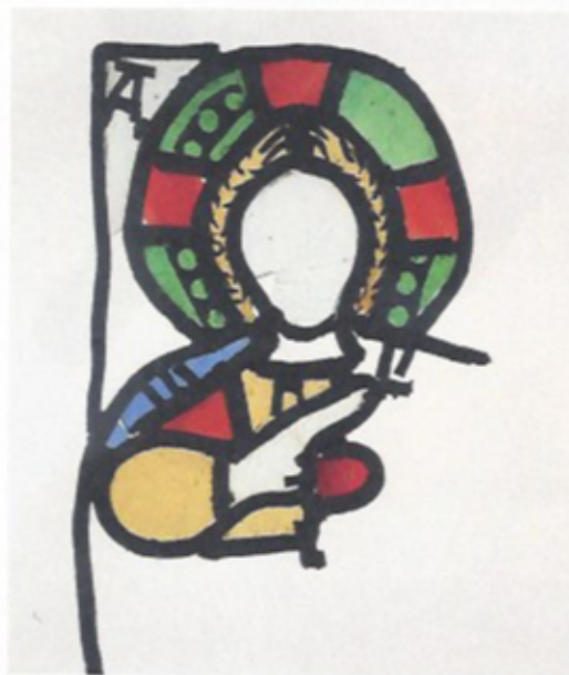
*Ill. 26 Buste de Christ, abbaye San Vincenzo al Volturno (Italie), IX e siècle, vitrail, H. 17 ; L. 9 cm Venafrò, Musée archéologique

En l'absence d'informations sur le lieu exact de leur découverte, ces fragments de la collection de Jumièges sont difficiles à dater. Divers rapprochements avec les décors des manuscrits normands, notamment avec ceux de Jumièges, ne permettent pas d'exclure une date assez proche de la fin du XI e siècle. En tout état de cause, leur réalisation semble antérieure aux plus anciens vitraux du Mans et de Saint-Denis, stylistiquement plus évolués (second quart du XII e siècle).