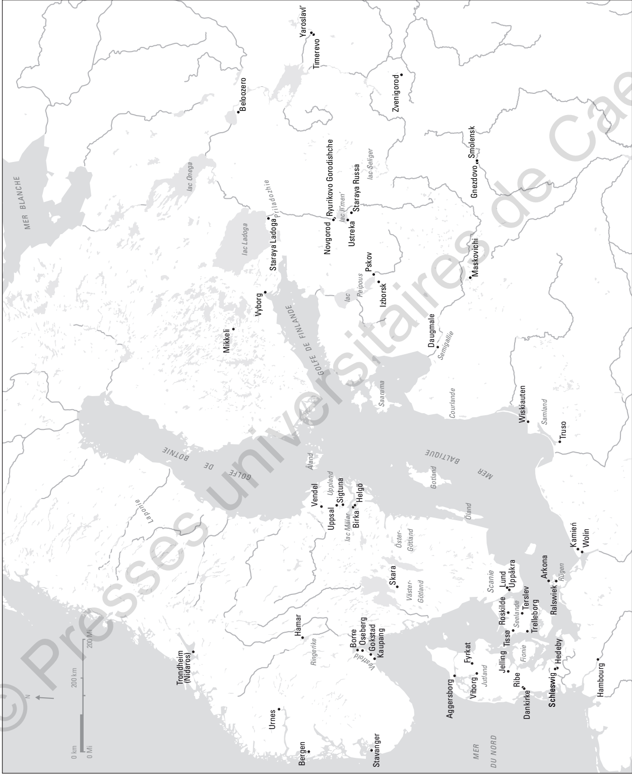
Fig. 2 Principaux lieux cités dans le volume: des rives de la mer du Nord au nord-ouest de la Russie.