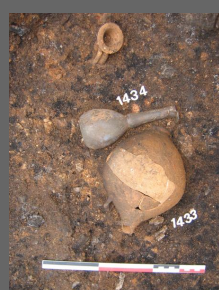
Fig. 10 : Dépôt secondaire placé sur la couche de résidu de l'aire de crémation 250

Il est convenu que de telles méthodes sont plutôt l'apanage des fouilles programmées. Pourtant, une mise en application dans un cadre préventif demeure somme toute possible si les moyens et le temps le permettent.