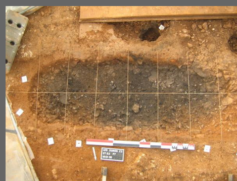
Fig. 9 : Aire de crémation 83 en cours de fouille (A.-S. Vigot, Eveha, 2008)

De septembre 2007 à février 2008, la nécropole antique des Dunes à Poitiers (86) a fait l'objet d'une fouille préventive sous la houlette de Anne-Sophie Vigot (Eveha, Caen). Quelques 150 structures funéraires ont été découvertes et ont été datées du Ier au IIIe siècle de notre ère avec un abandon définitif de la nécropole au IVe siècle (fig. 8). Les vestiges mis au jour au cours de cette intervention ne représentent cependant qu'une petite partie de la nécropole. L'essentiel de l'occupation est donc funéraire avec 60 inhumations et 87 structures liées à la pratique de la crémation (dépôts primaires et secondaires étudiés par V. Brunet). Notons ici la concomitance des deux modes de traitement du cadavre à une période donnée (inhumation / crémation).