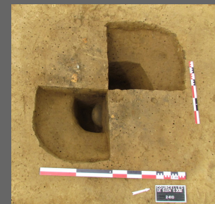
Fig. 5 : Fouille en quarts opposés de la structure 2410

Relativement bien conservées, toutes les structures ont fait l'objet d'une fouille en quarts opposés afin de documenter deux coupes par fait (fig. 5). Cette méthode a permis d'appréhender un grand nombre d'architectures funéraires. Les vases ossuaires ont été prélevés puis fouillés minutieusement en laboratoire tandis que les amas osseux ont fait l'objet d'analyses taphonomiques in situ . Ces derniers ont été dégagés entièrement sur le terrain puis démontés par passe et par quart (fig. 6 et 7). Si cette méthode nous a permis de recueillir bon nombre d'informations sur le contenant, elle n'en demeure pas moins problématique pour le contenu. En effet, la fouille fine d'un tel gisement mobilise du temps, nécessite la présence d'un archéo-anthropologue en permanence et risque d'altérer le dépôt osseux. En effet, lors du prélèvement par passe et/ou par quart, la fragmentation des restes est inévitable et augmente considérablement le temps d'étude en post-fouille. Un prélèvement en motte est donc préférable à la fouille in situ . S'il y doit y avoir dégagement de l'amas osseux, celui-ci doit être superficiel.