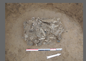
Fig. 6 et 7 : Amas osseux entièrement dégagés