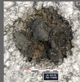
Fig. 1 et 2 : Tombes 855 (Bronze Final IIIb) et 1052 (1er âge du Fer)