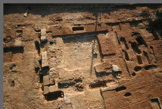
Fig. 8 : Vue aérienne de la nécropole des Dunes en cours de fouille