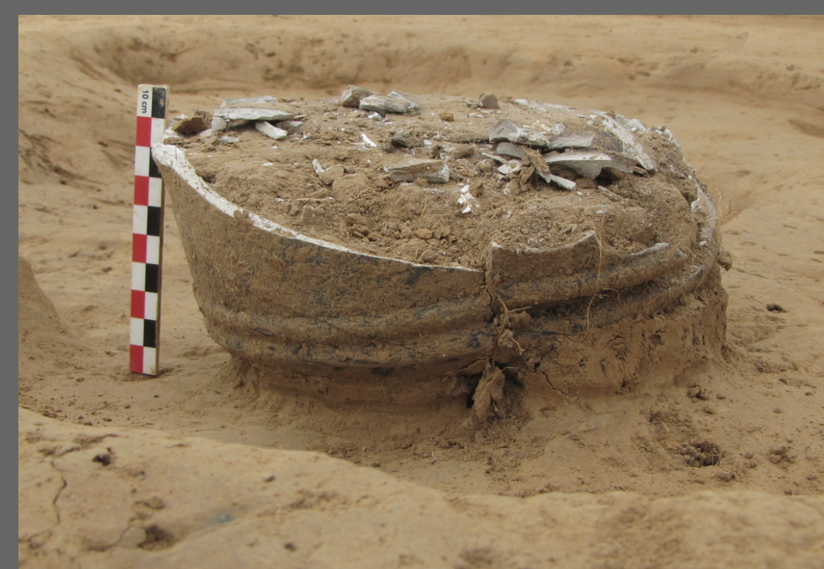
Fig. 2 : Dépôt secondaire de crémation en vase ossuaire identifié à Authie (14) - Saint Louet 2. Fig. 3 : Dépôt secondaire de résidus de crémation localisé à Courtonne-la-Meurdrac (14) - Les Hauts de Glos.