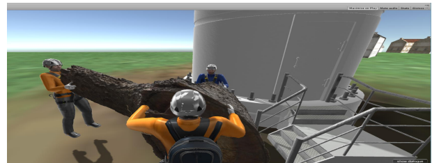
FIGURE 2 – Scénario collaboratif

mandes, soit en déterminant proactivement ces besoins. Elle utilise les actions pédagogiques décrites par le pédagogue pour guider ou corriger l'apprenant dans l'EV. Il passe ensuite le contrôle au DM pour générer le contenu ou lorsqu'une rétroaction est nécessaire. La bibliothèque d'actions pédagogiques développée jusqu'à maintenant contient cinq catégories : les actions pédagogiques (a) sur l'EV (e.g., mettre en évidence ou en transparence un objet... ) (b) sur les interactions de l'utilisateur (e.g., changer de point de vue, bloquer sa position ) (c) sur la structure du système (e.g., décrire la structure, afficher la documentation d'une entité ) (d) sur la dynamique du système (e.g., expliquer les objectifs d'une procédure ou d'une action ) et (e) sur le scénario lui-même (e.g., afficher une ressource pédagogique, expliciter les objectifs de réalisation ).