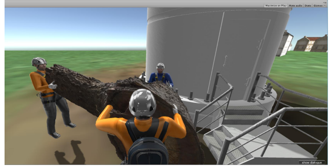
Figure 4: Scénario collaboratif expérimentale

formés sur le vocabulaire pour interagir avec les agents virtuels qui sont les membres de l'équipe et le déroulement général de l'interaction, mais aucune description de la procédure n'a été remise aux participants. La figure 4 montre une capture d'écran du scénario d'évaluation, où trois techniciens (un avatar de l'apprenant et deux agents virtuels jouant également le rôle de tuteur) collaborent pour effectuer une activité collaborative.