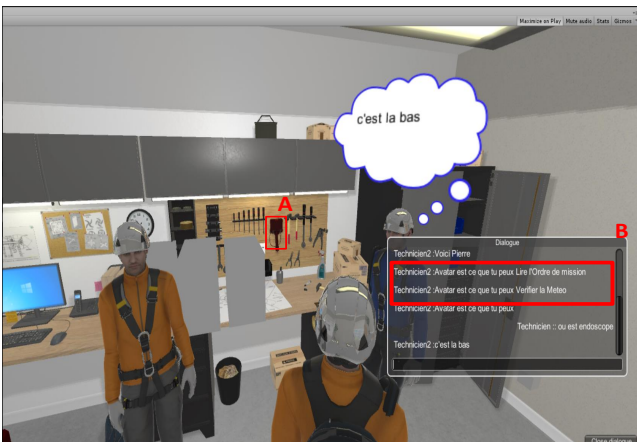
Figure 3: Exemple d'une action pédagogique

L'agent assisté à l'utilisateur dans l'une des conditions suivantes : lorsque l'action pédagogique est explicitement spécifiée dans le scénario de formation par l'enseignant, l'agent peut alors interpréter cette action dans l'action primitive pédagogique appropriée et passe le contrôle au gestionnaire de dialogue ; l'agent peut fournir une assistance pédagogique à l'utilisateur en déterminant le besoin d'information de l'utilisateur, ou lorsque l'utilisateur demande explicitement une information. Par exemple, si l'utilisateur demande à l'agent que ce qu'est l'endoscope, l'agent peut mettre en évidence l'objet "endoscope" et peut fournir la description de cet objet (fig. 3.[A]).