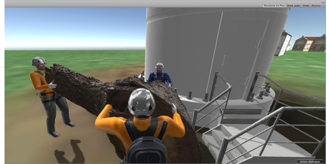
Figure 4: Scénario collaboratif expérimentale

formés sur le vocabulaire pour interagir avec les agents virtuels qui sont les membres de l'équipe et le déroulement général de l'interaction, mais aucune description de la procédure n'a été remise aux participants. La figure 4 montre une capture d'écran du scénario d'évaluation, où trois techniciens (un avatar de l'apprenant et deux agents virtuels jouant également le rôle de tuteur) collaborent pour effectuer une activité collaborative.