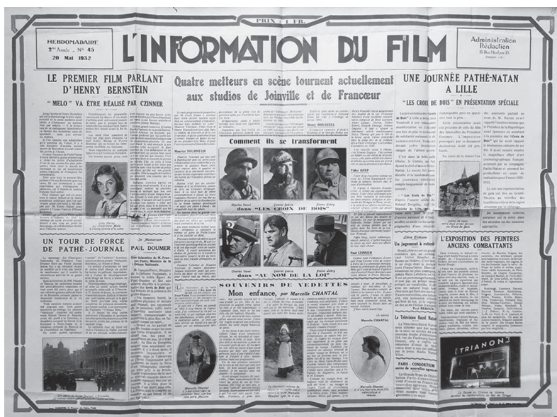
Fig. 1 – L'information du film , 20 mai 1932 (Imec, fonds Henry Bernstein)

Ce sera l'honneur de Pathé-Natan d'avoir décidé le grand dramaturge à céder les droits d'adaptation d'une de ses œuvres les plus puissantes, Mélo dont le succès au Gymnase et sur de nombreuses scènes françaises et étrangères fut considérable.