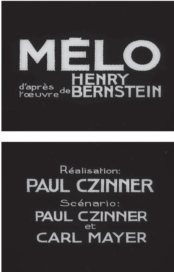
Fig. 5 - Générique de Mélo de Paul Czinner, 1932, captures d'écran

de Henry Bernstein », sur un scénario de Paul Czinner et Carl Mayer (fig. 5). Juridiquement, l'affaire n'est pas close cependant car le président du tribunal, « reconnaissant que le demandeur était mieux qualifié que quiconque pour faire valoir le droit de l'auteur » 25 , a laissé à celui-ci la faculté de saisir la justice afin de statuer sur le fond. Loin d'attendre sagement le procès, Bernstein porte alors le débat sur la place publique.