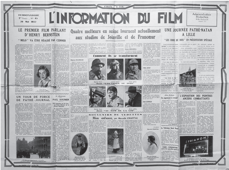
Fig. 1 – L'information du film , 20 mai 1932

Ce sera l'honneur de Pathé-Natan d'avoir décidé le grand dramaturge à céder les droits d'adaptation d'une de ses œuvres les plus puissantes, Mélo dont le succès au Gymnase et sur de nombreuses scènes françaises et étrangères fut considérable.