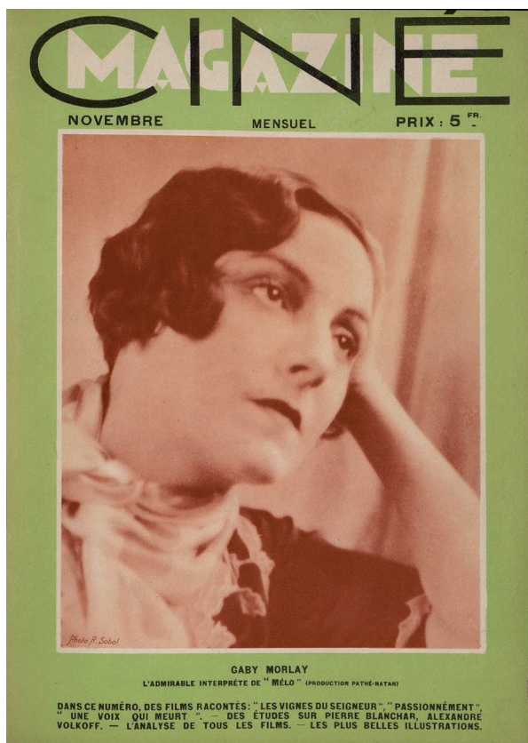
Fig. 4 – Gaby Morlay en une de Ciné-Magazine , n° 11, novembre 1932

littéraire» 23 . De son côté, Bernstein tente de faire interdire le tournage de la version française, puis émet plusieurs propositions qui ont toutes pour but de l'empêcher en l'état ainsi que d'empêcher la projection en France de la version allemande 24 .