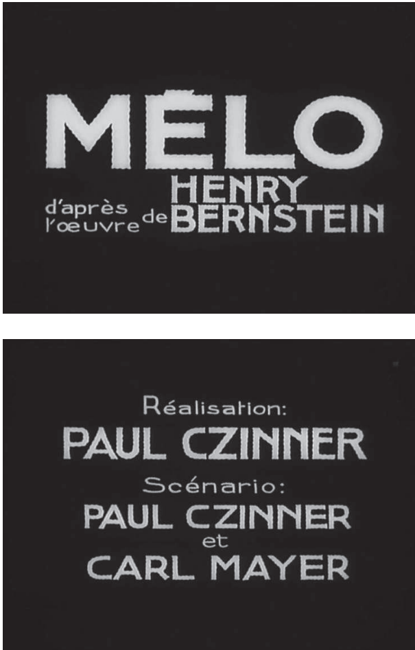
Fig. 5 – Générique de Mélo de Paul Czinner, 1932, captures d'écran

de Henry Bernstein », sur un scénario de Paul Czinner et Carl Mayer (fig. 5). Juridiquement, l'affaire n'est pas close cependant car le président du tribunal, « reconnaissant que le demandeur était mieux qualifié que quiconque pour faire valoir le droit de l'auteur » 25 , a laissé à celui-ci la faculté de saisir la justice afin de statuer sur le fond. Loin d'attendre sagement le procès, Bernstein porte alors le débat sur la place publique.